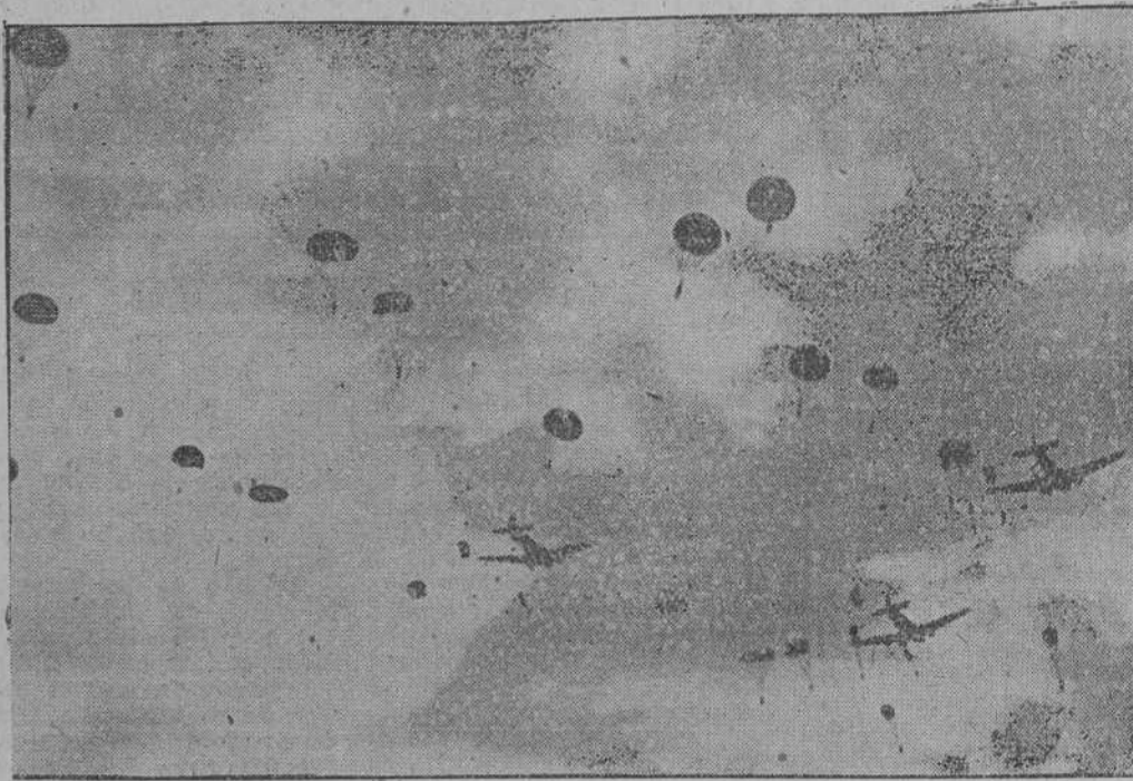
Verdaderas nubes de esta infantería del aire han descendido en numerosos puntos de la isla.