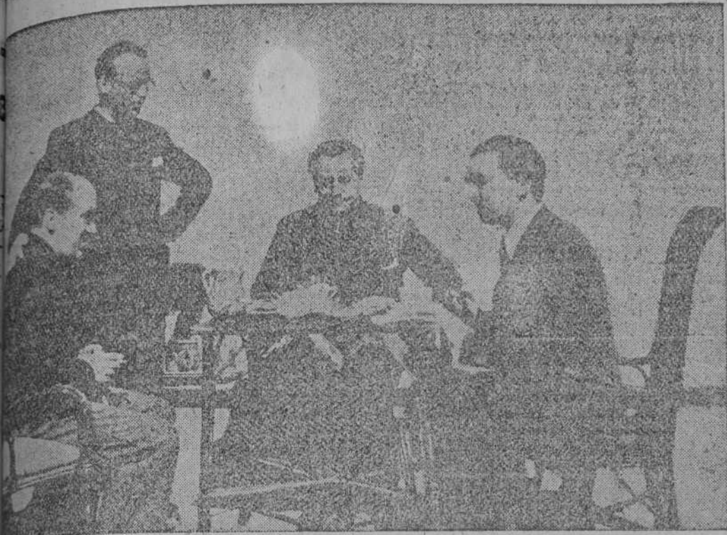
Onésimo Redondo con José Antonio, Julio Ruiz de Alda y Francisco Bravo, en el Parador de Gredos