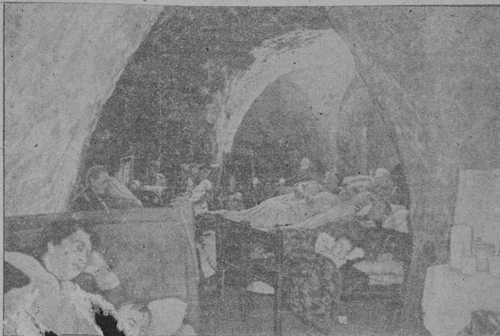
Una gruta de Abaco sirve ahora como refugio a los habitantes de un pueblo de la costa inglesa

27.000 TONELADAS HUN- DIDAS POR LOS SUB- MARINOS Berlín, 24.—Los submarinos alemanes comunican el hundi- miento de 27.500 toneladas de mercantes enemigos en el Atlántico septentrional. Entre los buques hundidos figuran tres barcos cisternas. —EFE.