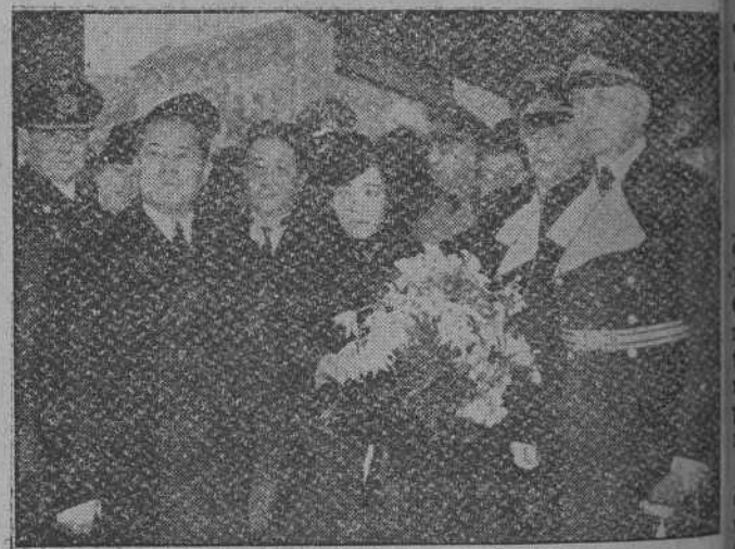
El General Oshima ha sido nombrado, por segunda vez, Embajador del Japón en Berlín. La foto muestra su llegada a la capital del Reich.