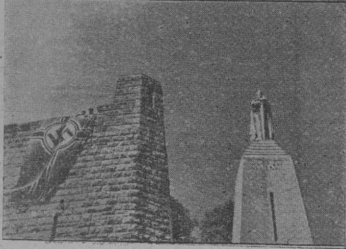
Hace 25 años empezó una de las batallas más encarnizadas de la Historia: la batalla de Verdún. La foto de arriba muestra la entrada al fuerte Douaumont a poco de ser conquistado por las tropas alemanas, en 1916. Abajo vemos la bandera alemana ondeando en el Monumento de la Victoria, después de la toma de Verdún en junio de 1940.