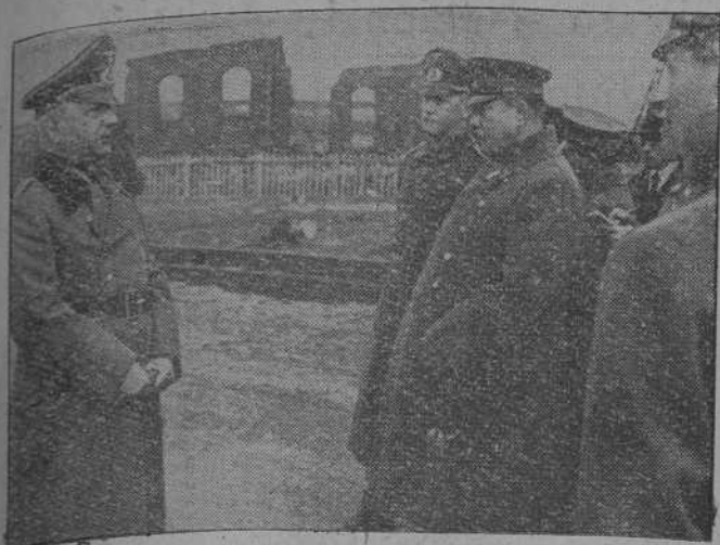
La misión militar japonesa, que actualmente se encuentra en Alemania, visitó también algunos de los antiguos frentes en el Oeste