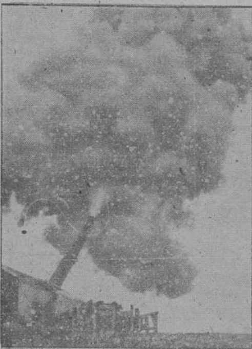
Un cañón de largo alcance de la Marina de Guerra alemana bombardea los objetivos militares de Dover y alrededores

Berlín, 17.—Comunicado del Alto Mando de las fuerzas armadas alemanas: