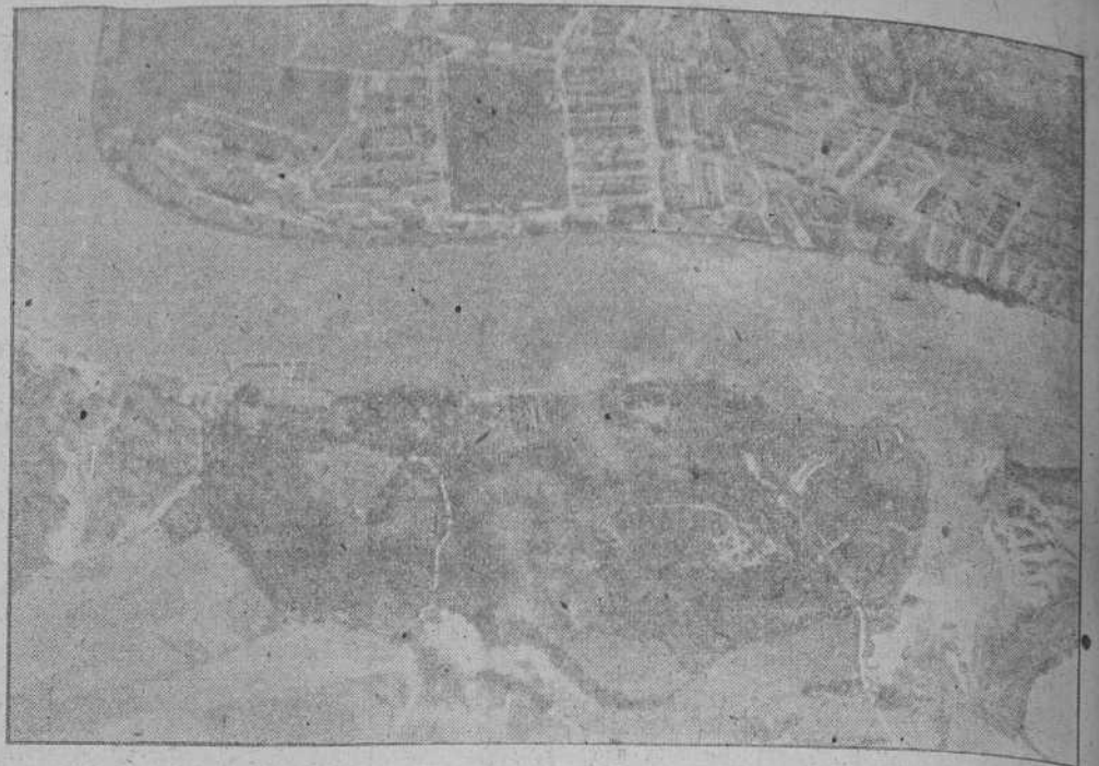
VISTA AEREA DE LAS INSTALACIONES INDUSTRIALES DE TILBURY, EN LA DESAMBOCADURA DEL TAMESIS QUE FUERON DESTRUIDAS EN GRAN PARTE POR LOS INTENSOS BOMBARDEOS ALEMANES

La desaparición de las lluvias nos ha permitido reanudar en considerable escala las operaciones de patrullas ofensivas en la frontera del Sudán. La situación sigue invariable”.—EFE.