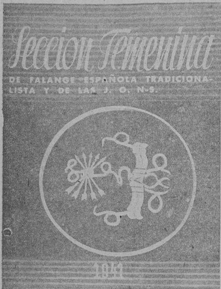
Portada del Calendario, editado por la Sección Femenina de Falange Española Tradicionalista y de las J. O. N. S., que en breve a parecerá.