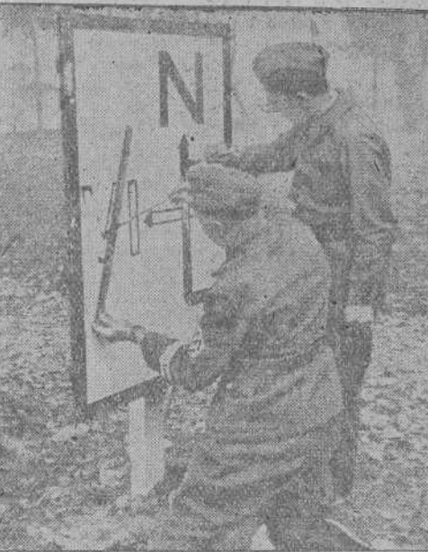
La reorganización de la Francia ocupada requiere trabajos tan detallados como la colocación de estos rótulos de orientación en las carreteras.