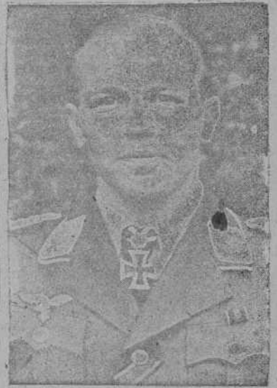
Ultima fotografia del comandante laureado Vick, que no volvió a su base del vuelo en que derribó el 56 aparato enemigo.