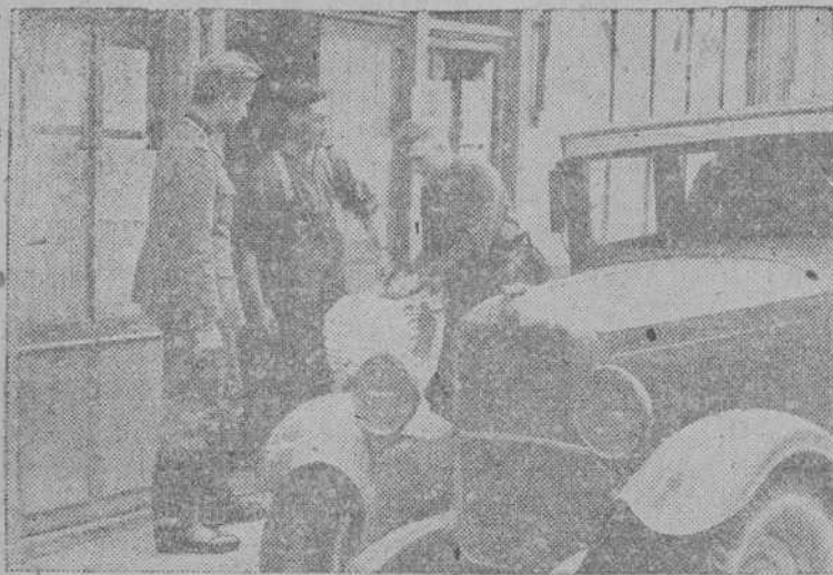
El periódico de campaña sale de la imprenta y es llevado, en automóviles de las Compañías de Propaganda, hasta los puestos más lejanos.