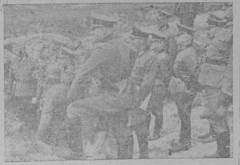
Altos jefes del Ejército alemán inspeccionan los trabajos de fortificación que se están realizando en la costa francesa del Atlántico.

Madrid, 4.—El embajador de Francia ha patentizado en el Ministerio de Asuntos Exteriores el pésame del Gobierno francés, y personalmente el del Mariscal Petain, por la catástrofe ferroviaria de ayer. Del mismo modo y por el elevado número de oficiales y soldados que figuran entre las víctimas, el agregado militar francés estuvo en el Ministerio del Ejército para testimoniar la condolencia del Ministro de la Guerra de Francia.—(Cifra).