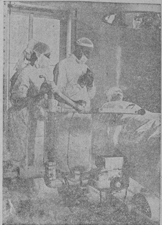
Una nueva invención alemana permite realizar operaciones a la luz de la lámpara con control simultáneo en la pantalla radioscópica, abriendo perspectivas insospechadas para gran parte de la Cirugía práctica.

Nueva York, 27.—El diario "New York Sun" publica información enviada desde Londres por la Associated Press bajo el título de "Inglaterra reclama el socorro de América las horas más desesperadas después de la derrota de Francia". Se dice en dicha información que la situación de Inglaterra es muy grave, ya que a consecuencia de los bombardeos aéreos y la actividad submarina alemana, la industria británica ve reducida sus actividades en momentos críticos. Se le lleva a pensar que sus esperanzas en Estados Unidos son falsas. La propaganda falsa, las noticias inverosímiles y la duda que se teje la verdad, durante las horas más peligrosas de la causa británica, como los bombardeos aéreos y los submarinos. Contra esta situación se levanta un movimiento de protesta, e Inglaterra dirige sus miradas a Norteamérica. Los barcos, los destructores nocturnos, los submarinos, los aviones, las bombas por aire, los torpedos, los tipos de bombas, las operaciones de la luz de la lámpara con control simultáneo en la pantalla radioscópica, abriendo perspectivas insospechadas para gran parte de la Cirugía práctica.