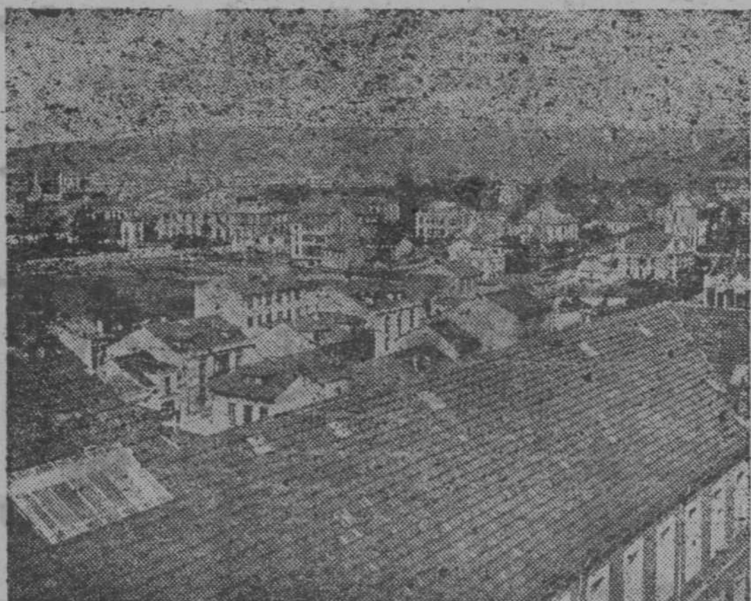
Vista de Gijón desde la iglesia del Sagrado Corazón.