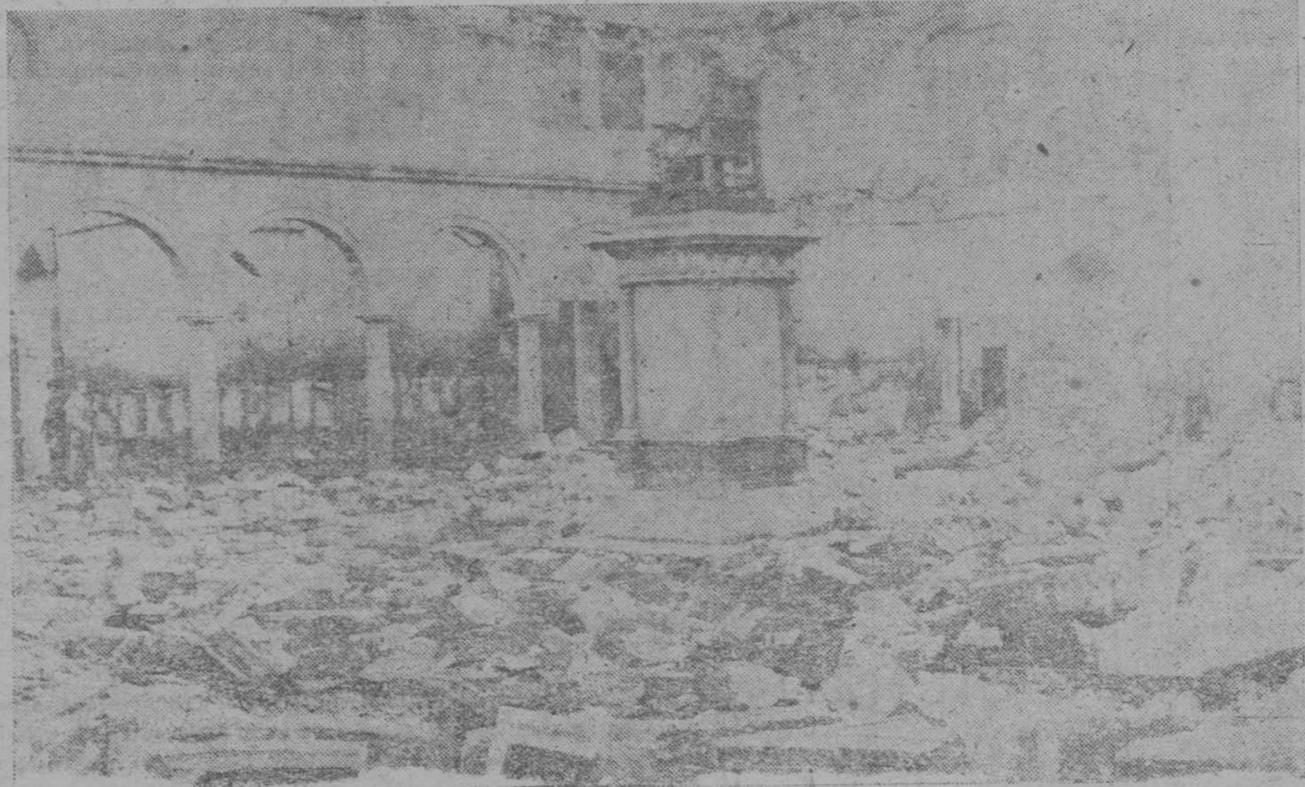
He aquí lo que queda del claustro de la Universidad de Oviedo. La horda, negadora de la civilización, asiática y torba, prendió en sus muros para la ciencia, en Octubre del 34 y convirtió en cenizas una de las mejores bibliotecas de España. Cuando empezaban a restaurarse sus piedras, las hordas renovadas y famélicas de destrucción, bombardearon los pocos muros que habían quedado en pie. ¡Y las democracias les llaman representantes de la ley, legítimos y amantes del derecho!...

Yo tenía entre las más frescas de mi bodega ánforas herméticas y globos. Corría por sus venas el humor de un añojo romano. La sombra y el subsuelo vido endulzaron sus rinos. Herida la tierra, que no to la luz, con el corte de meros barro rotos, tendi espuma sus canas a los ebrios y quietos.