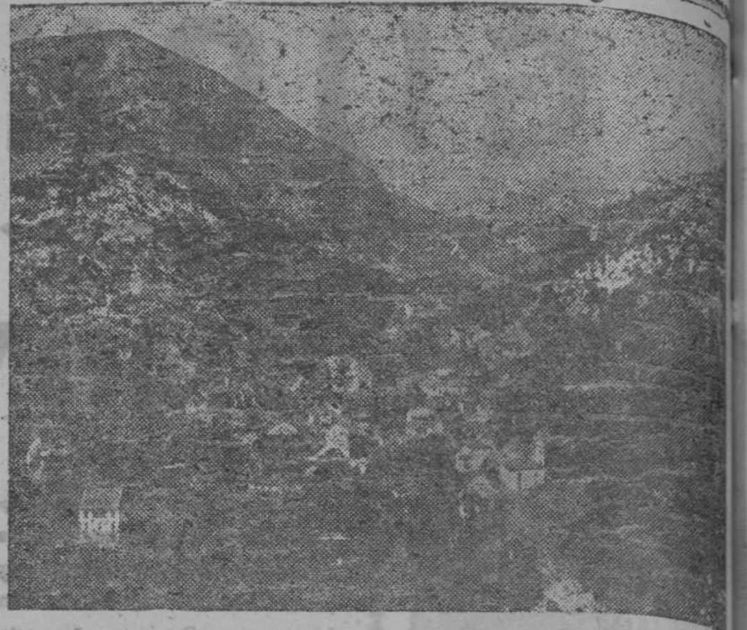
Vista general de Carreña. (Ruta de Guerra.)