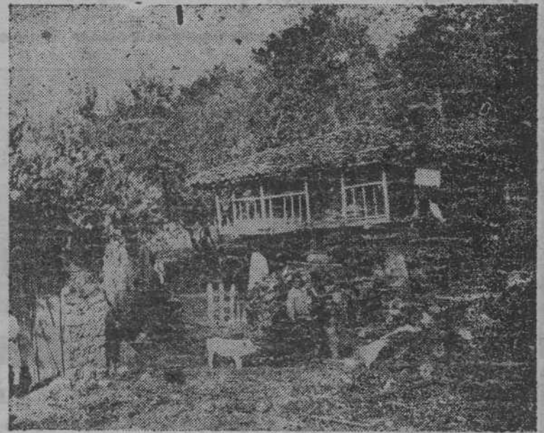
Deva (Gijón): Hórreo.

Y, al mismo tiempo, uno de los simpáticos leoneses que nos acompaña, com-