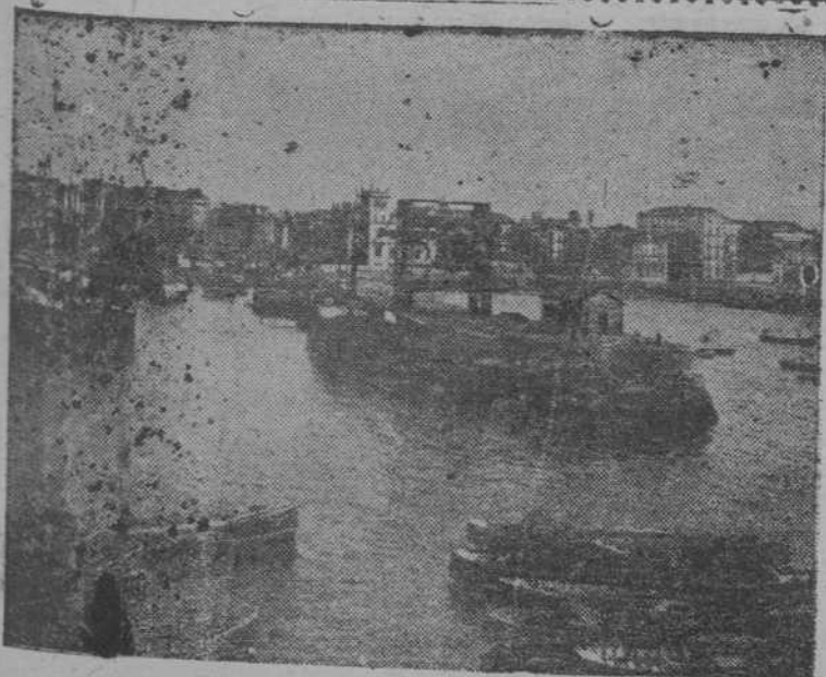
Muelle de Gijón. Cargadero del Ferrocarril de Langreo.

Talleres de Esmaltería, Fundición y Construcciones Mecánicas Fundada en 1854 BATERIA DE COCINA y ARTICULOS DE ACERO CON BAÑO DE PORCELANA Bañeras de hierro fundido y artículos sanitarios con baño de porcelana. - Modernos e importantes talleres de fundición y mecánicos. - Calefacción por agua y vapor a baja presión. - Radiadores. - Calderas. Calderas especiales de muy poco consumo y entretenimiento facilísimo para la calefacción por pisos TELÉFONO 188 APARTADO 9