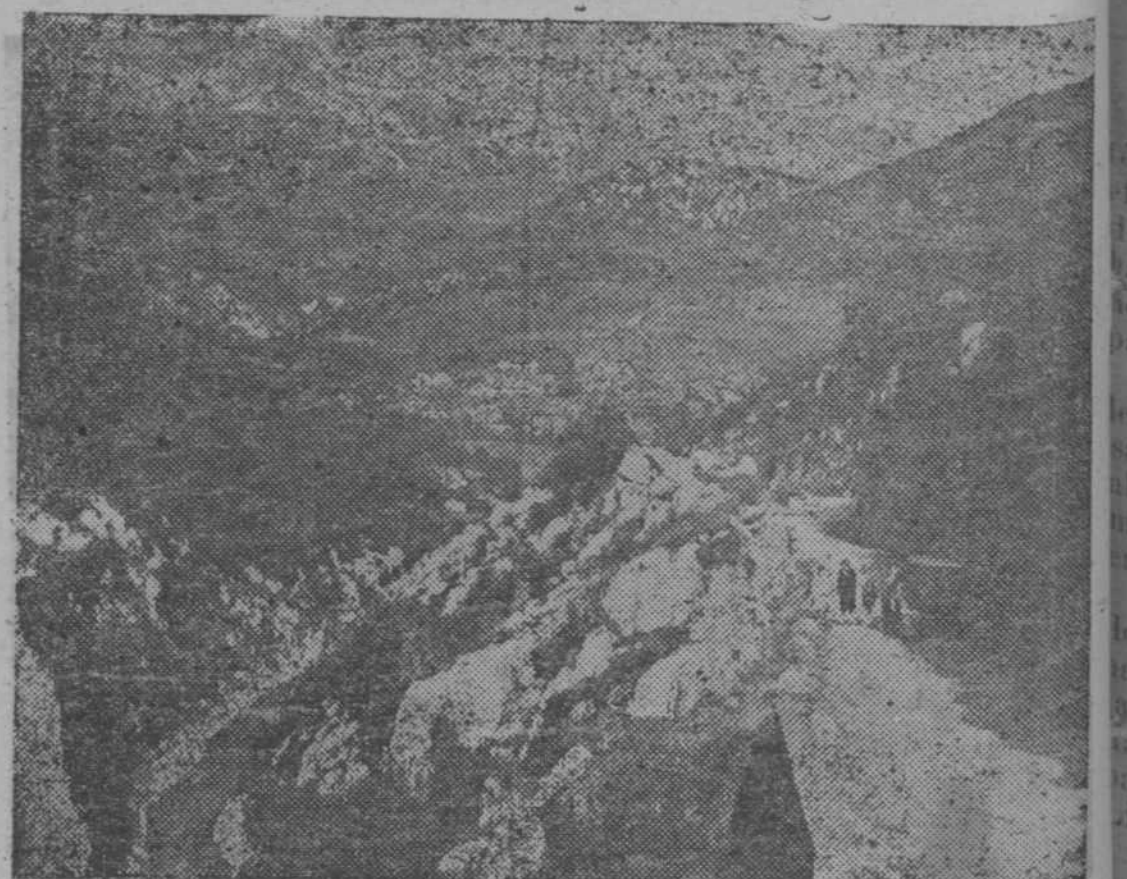
Arenas de Cabrales (Picos de Europa). (Ruta de Guerra.)