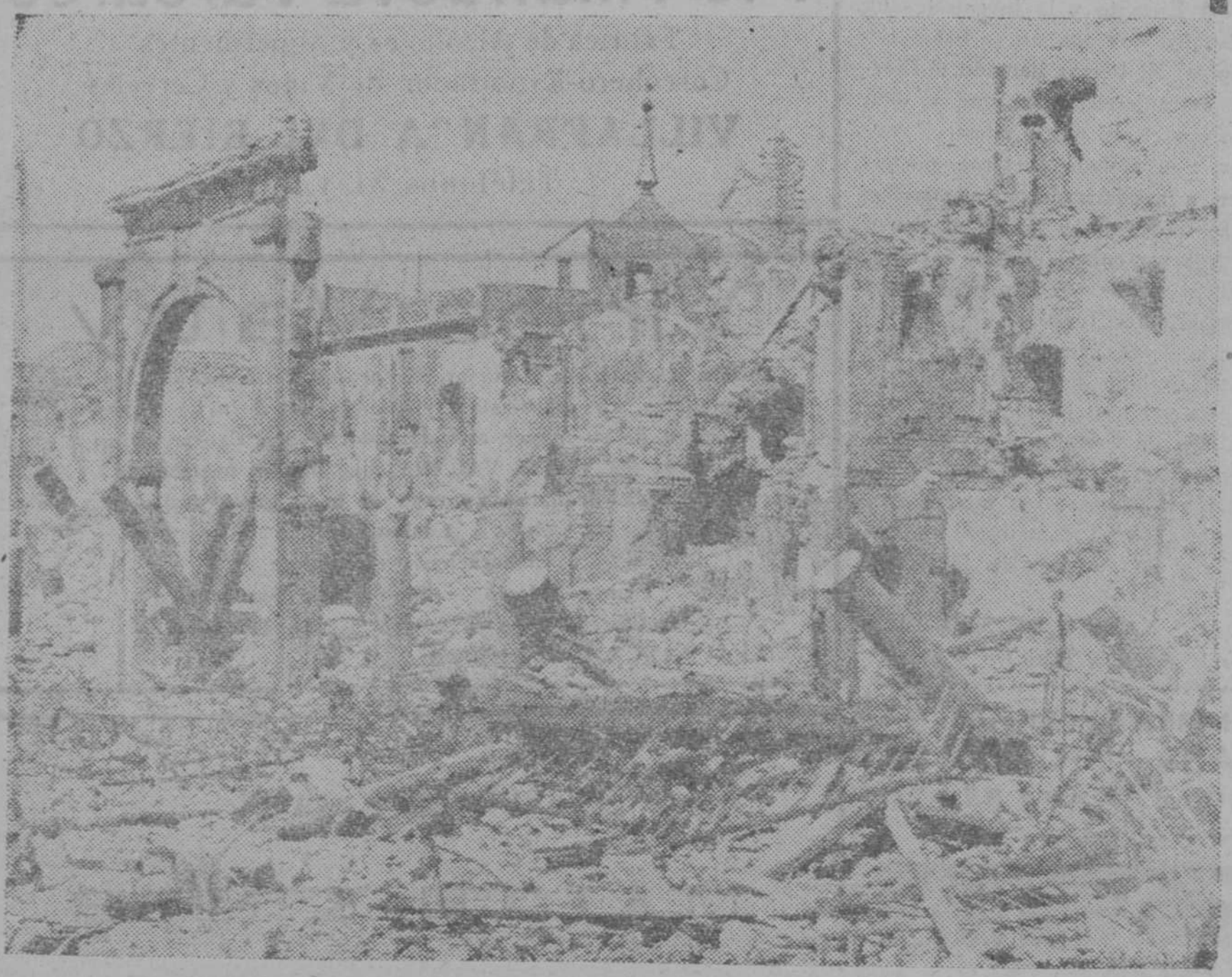
Por las huellas, se sabe el paso. He aquí Zocodover, la magnífica plaza, poesía, historia y arte de la imperial Toledo, después de la feroz acometida de la España rusa contra el invicto reducto de la lealtad hispana: el Alcázar de Toledo, una de cuyas torres contempla erguida y victoriosa las huellas de la bestia: ruina