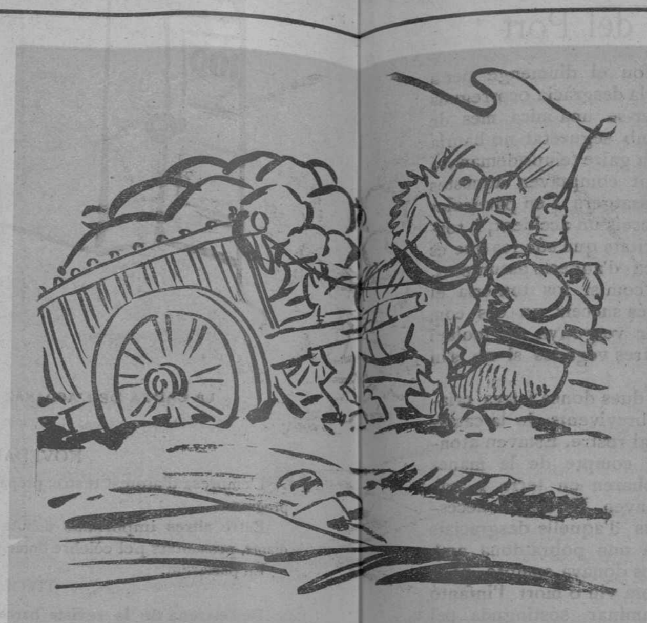
—Arri, arri tatànet!