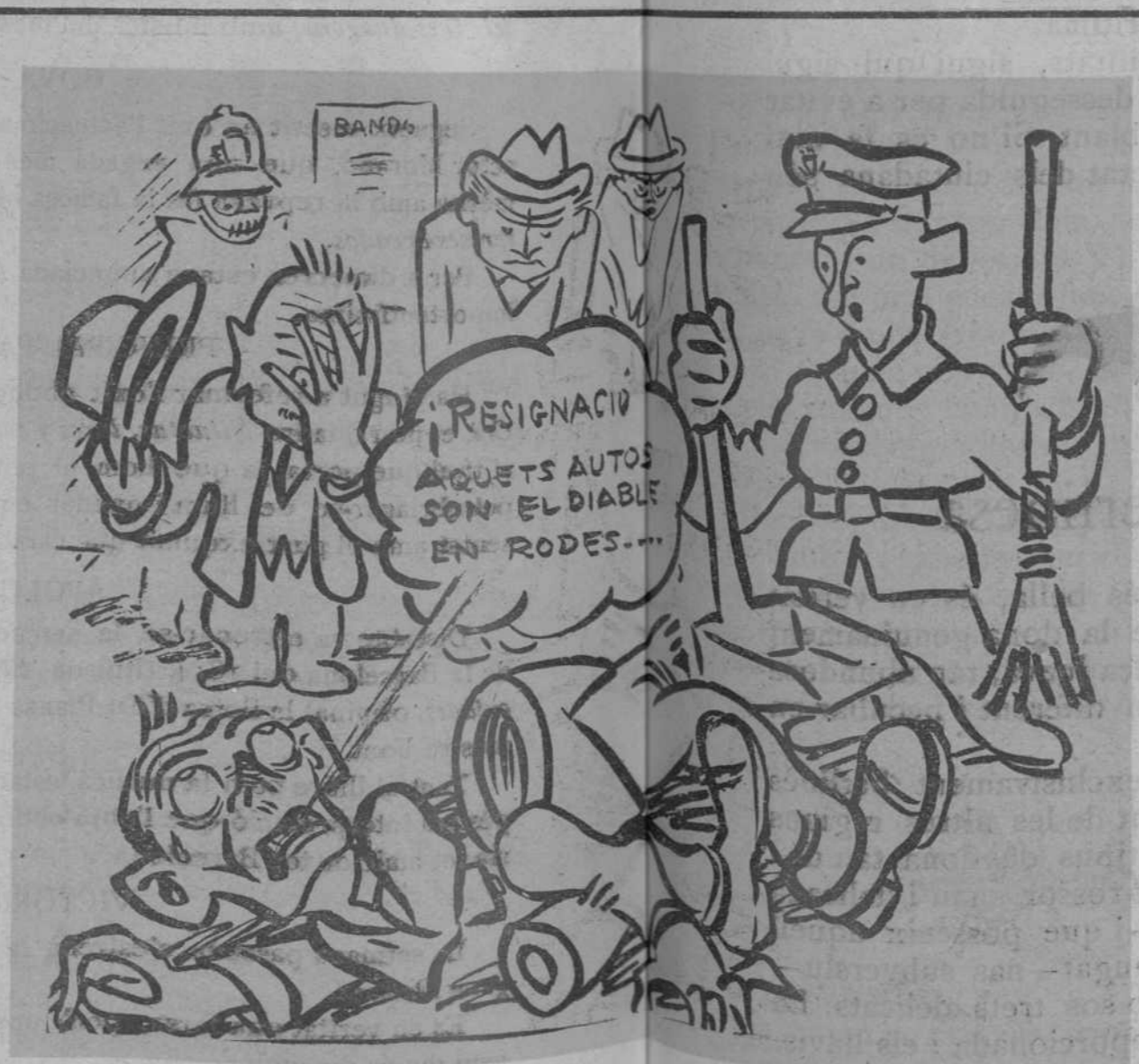
—Aquest si que no renegarà!