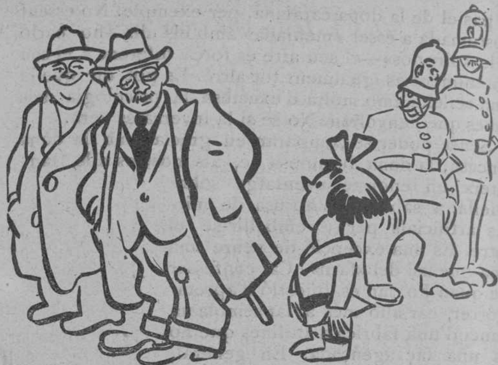
EL PAPU NOU

Avui, amic llegidor, serà el dia de les grans bofetades. A l'«Iris» els «asos» Valls i Sáez es disputaran el campionat espa-