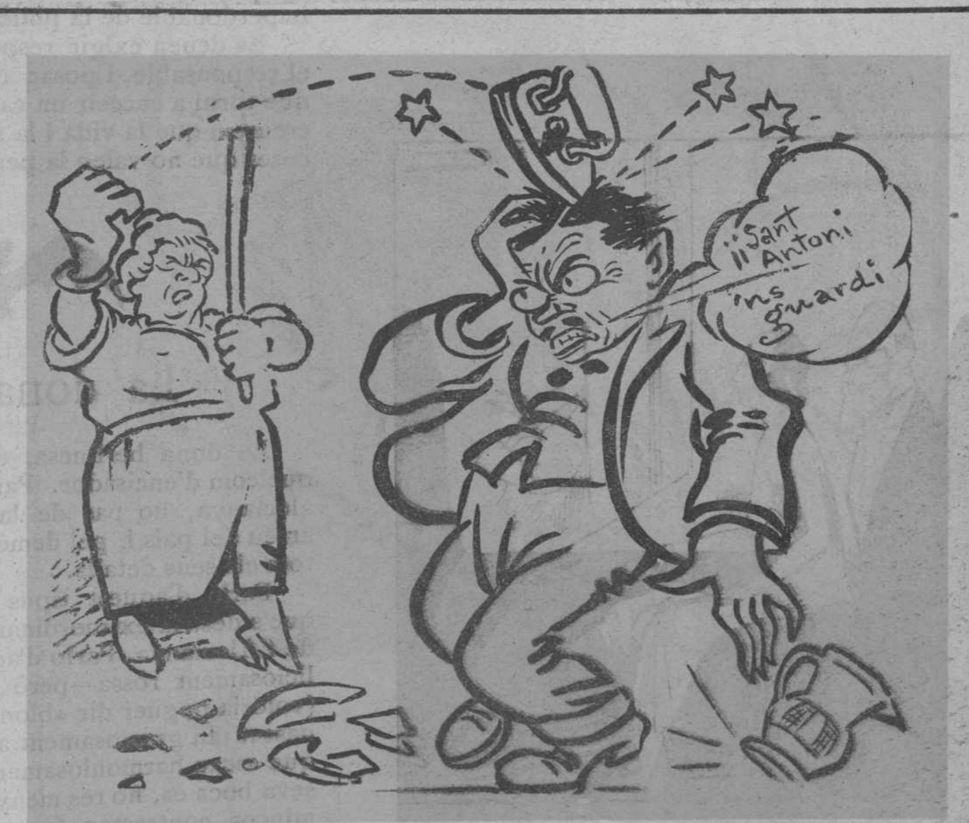
—Així m'agrades, que aguantis amb modos!