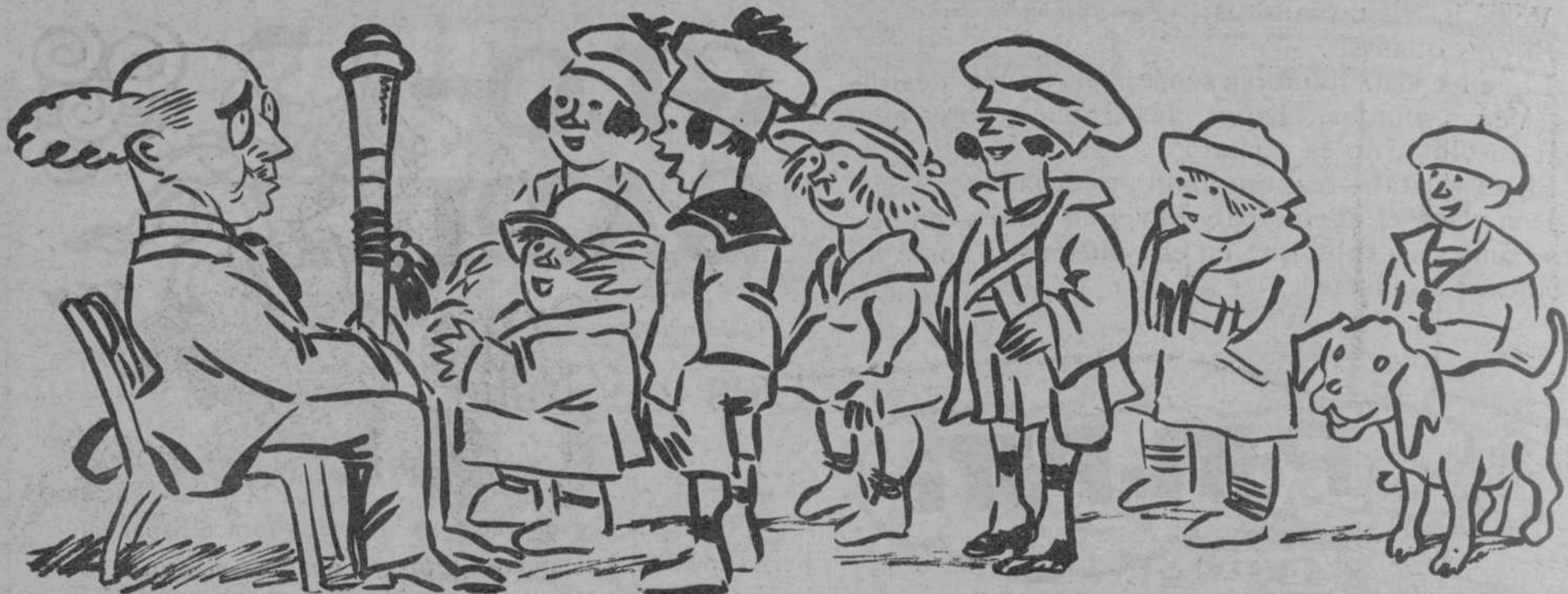
LA DEMANDA DELS PETITS

mort de molts anys, el tal autor s'ha donat per mort, i mort i tot encara viu a Itàlia, si bé ha d'ésser enterrat a Espanya.