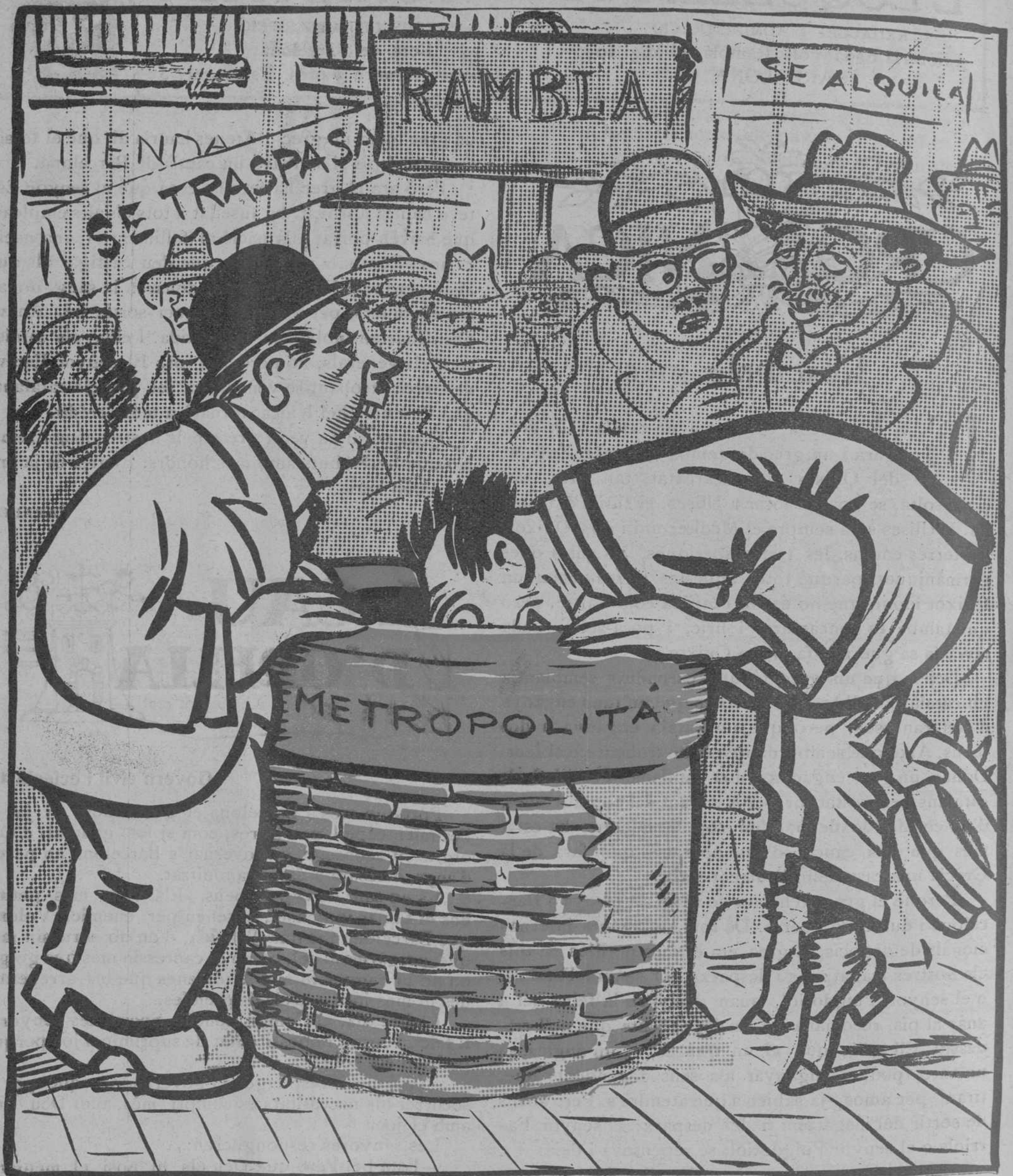
EL POU SIMBOLIC