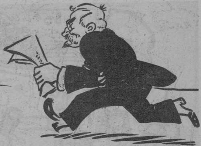
— Aquest paper em crema els dits!..

Aquest bonic i favoregut teatre de la Rambla, anunciava per