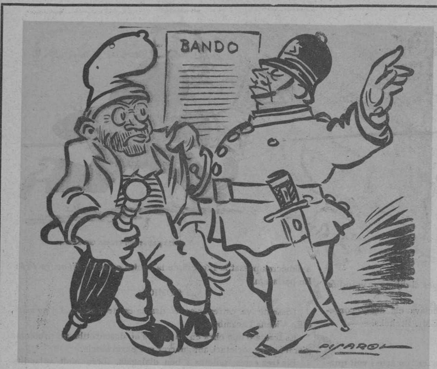
—Vatua el ret de la Sila! —A la càrcel!