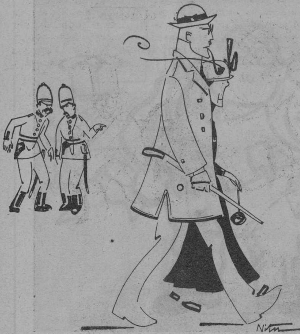
LES ORDRES GOVERNATIVES

—¡Ail right! Trade mark in Hong-Kong. —Noi, anem-los a agafar que'm sembla que reneguen!