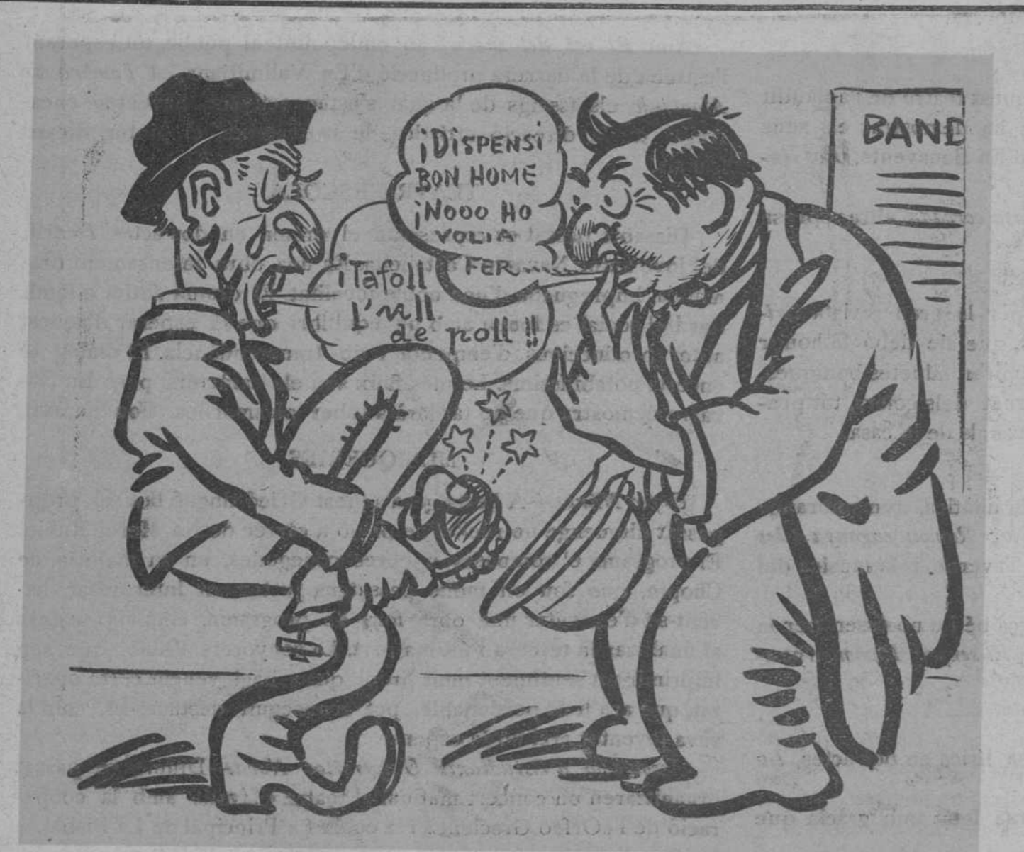
—Estic per donar-li les gràcies.