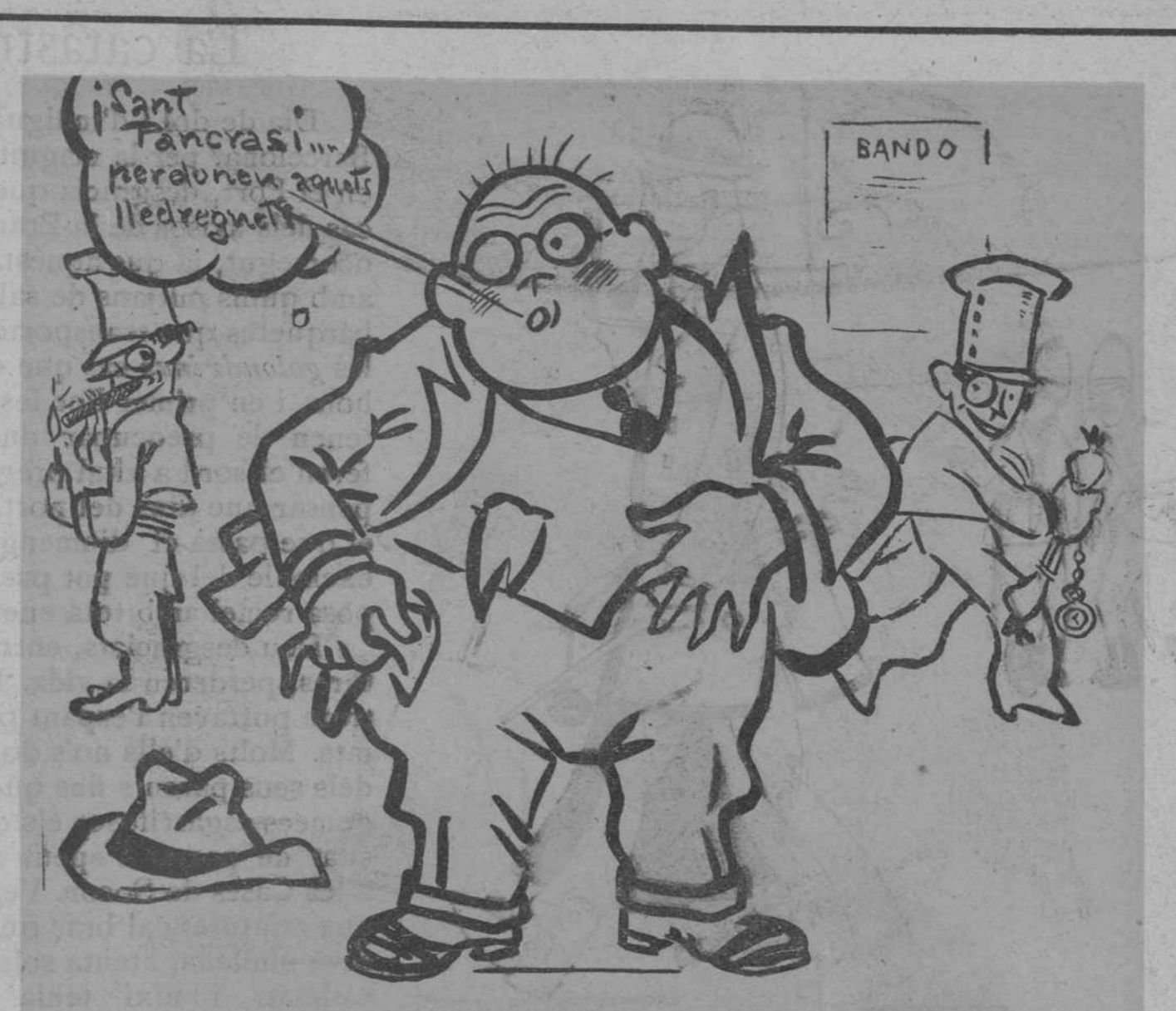
Qui no s'aconsola és perquè no vol.