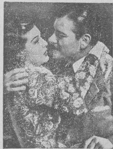
Ronald Colman and Loretta Young in «Bulldog Drummond Strikes Back»

Me gustó España con delirio—nunca había estado allí antes—, y después de una corta temporada en Madrid, recorrí en automóvil todo el Levante español. Hasta visité Pamplona durante