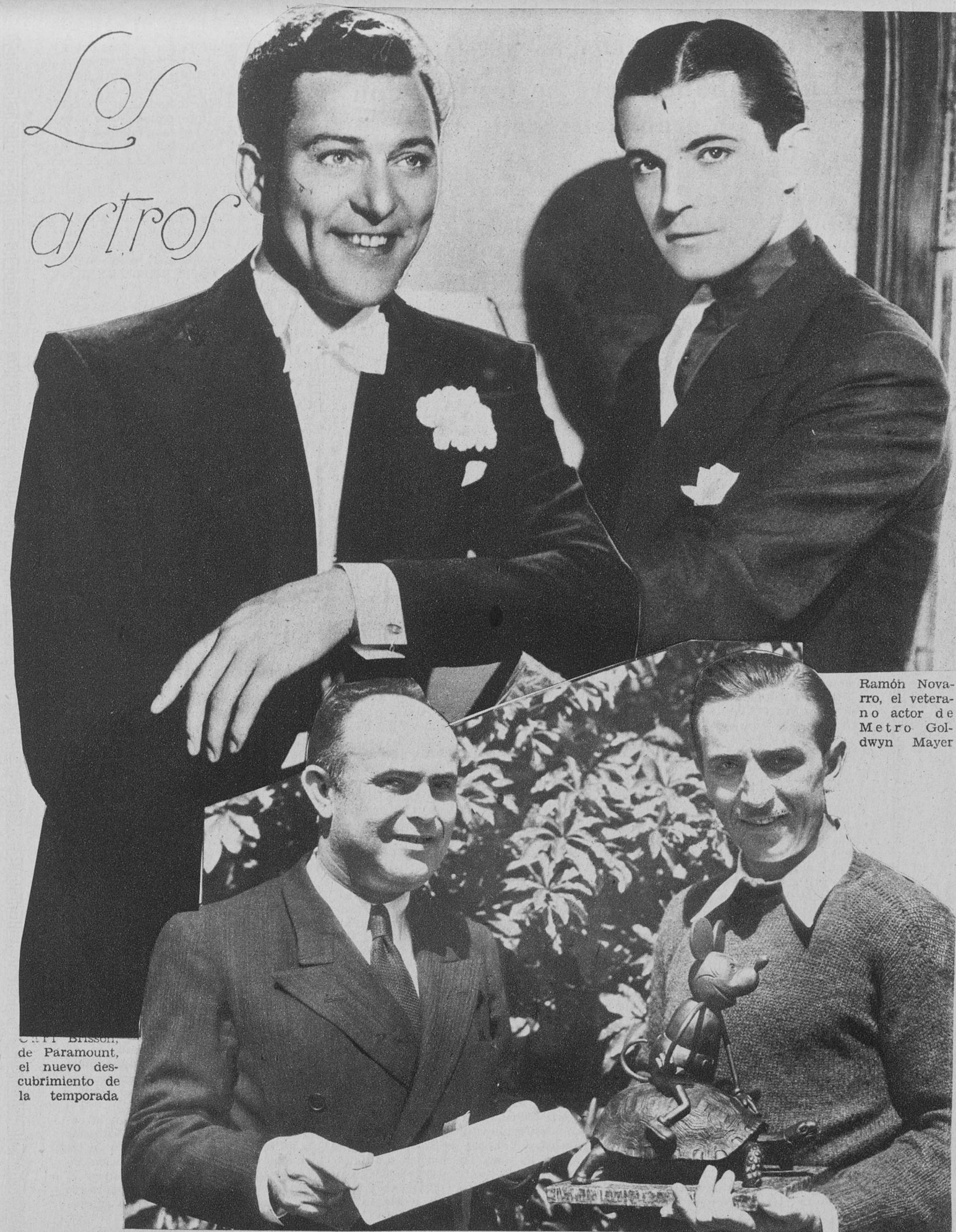
Carl Brisson, de Paramount, el nuevo descubrimiento de la temporada