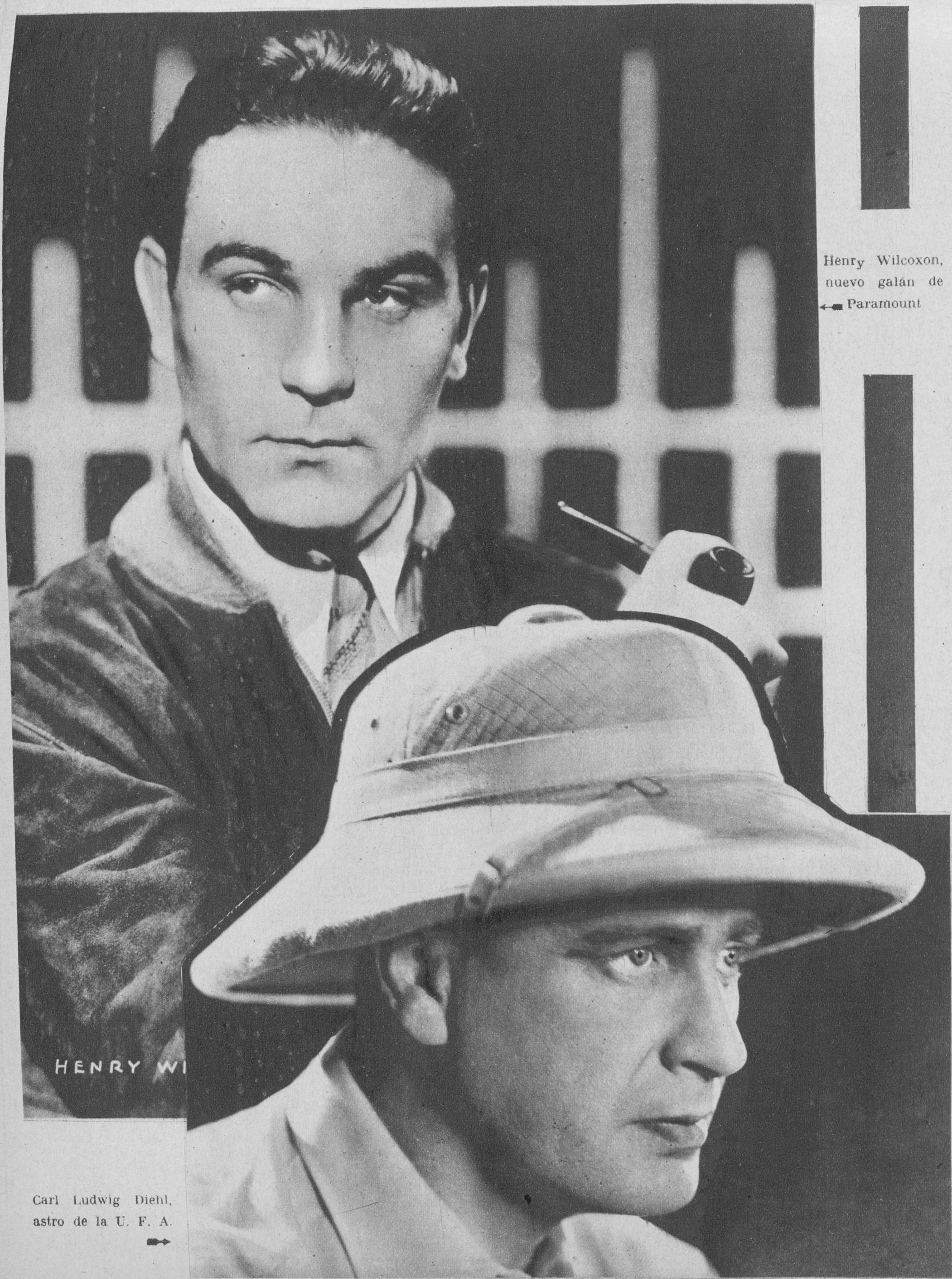
Henry Wilcoxon, nuevo galán de ← Paramount