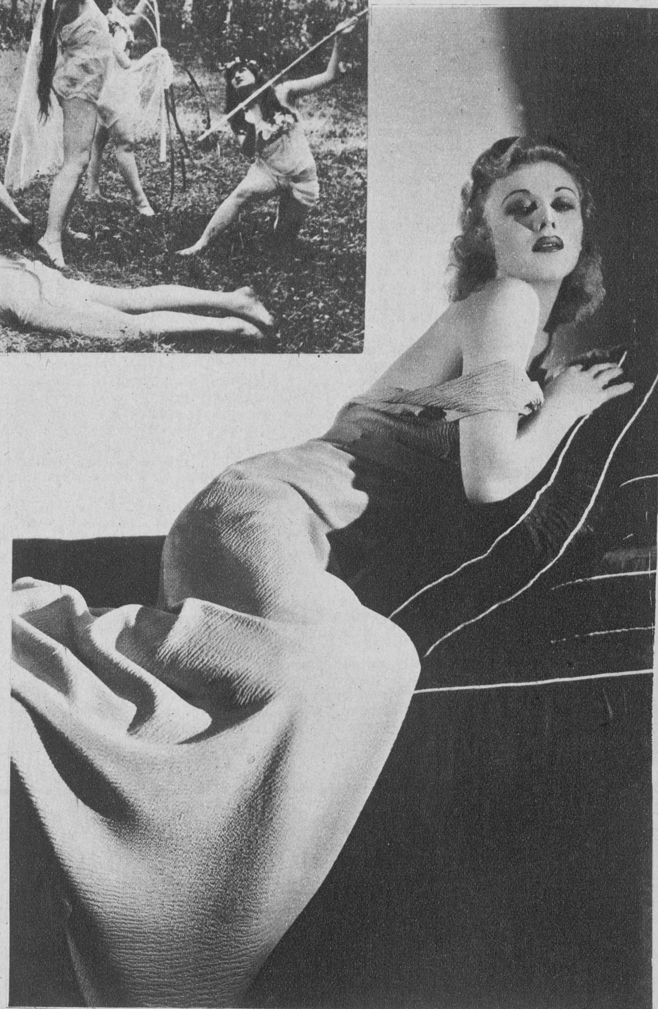
El del año 1934; Grace Bradley, de Paramount, y Ginger Rogers, de Radio Films. ¿Cual sex-appeal agrada más al lector?