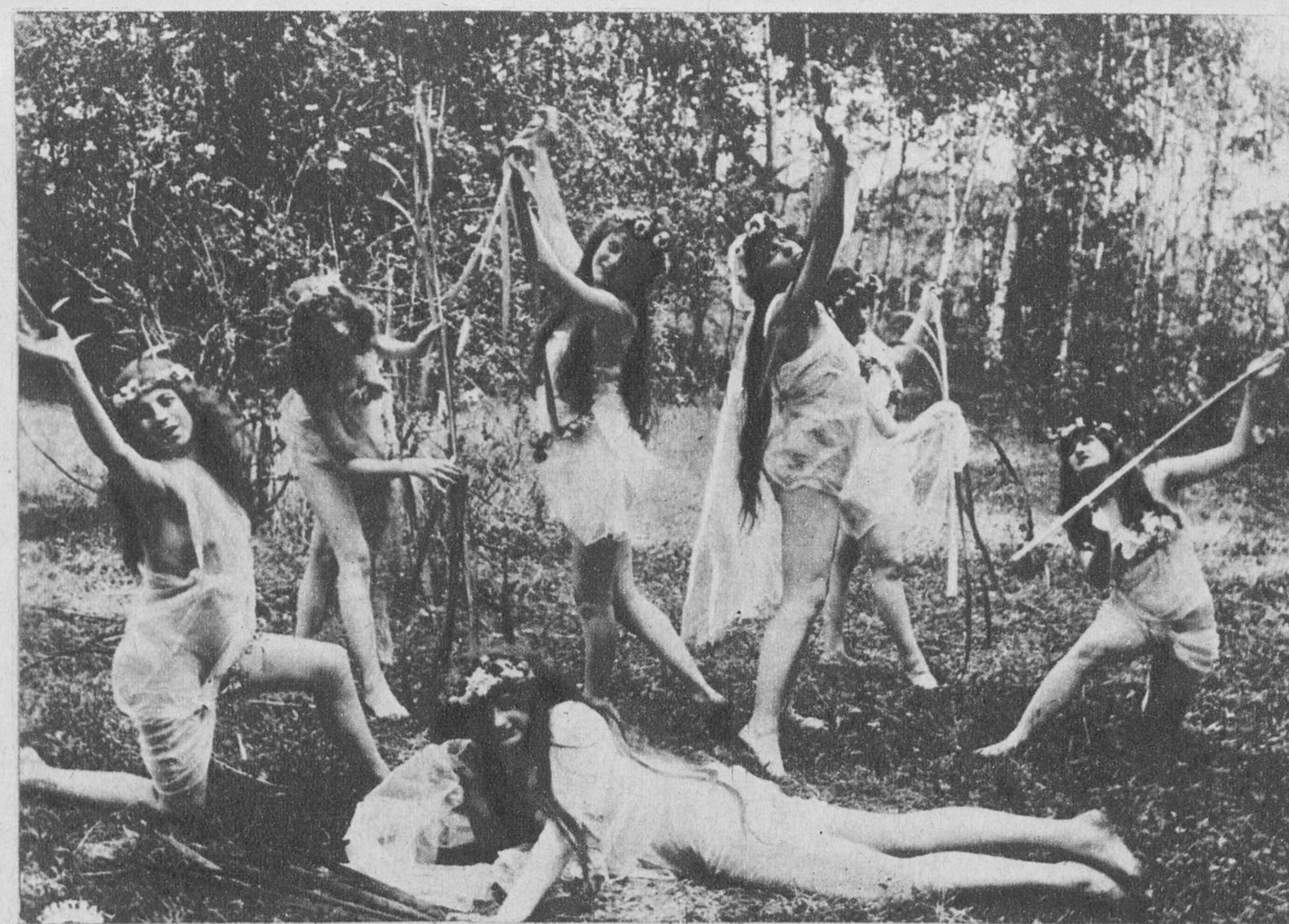
Contrastes de sex-appeal. — El del año 1910, intervenido por la censura francesa