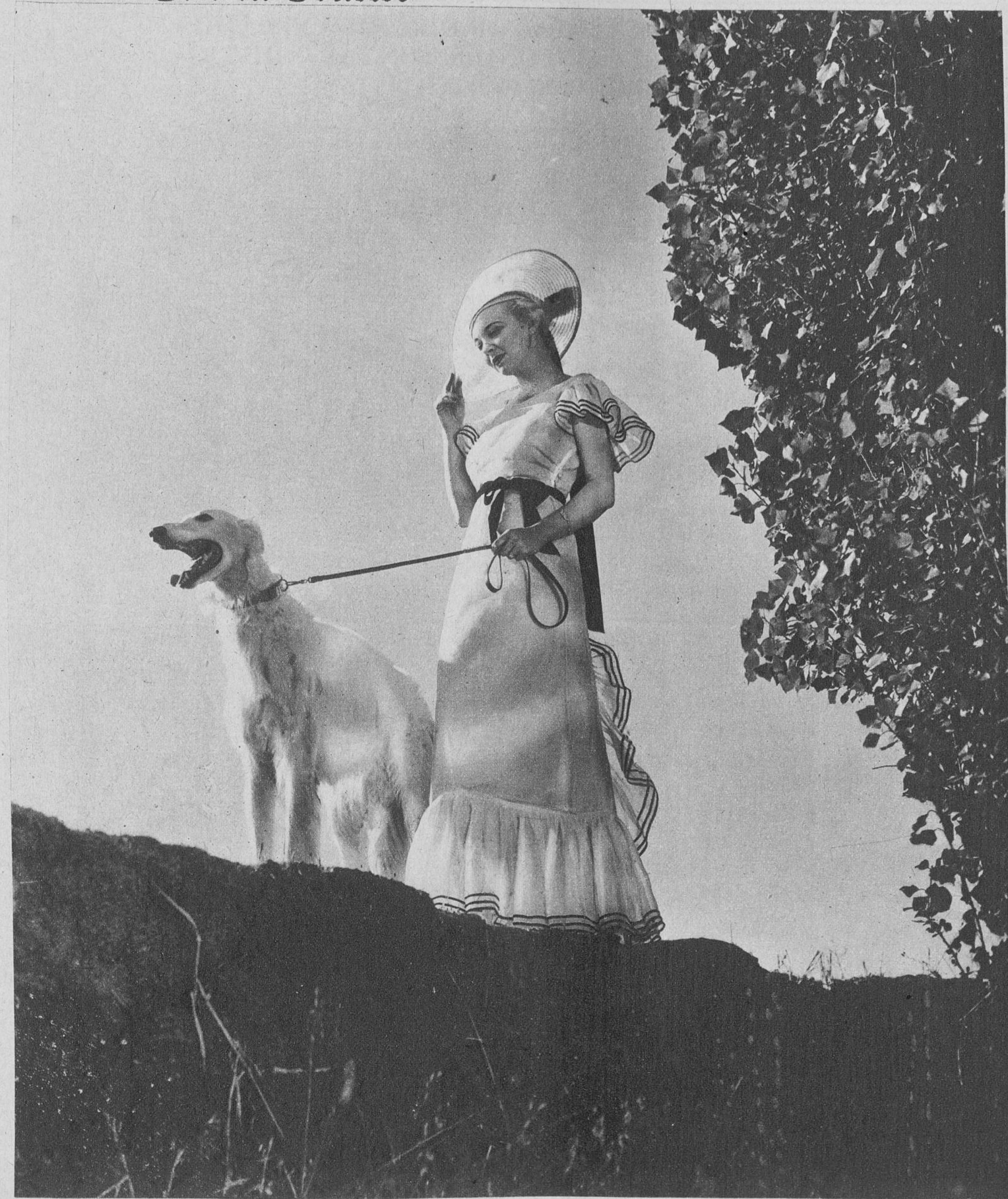
Virginia Bruce, estrella M. G. M., luce su estilizada figura en plena campiña californiana