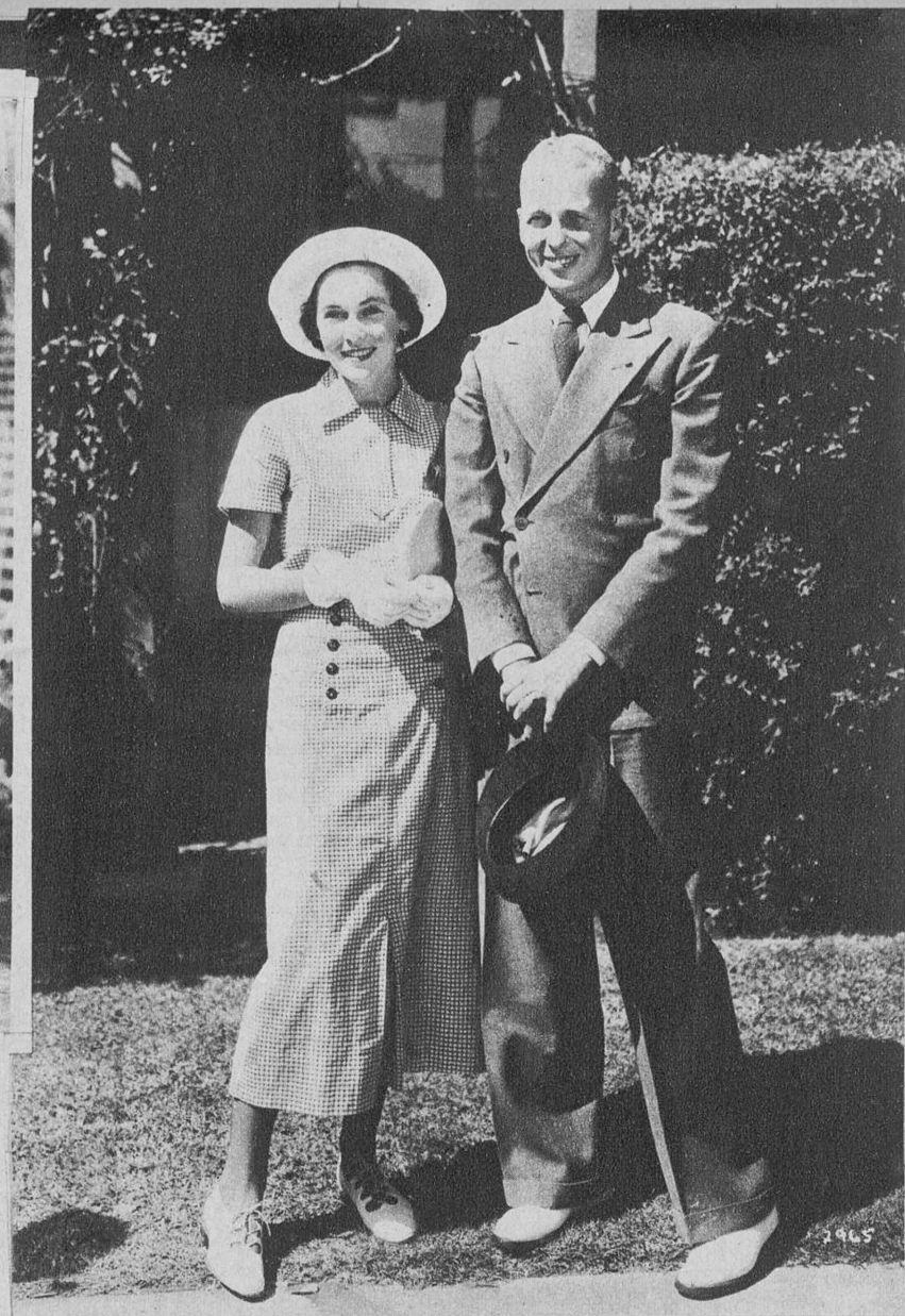
Maureen O'Sullivan, estrella M. G. M., y John Farrow, escritor americano, que se casarán próximamente, para un plazo que ellos aseguran será muy largo