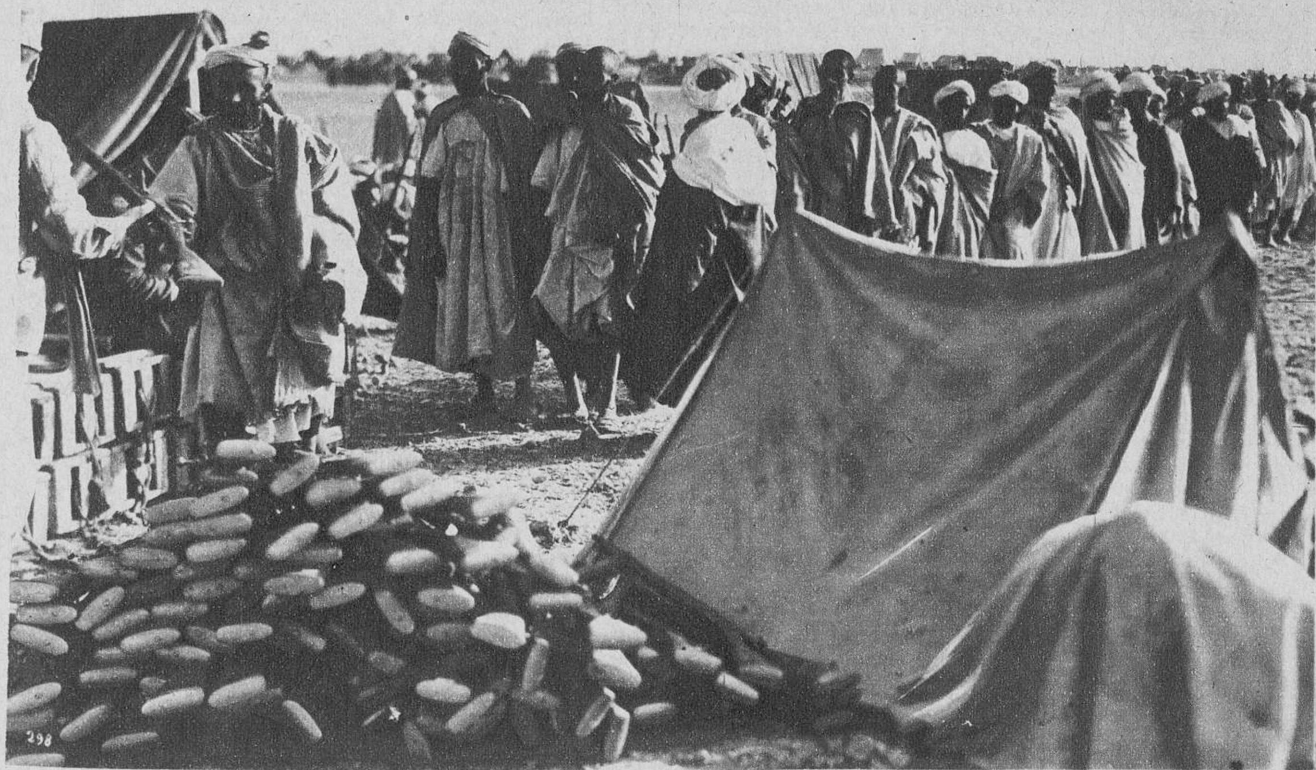
Una escena de la película Eden Productions «Itto»