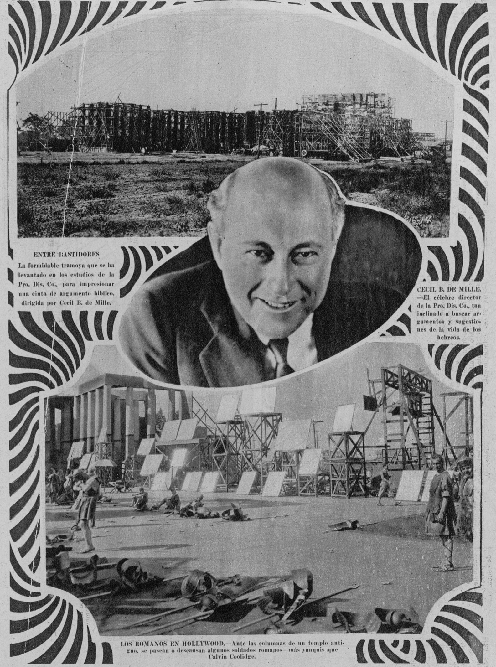
ENTRE TASTADORES La formidable tramoya que se ha levantado en los estudios de la Pro. Dis. Co., para impresionar una cinta de argumento bíblico, dirigida por Cecil B. de Mille.