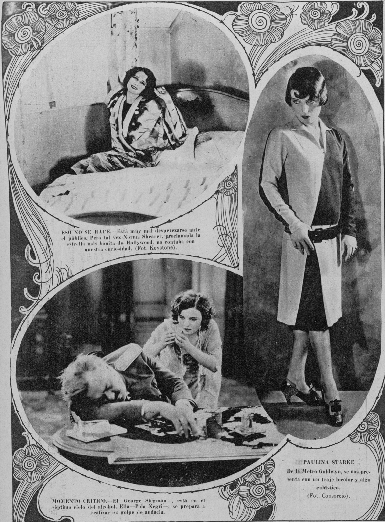
ESO NO SE HACE. —Está muy mal despreciarse ante el público. Pero tal vez Norma Shearer, proclamada la estrella más bonita de Hollywood, no contaba con nuestra curiosidad. (Fot. Keystone).