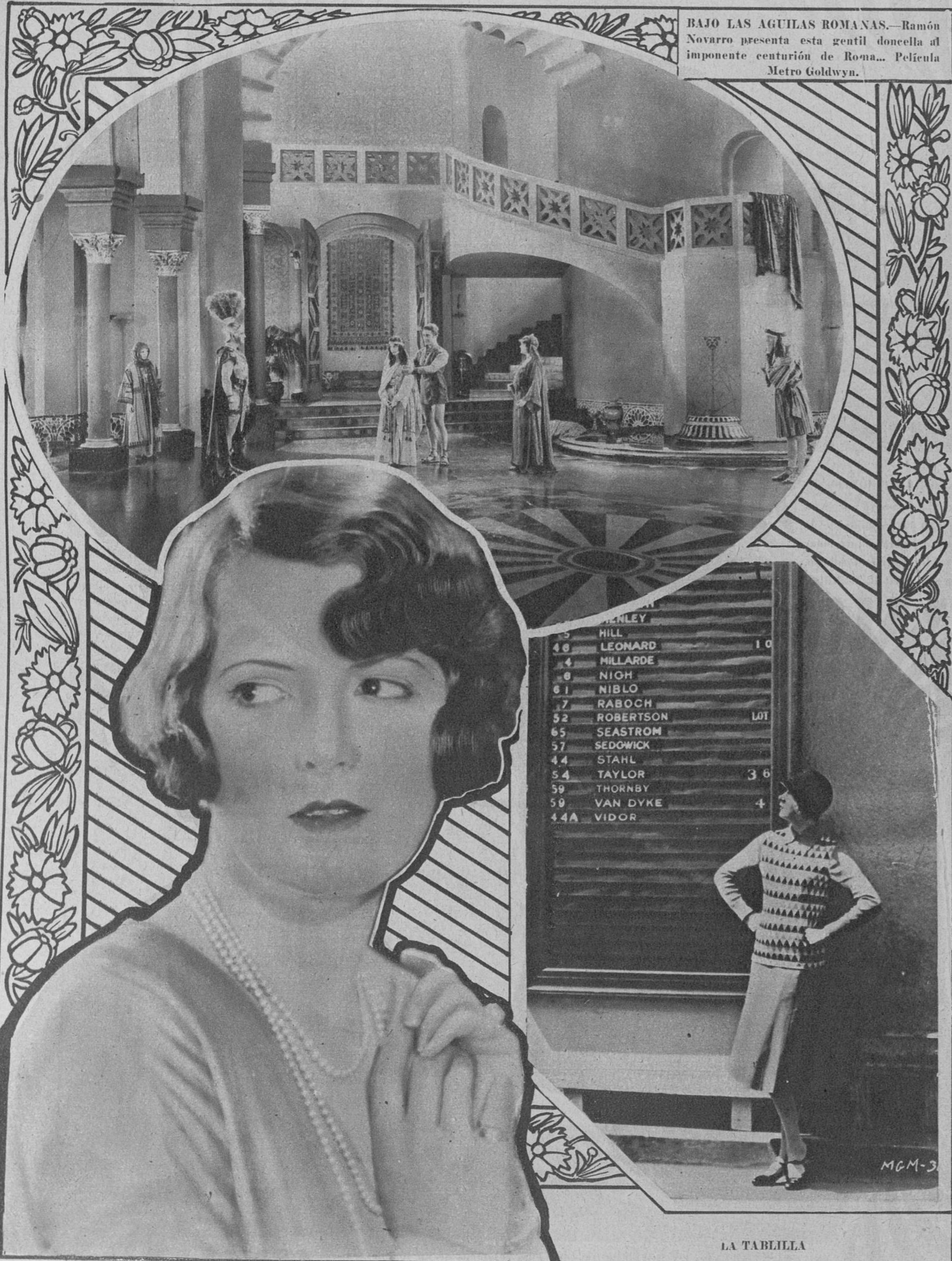
BAJO LAS AGUILAS ROMANAS.—Ramón Novarro presenta esta gentil doncella al imponente centurión de Roma... Película Metro Goldwyn.