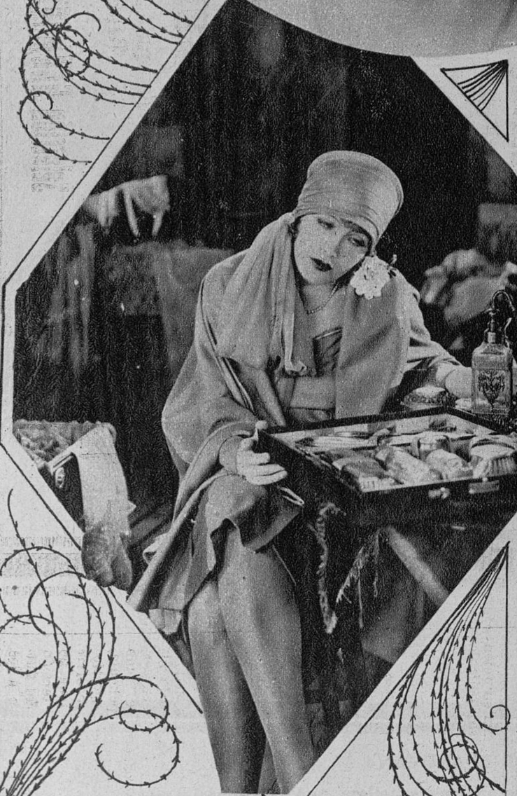
MELANCOLIA. —Greta Garbo está triste. ¿Qué tendrá Greta Garbo? El espléndido «necessary» que tiene ante sus ojos no parece un motivo fatal de tristeza. Pero, en la película, no lo dudemos, todo se explicará satisfactoriamente.