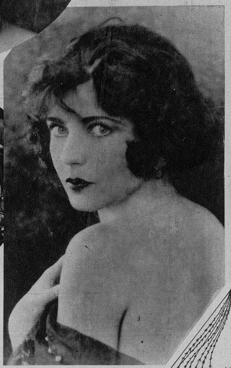
RENEE ADORE. —La ex cenÿere, convertida en gran actriz de la Metro Goldwyn, nos mira con ojos casi espantados. No está, por eso, menos interesante.