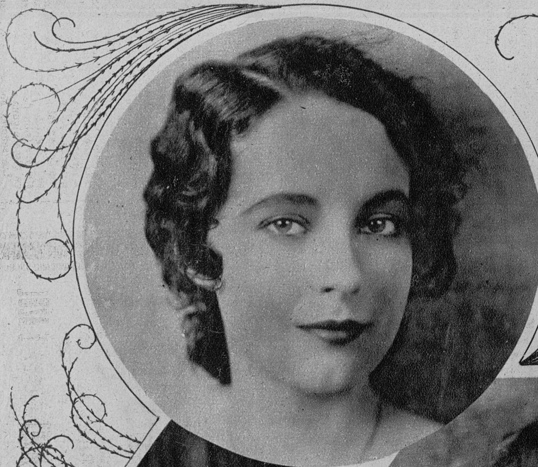
BETTY BRONSON De la Paramount. Era una niña cuando apareció por primera vez en la pantalla. Ya es una mujer. Y no ha dejado nunca de ser una artista.