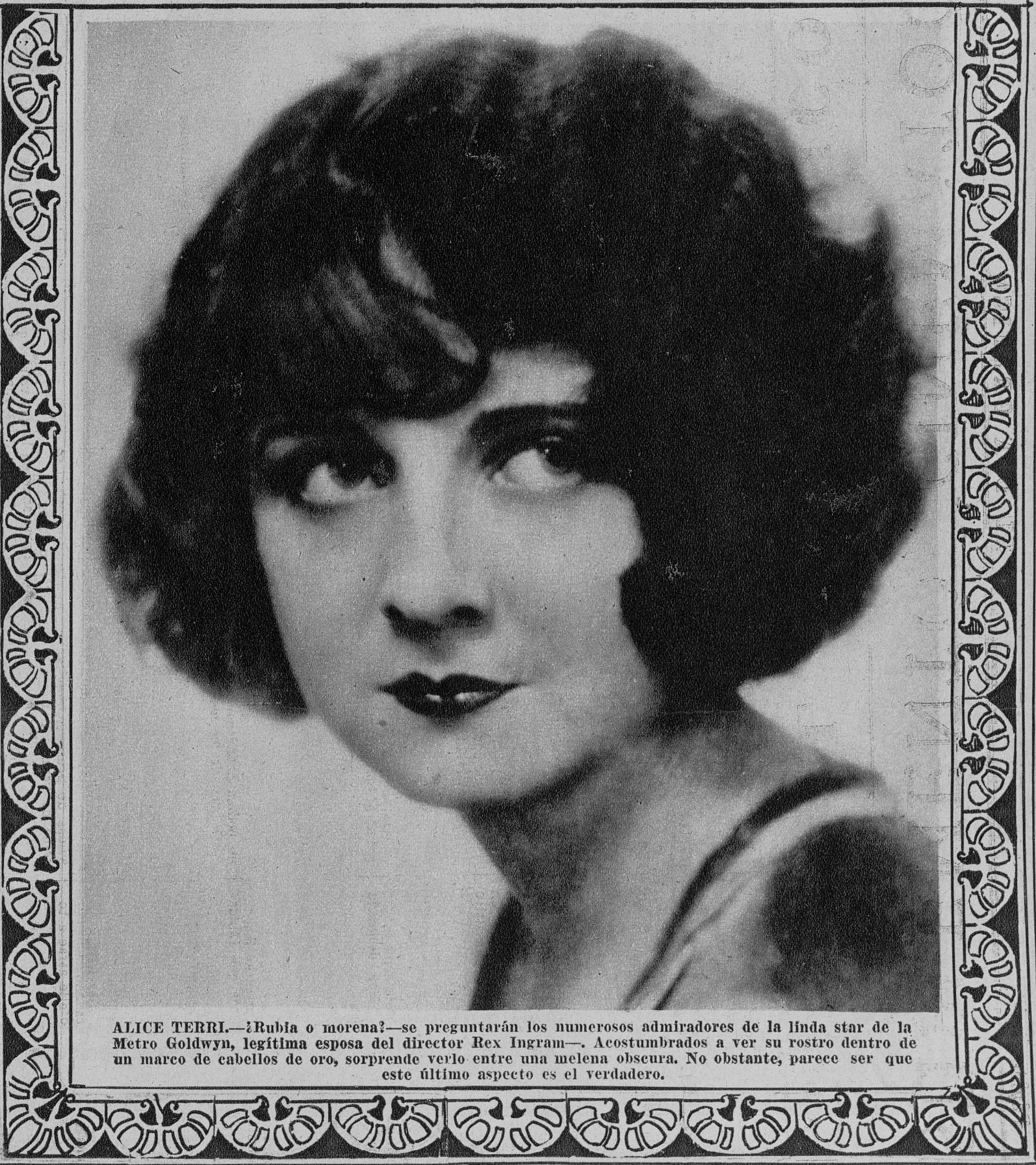
ALICE TERRI. —¿Rubia o morena?—se preguntarán los numerosos admiradores de la linda star de la Metro Goldwyn, legítima esposa del director Rex Ingram—. Acostumbrados a ver su rostro dentro de un marco de cabellos de oro, sorprende verlo entre una melena oscura. No obstante, parece ser que este último aspecto es el verdadero.