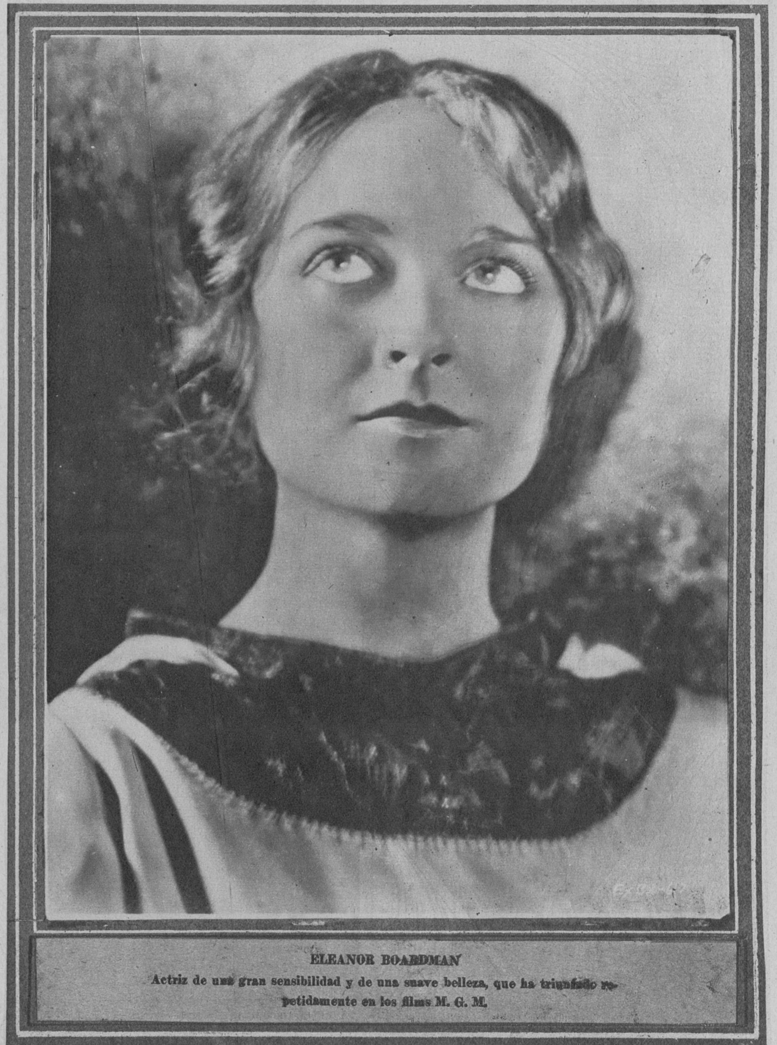
ELEANOR BOARDMAN Actriz de una gran sensibilidad y de una suave belleza, que ha triunfado repetidamente en los films M. G. M.