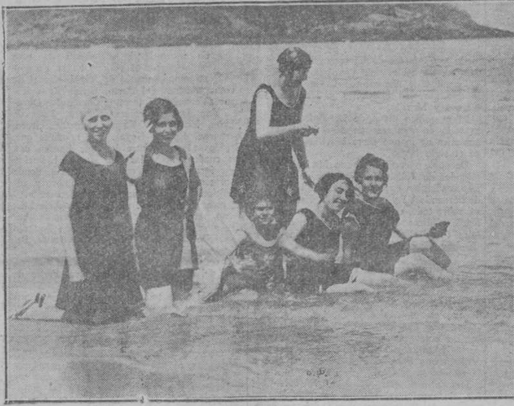
SAN SEBASTIAN.—Un montoncito de bellezas dispuestas ante el objetivo del fotógrafo.