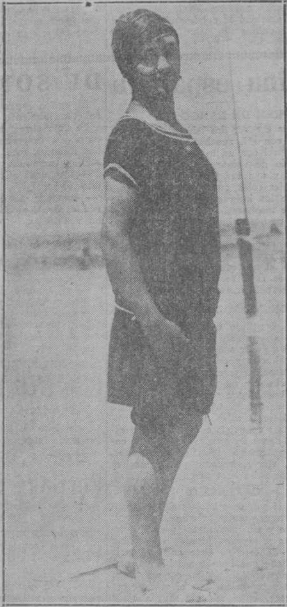
SAN SEBASTIAN.—¿Qué pasa? Me voy a bañar sí, señores, y de puro bonita hasta la marca "baja". ¿Qué pasa?