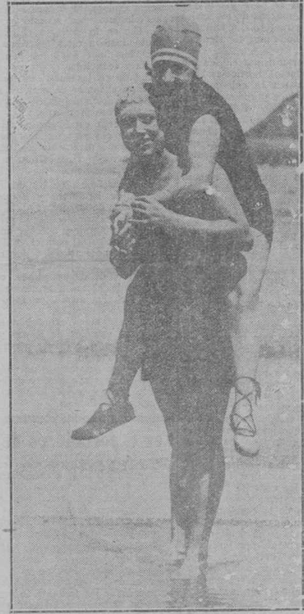
SAN SEBASTIAN.—¿Hay quien quiera un rejón? He aquí un grupo que está para esculpirlo.