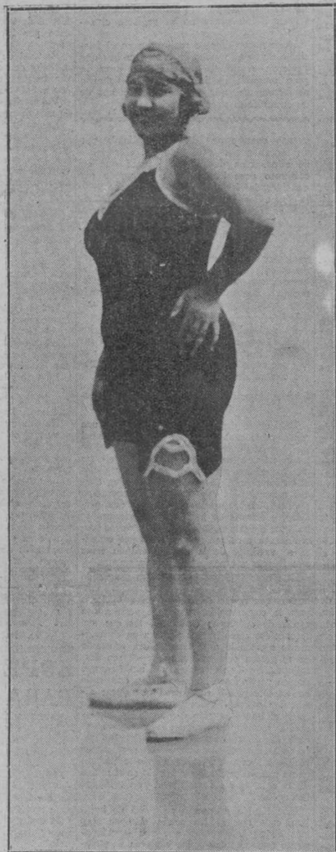
SAN SEBASTIAN.—En la playa de San Sebastián se ven muchas y muy bellas mujeres; una de ellas, y por cierto de las más guapas, ha sido sorprendida por el fotógrafo en el momento de entrar en el baño.