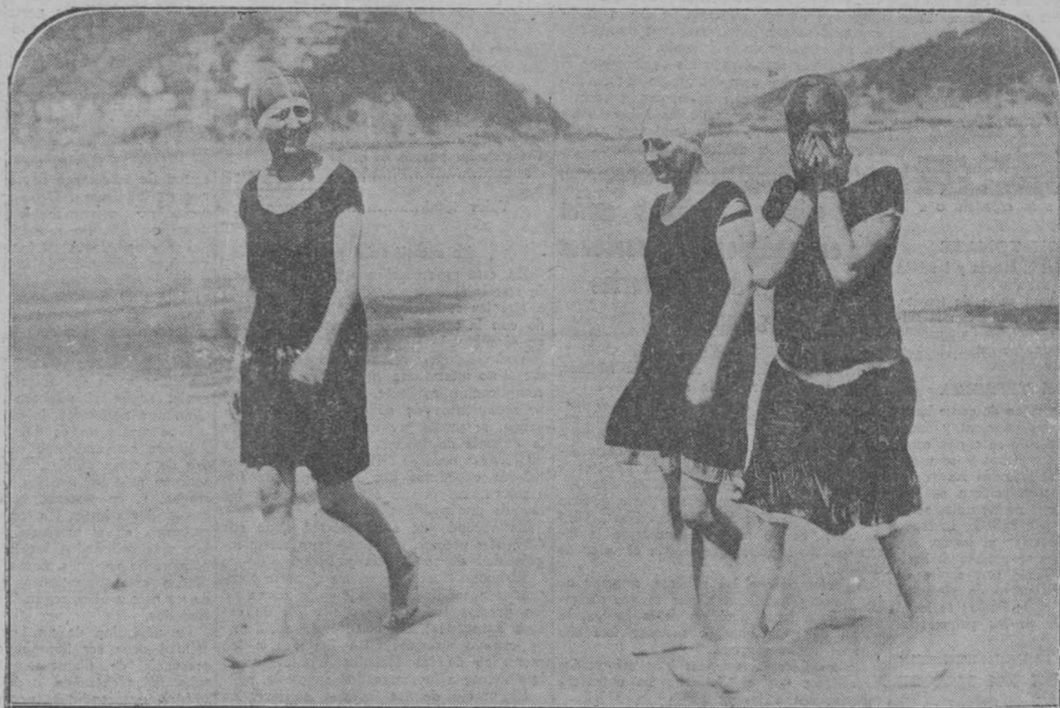
Un grupo de bañistas en la playa de San Sebastián.