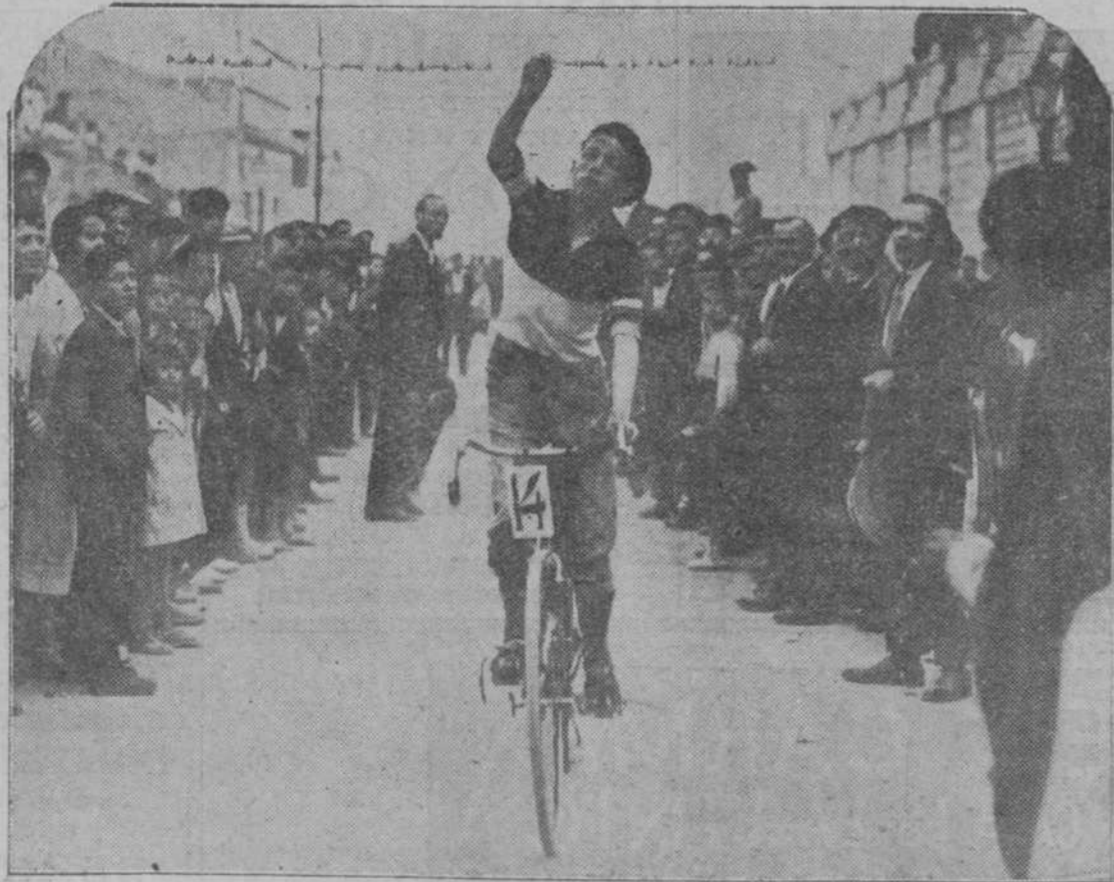
Carreras de cintas en bicicleta, celebradas en la barriada de Cuatro Caminos con motivo de la verbena de Los Angeles.