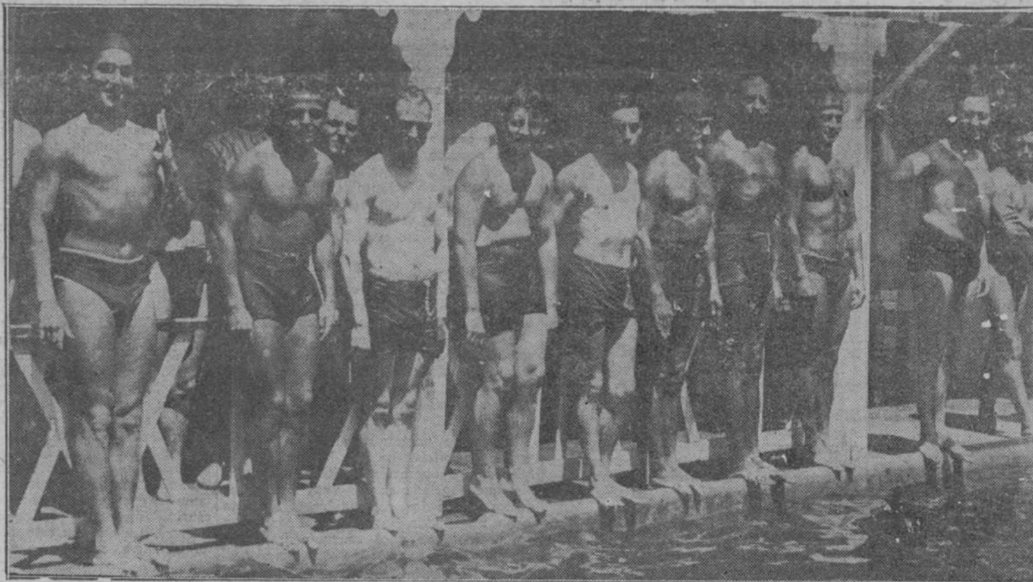
EN EL NIAGARA.—Los nadadores que representan a España en los campeonatos de "water-polo" de Lisboa.