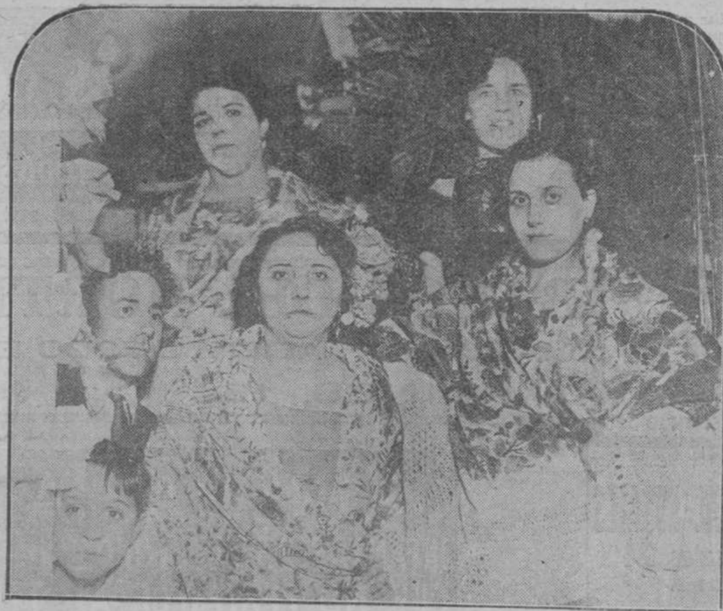
LA VERBENA DE SAN CAYETANO.—Madrileñas castizas con sus mantones de Manila, que vendieron papeletas en la tómbola de la "Kermesse".