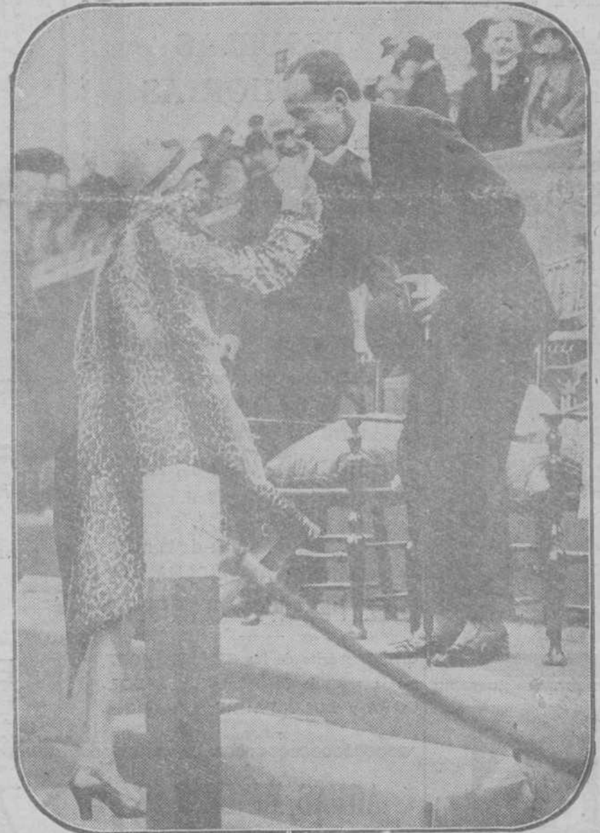
LOS REYES DE ESPAÑA, EN LONDRES.—Su Majestad el Rey saludando a la duquesa de Poñaranda en un momento del partido de polo que se celebró en Hurlingham.