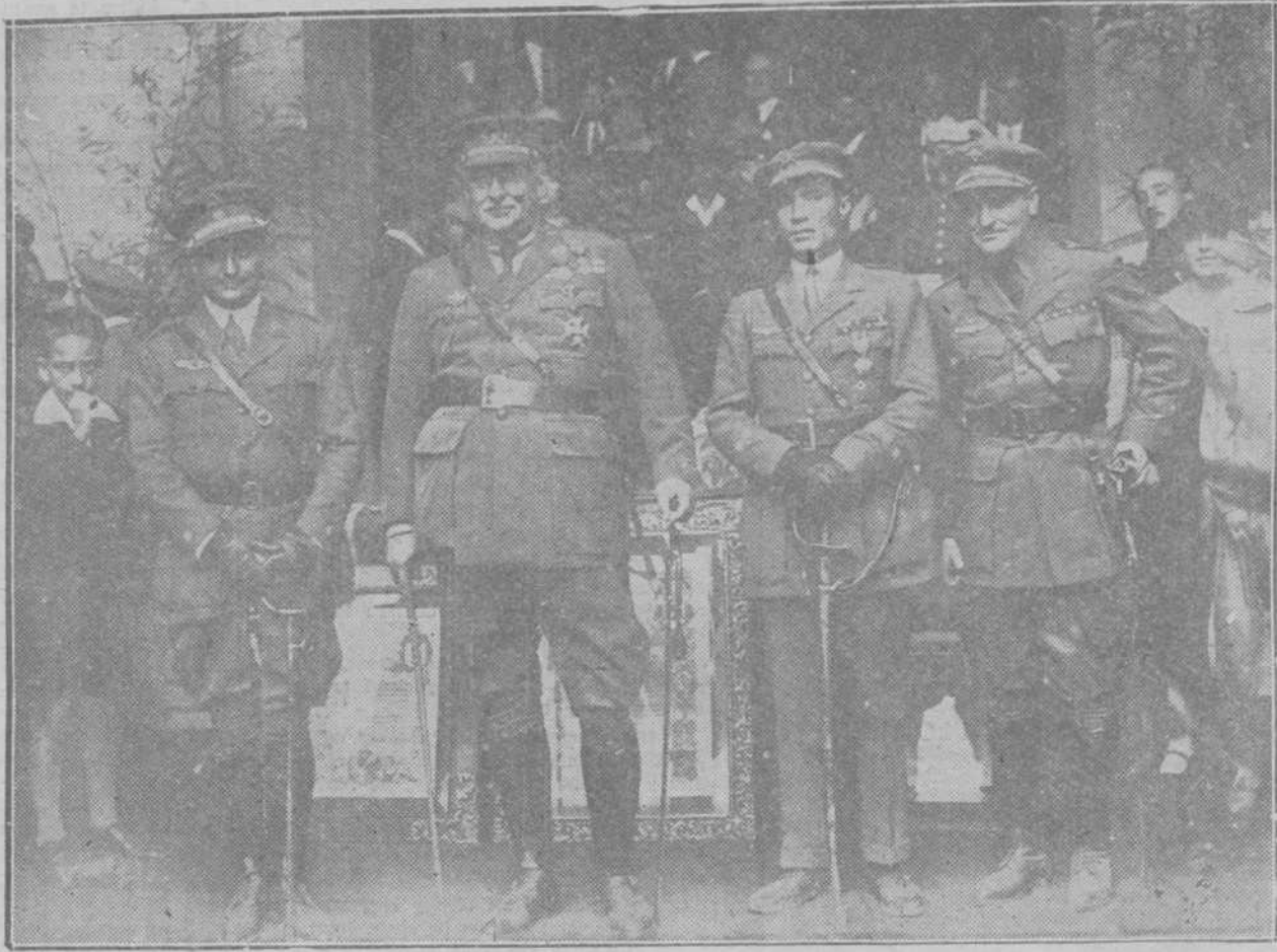
LA ACADEMIA DE AVIACION Y LOS AVIADORES.—El Presidente con el comandante Franco y los capitanes Gall Esteve durante la fiesta celebrada el sábado en el Alcázar toledano, en honor de éstos.