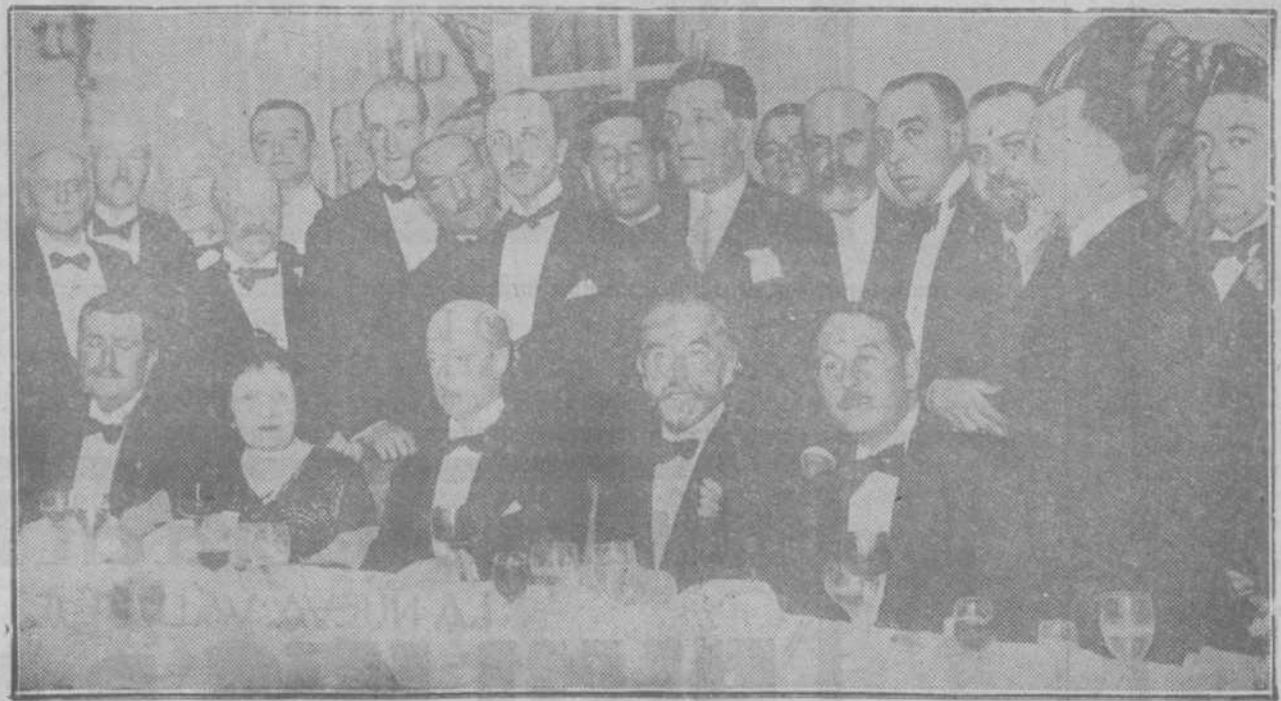
EN EL RITZ.—Banquete dado a los conferenciantes del ciclo de San Francisco de Asís por el Colegio de Doctores.