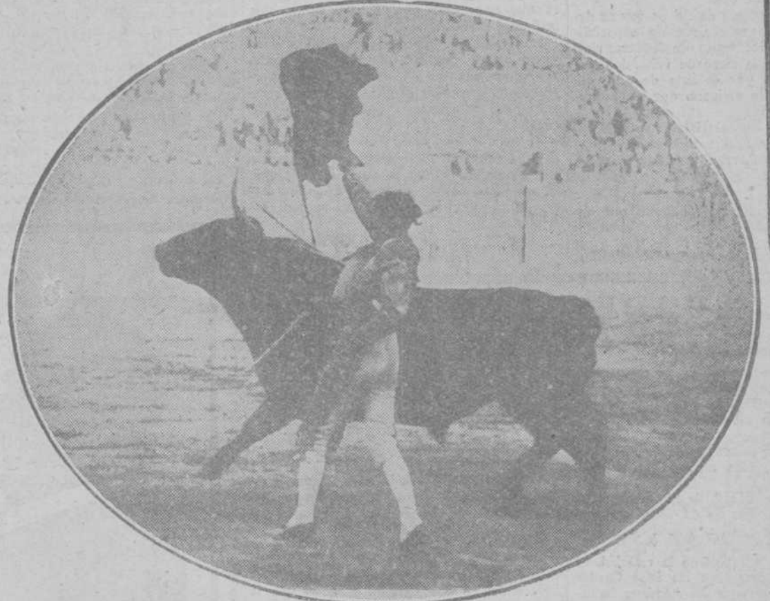
EN LA PLAZA DE VISTA ALEGRE.—Nacional I pasando de muleta a uno de sus toros.