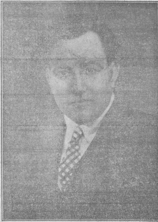
El gran cantante español Miguel Fleita, que el próximo jueves se presentará a nuestro público en el Teatro España