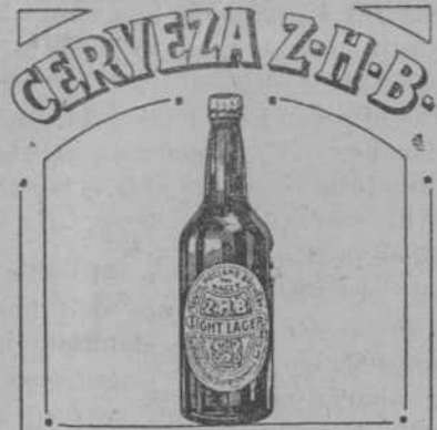
AGENTES PARA MARRUECOS CORIAT & CIA EN TANGER

Los señores Coriat y Compañía, agentes de la cerveza Z. H. B., tienen el honor de informar a su fiel clientela, que a pesar de la tan buena acogida que dió el público al concurso de cápsulas Z. H. B., efectuado en Diciembre del año pasado, este año se prepara hacer un mayor regalo, que consiste en