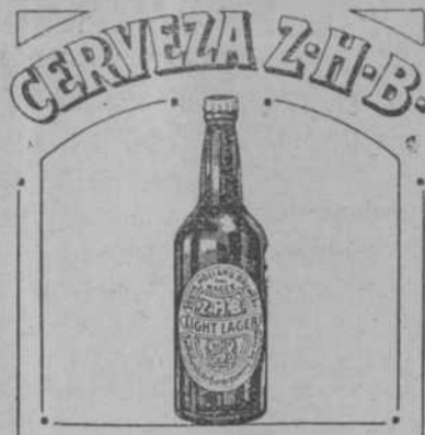
AGENTES PARA MARRUECOS CORIAT & CIA EN TANGER

Los señores Coriat y Compañia, agentes de la cerveza Z. H. B., tienen el honor de informar a su clientela, que a pesar de la tan buena acogida que dió el público al concurso de cápsulas Z. H. B., efectuado en Diciembre del año pasado, este año se propone hacer un mayor regalo, que consiste en