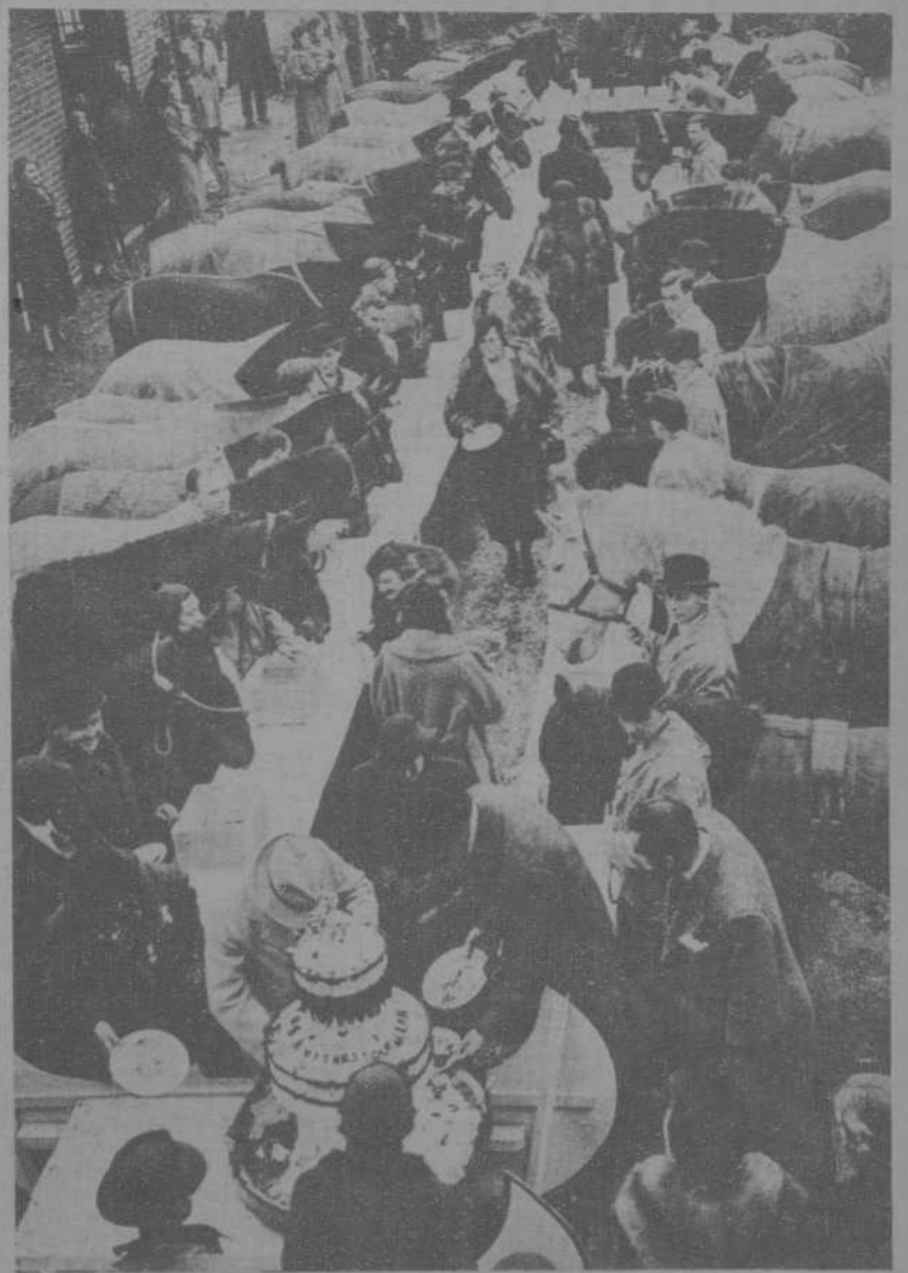
En Inglaterra los deportistas ofrecen por Navidad a los caballos enfermos un gran pastel. Los caballos están atendidos en el sanatorio de Ilford. Lo lamentable es que en dicho día haya en Londres criaturas humanas que vivan en tugurios y no tengan que comer.