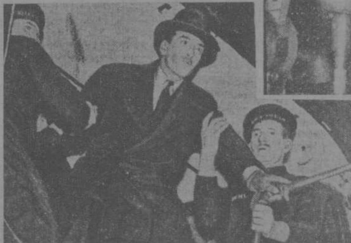
El exministro inglés al desembarcar de "Aquitania" tuvieron que protegerle dos tripulantes del trasatlántico para librarle de la nube de repórters y fotógrafos que iban a caer sobre él