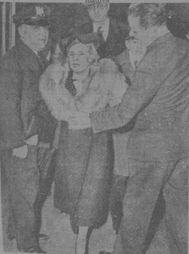
La "tercera madre" sale del Tribunal gritando: "¡Este niño es mi hijo!"