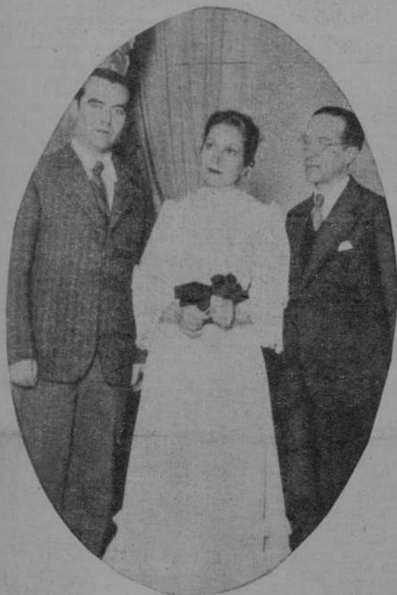
Margarita Xirgu acompañada del poeta García Lorca—fusilado por los facciosos en Granada—y de Cipriano Rivas Cherif, en el entreacto de una representación, en Barcelona, de "Doña Rosita la soltera o el lenguaje de las flores".