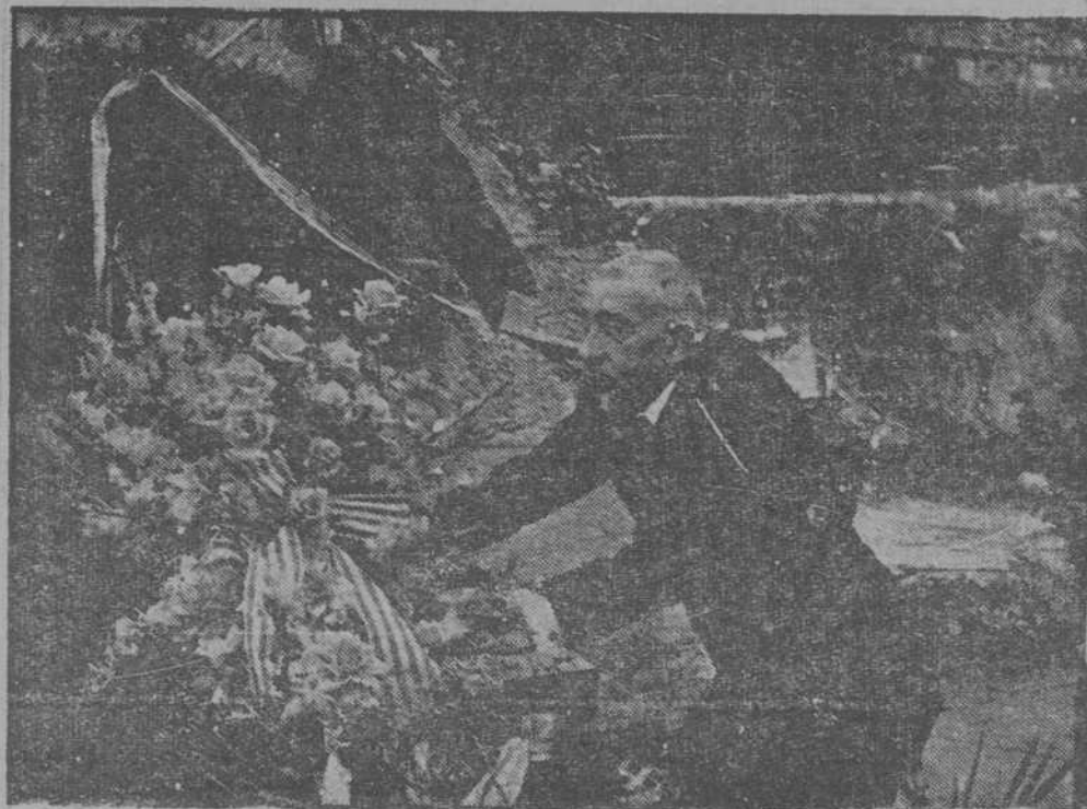
El presidente del Parlamento de Cataluña, don José Iñá Bauzá, depositando una corona

que se ha evitado la guerra, pero en el Parlamento se hacen numerosas críticas. También en el Gabinete se manifiestan divisiones entre los ministros. Sin embargo, el partido conservador dice que el Parlamento no aceptará el voto de censura. El "Times" dice que Checoslovaquia ha merecido el agradecimiento de la humanidad porque ha salvado la paz; pero hay que calmar no sólo al débil, sino también al más fuerte.