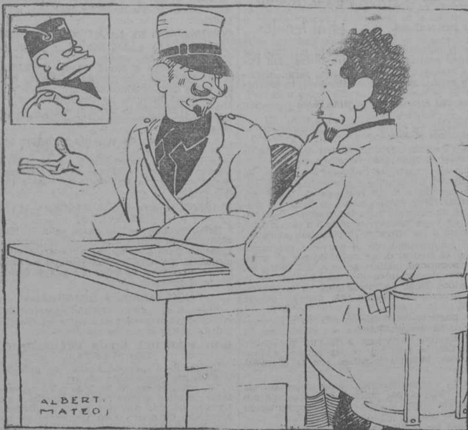
—Si en una futura guerra hubiésemos de luchar contra Inglaterra y Francia, ¿quién nos sacaría de apuros en otro posible Caporetto?