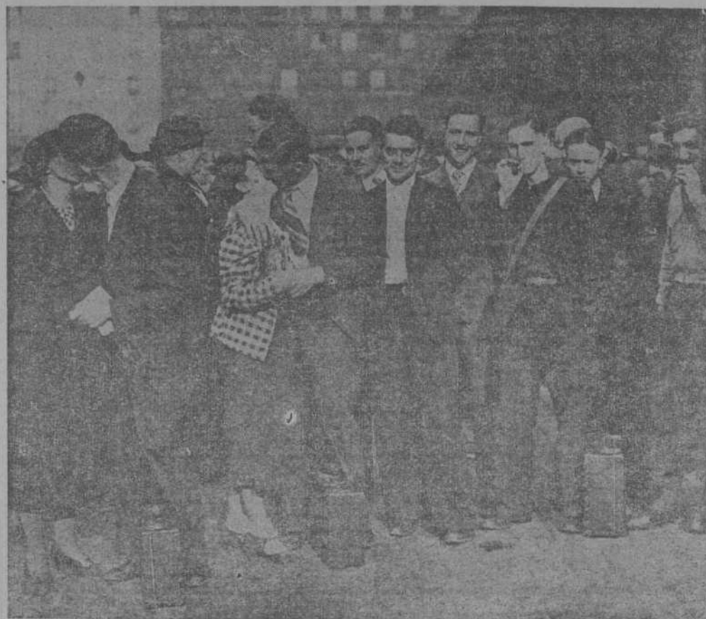
París. — Escenas de despedida de los reclutas en la Estación del Este