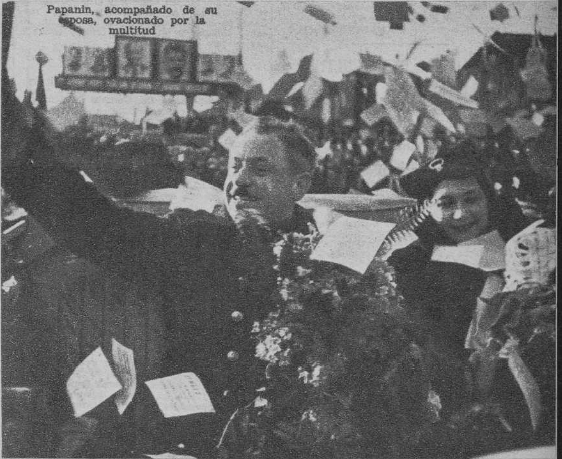
Papanin, acompañado de su esposa, ovacionado por la multitud