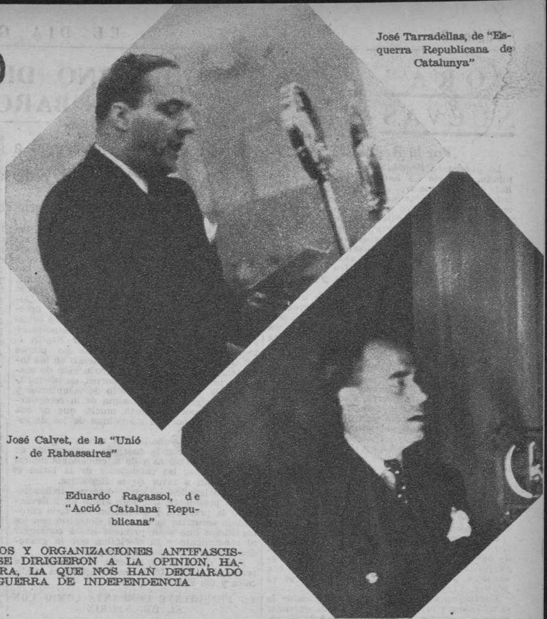
José Tarradellas, de "Esquerra Republicana de Catalunya"