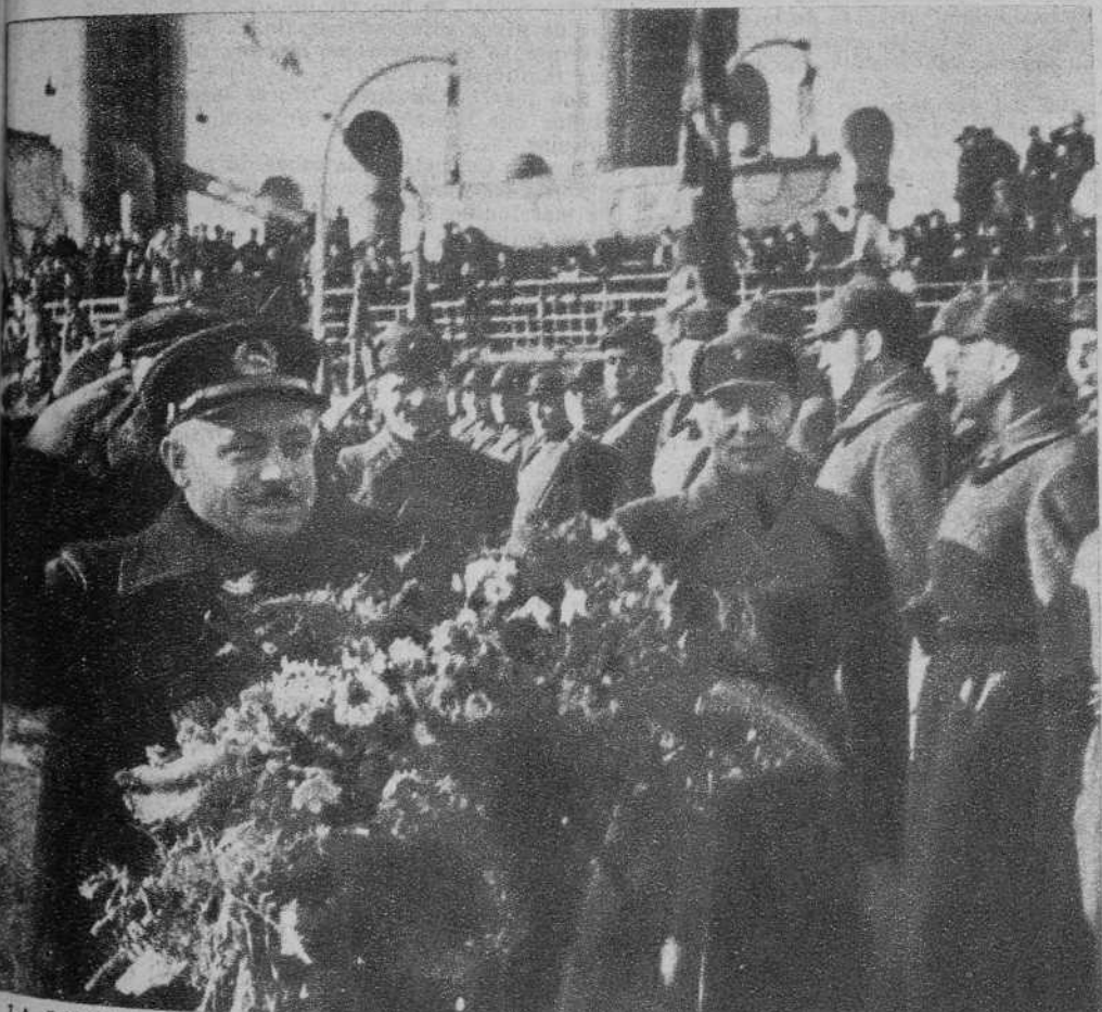
LA LLEGADA A LENINGRADO DE LOS EXPEDICIONARIOS POLARES QUE INVERNARON EN UN TEMPANO DE HIELO