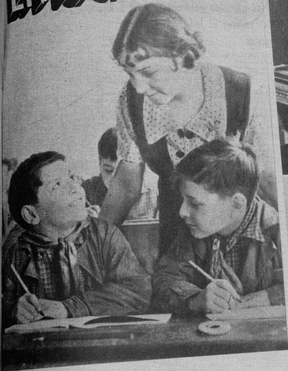
LOS NIÑOS ESPAÑOLES EN LA U. R. S. S.