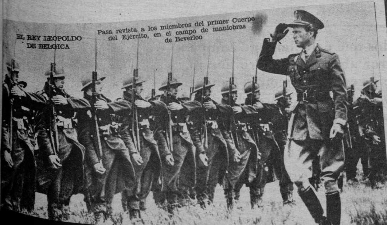
Pasa revista a los miembros del primer Cuerpo del Ejército, en el campo de maniobras de Beverloo