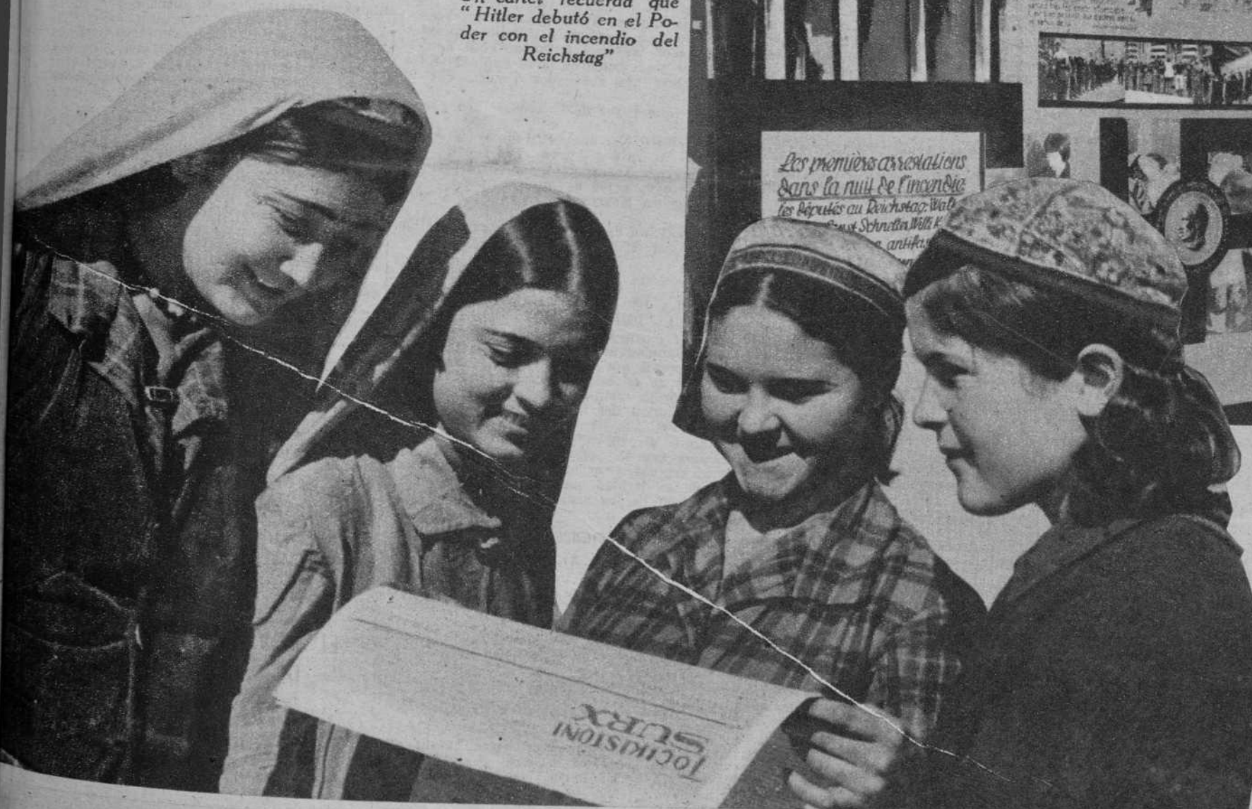
Tres muchachas de la República de Tadjikie, leyendo un periódico editado en su lengua nacional