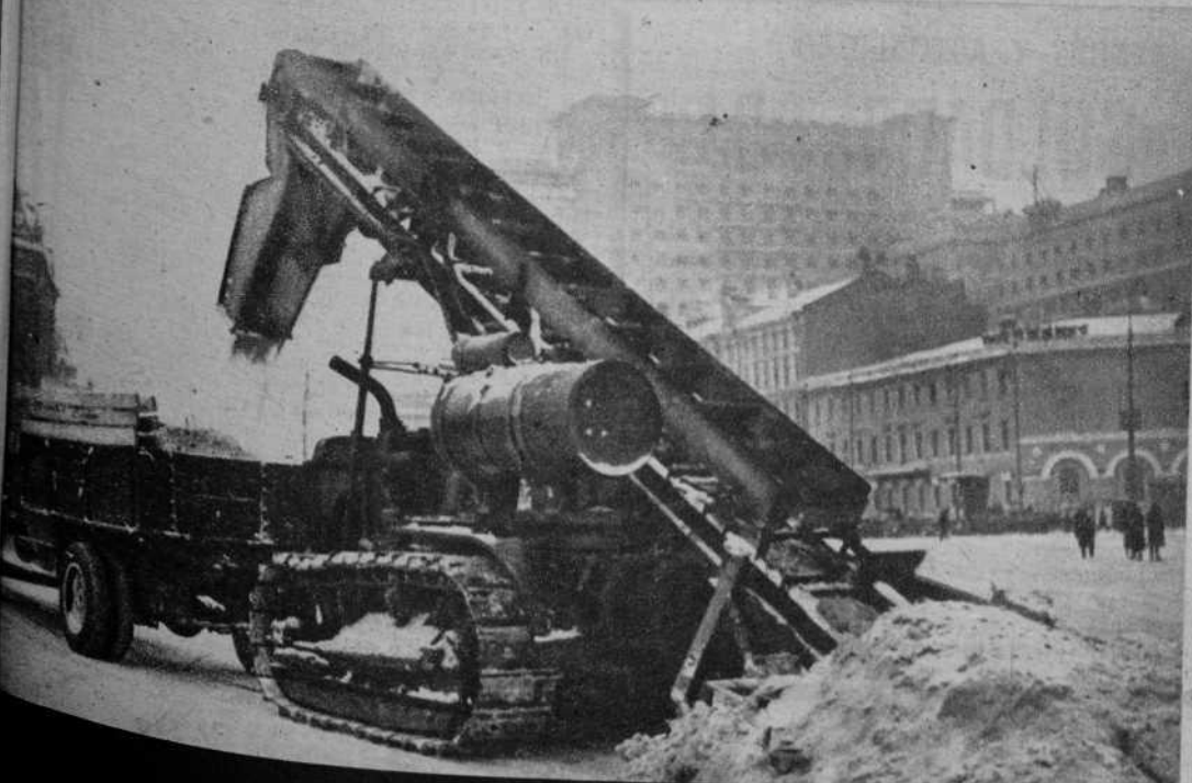
Cómo se limpian de nieve las calles de Moscú, después de las grandes nevadas