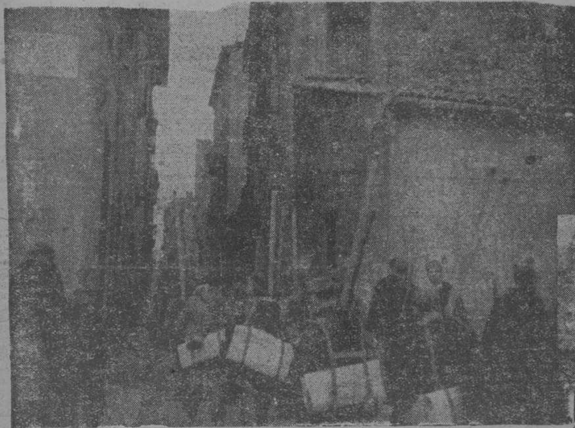
Paso de soldados de la República por el Teruel reconquistado