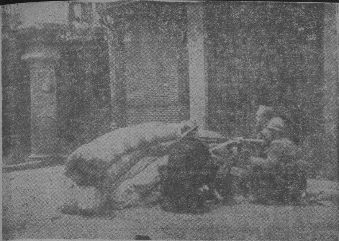
Soldados de la República, detrás de un parapeto, haciendo fuego de ametralladora contra uno de los últimos focos rebeldes