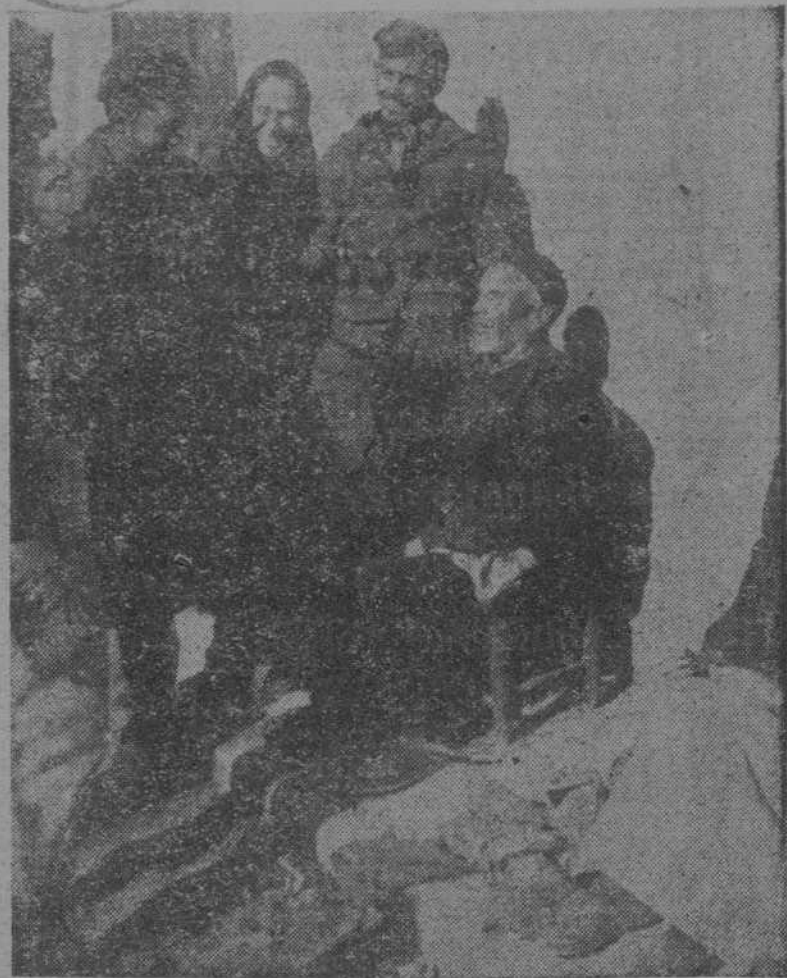
Un anciano conversando con los soldados de la República