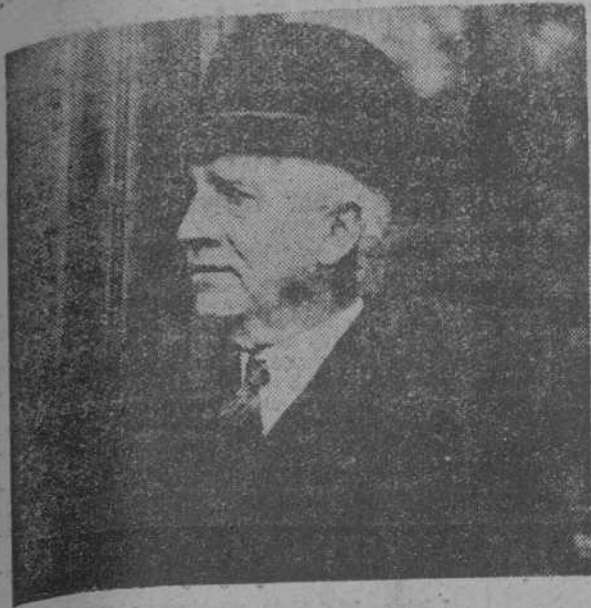
LA CONFERENCIA DEL PACIFICO