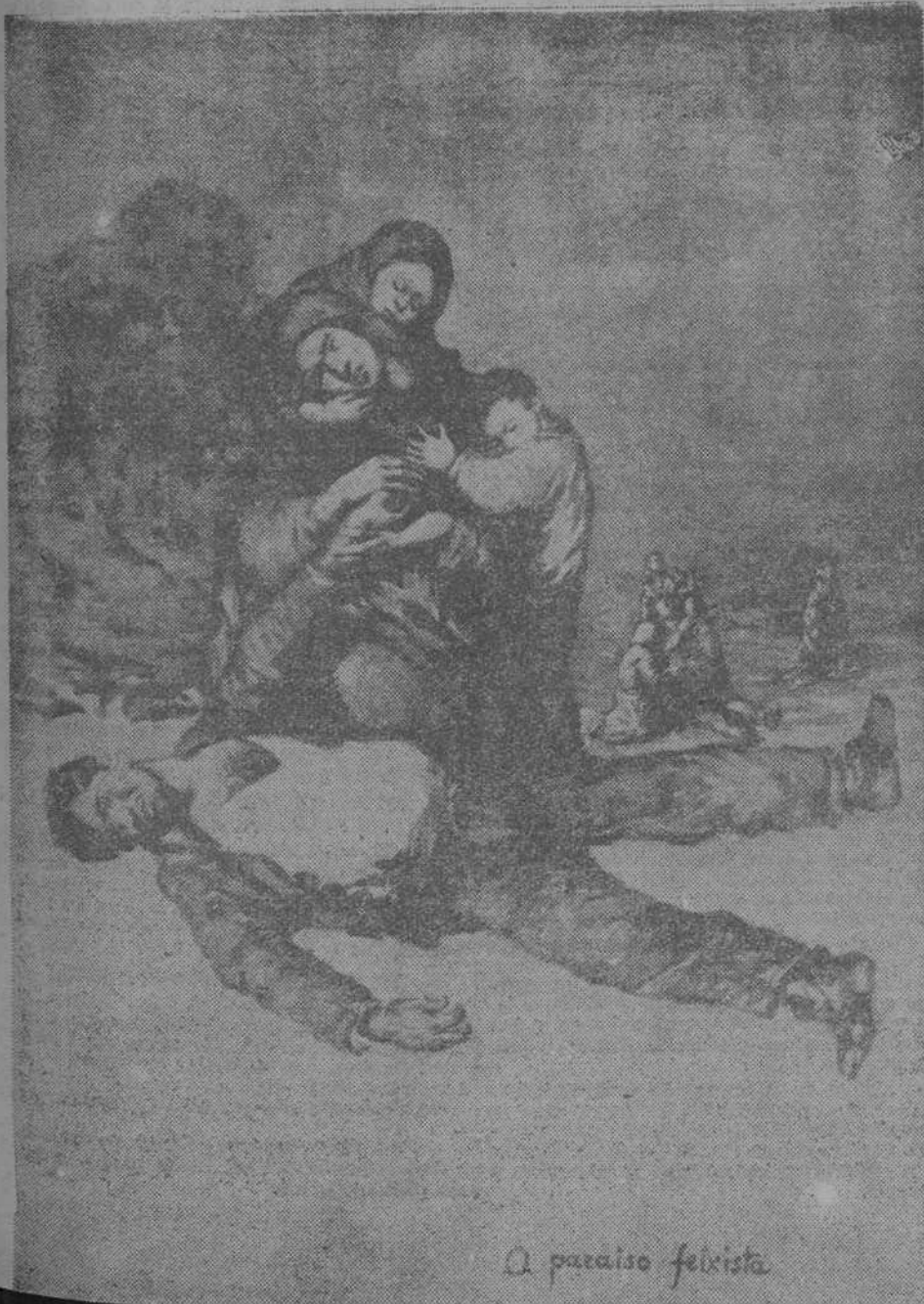
A paraíso fascista