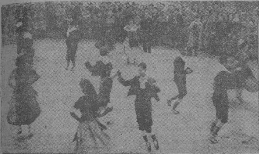
Festival popular de danzas catalanas organizado por la Delegación de la Generalidad en Madrid para festejar el primer aniversario de la defensa de la capital de la República