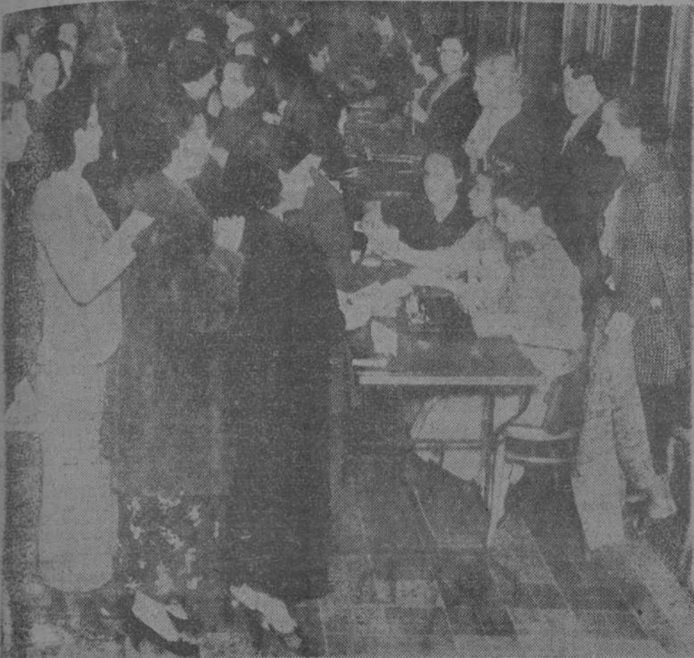
Los congresistas en el Palau de la Música Catalana, ayer mañana, facilitándoles direcciones para su alojamiento