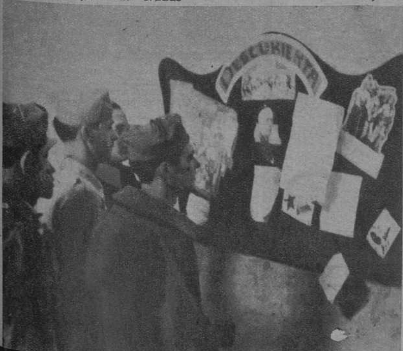
Soldados de un escuadrón de caballería, leyendo su periódico mural colocado en un puesto avanzado