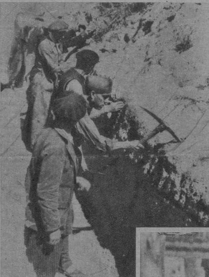
Trincheras ocupadas al enemigo en uno de los sectores de Madrid y que los fortificadores ponen inmediatamente en condiciones de ser utilizadas por los soldados de la República