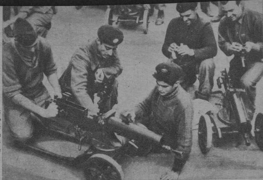
El material de guerra es cuidado con gran celo por los soldados, que engrasan a diario las ametralladoras para tenerlas en disposición de batir al enemigo y conservarlas