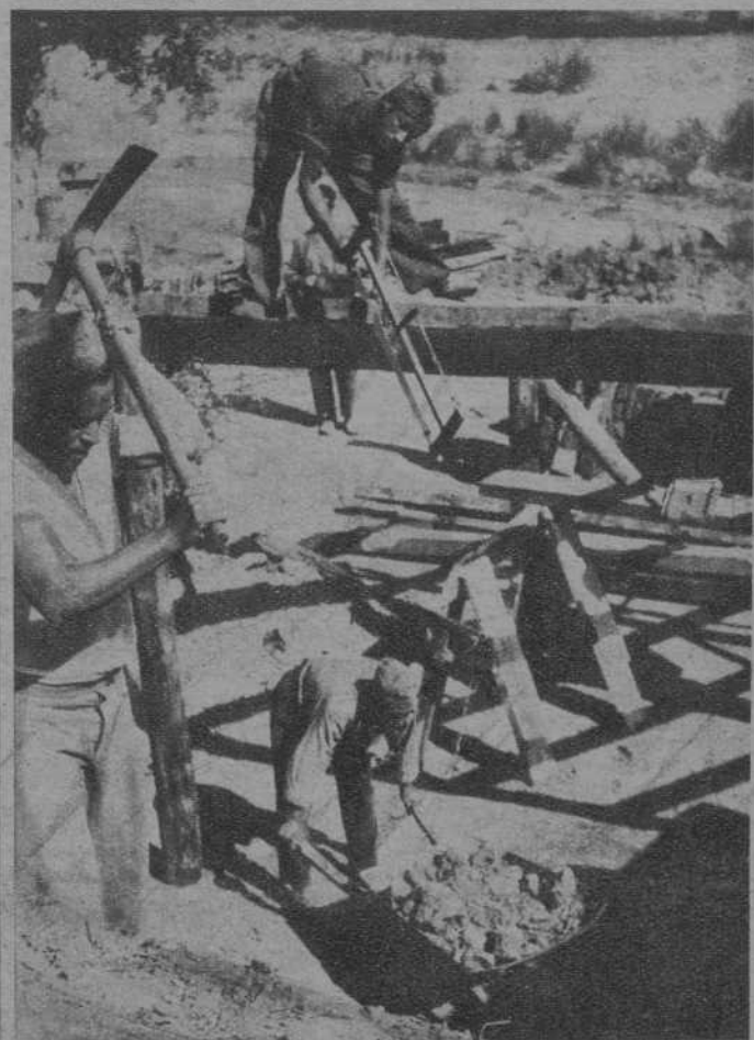
Soldados carpinteros de una brigada, en plena actividad, a pocos metros de la línea de fuego

Escenas de la vida de los combatientes de la República