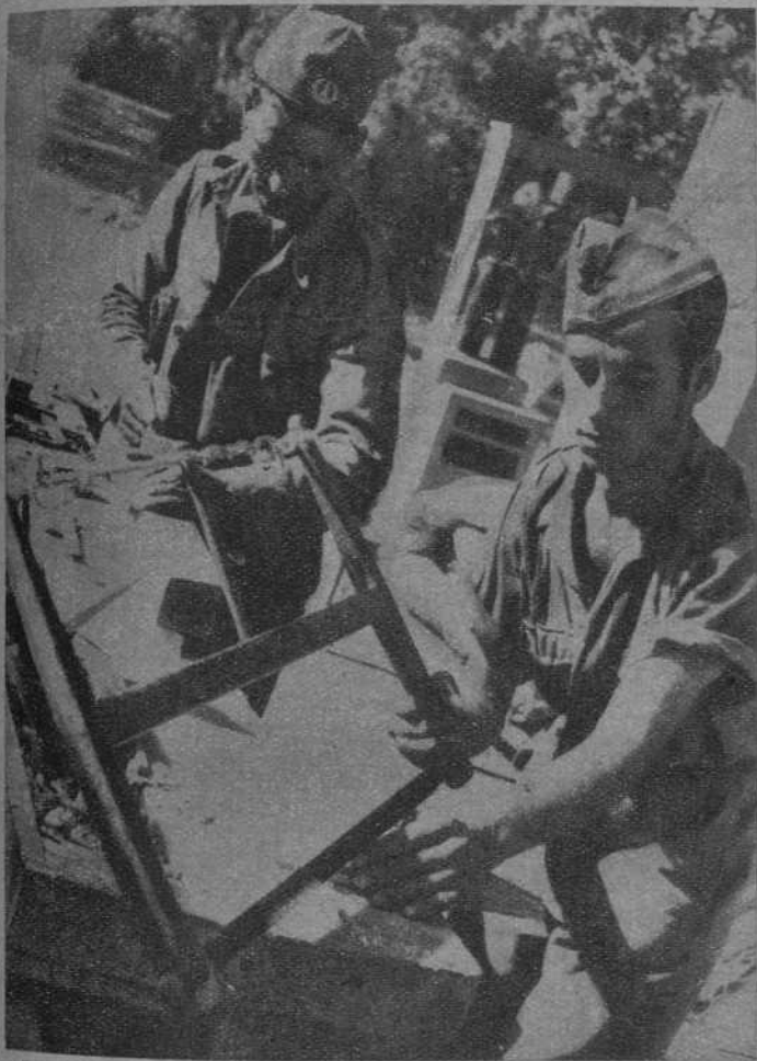
Para preservarse de los rigores del frío, los soldados se construyen sus chavolas, con objeto de guarecerse en las jornadas crudas