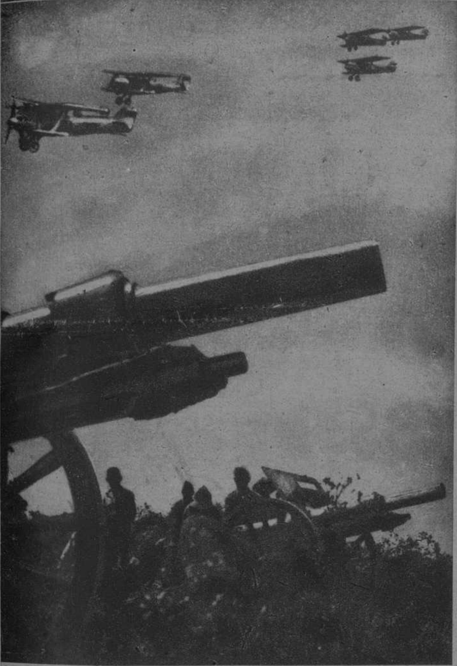
Después de haber bombardeado las posiciones enemigas, la aviación republicana regresa a sus bases, defendidas por baterías antiaéreas