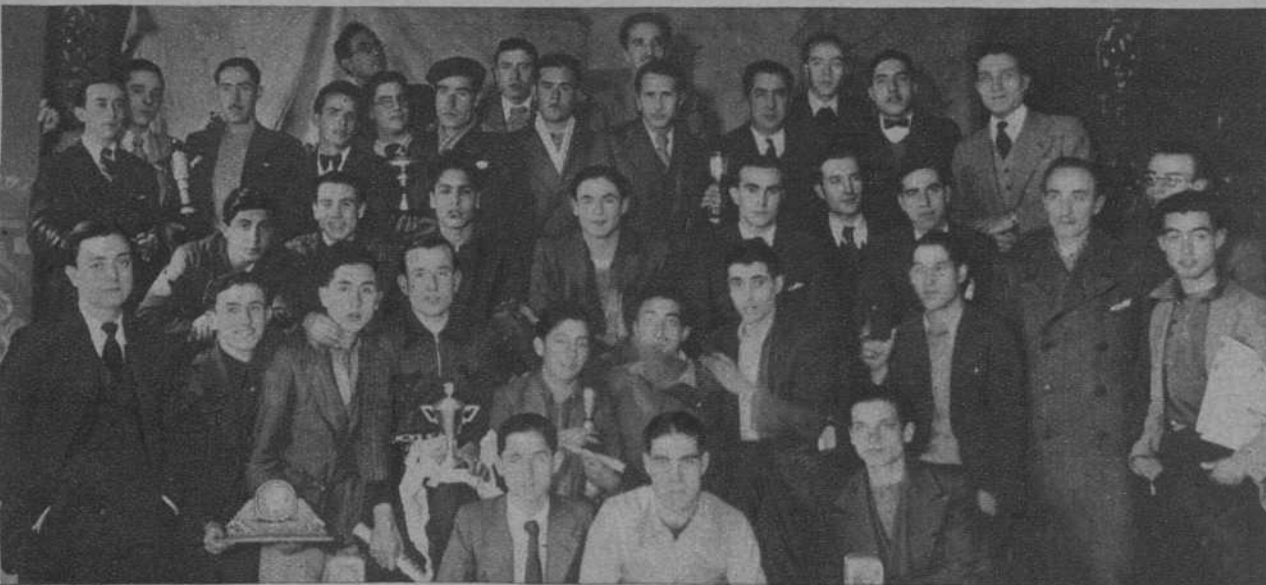
Reparto de premios de la «Jean Bouin», en el local del «Centre d'Esports Aire Lliure» ←