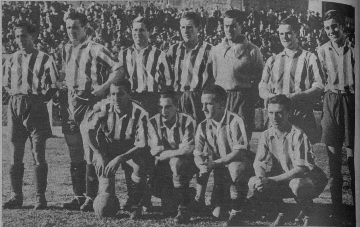
El equipo del «Athlétic».