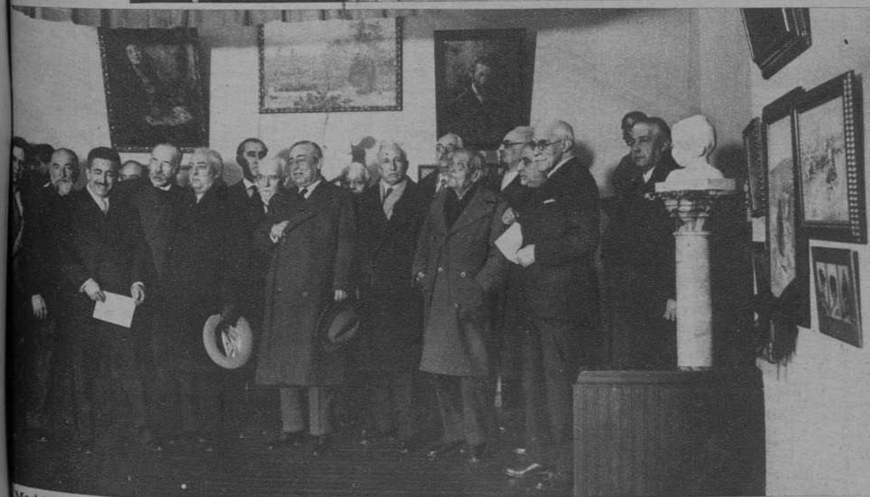
Madrid. — Inauguración de la Exposición de obras de Benlliure, Blas, Garnelo, Anasagasti y Muñoz, por el ministro de Instrucción y el alcalde, en la Asociación de escritores y artistas.