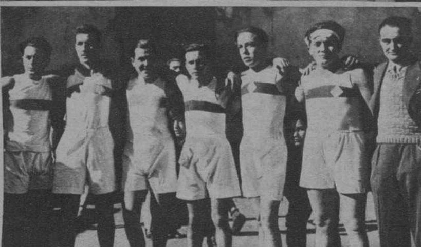
Equipo de basquet-ball del «Basquet Club Poble Nou».