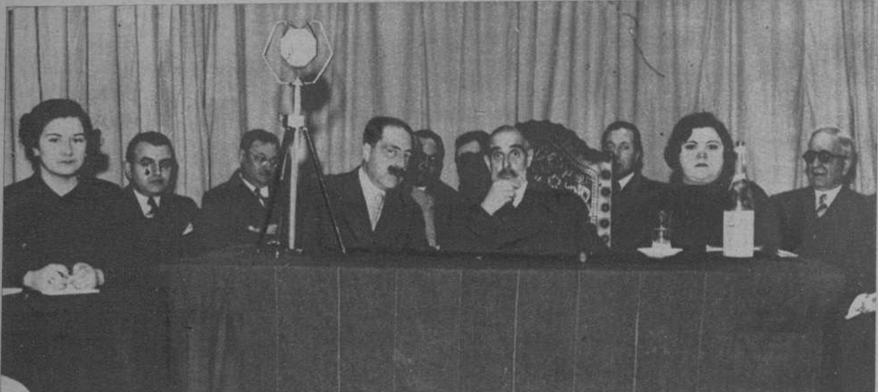
El señor Cambó, en la presidencia del acto celebrado en el Ateneo Catalanista del distrito II, en el que el leader de la «Lliga» pronunció un importante discurso.