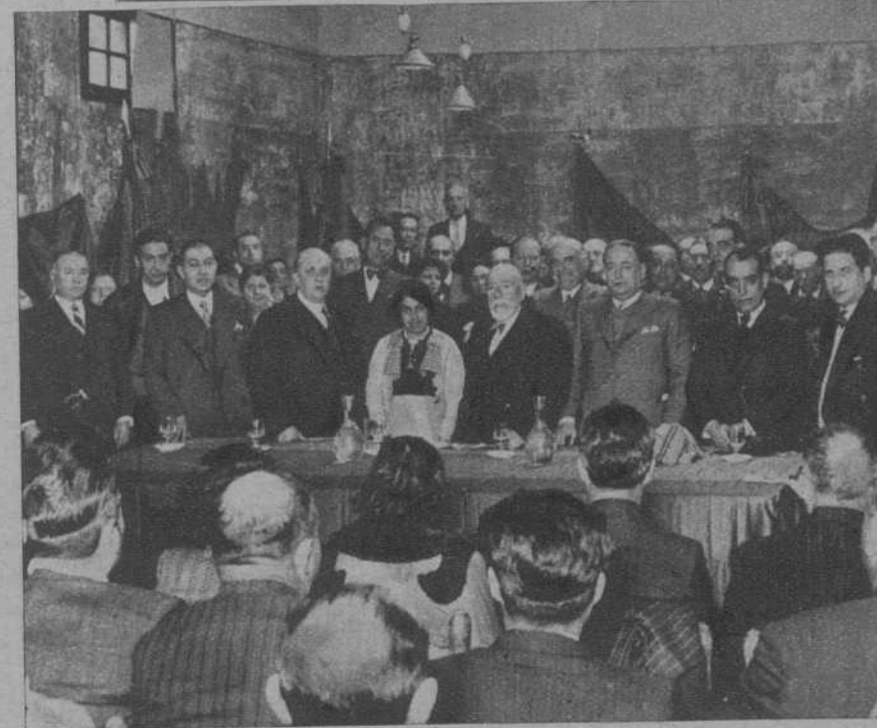
La presidencia del mitin en el Centro Radical