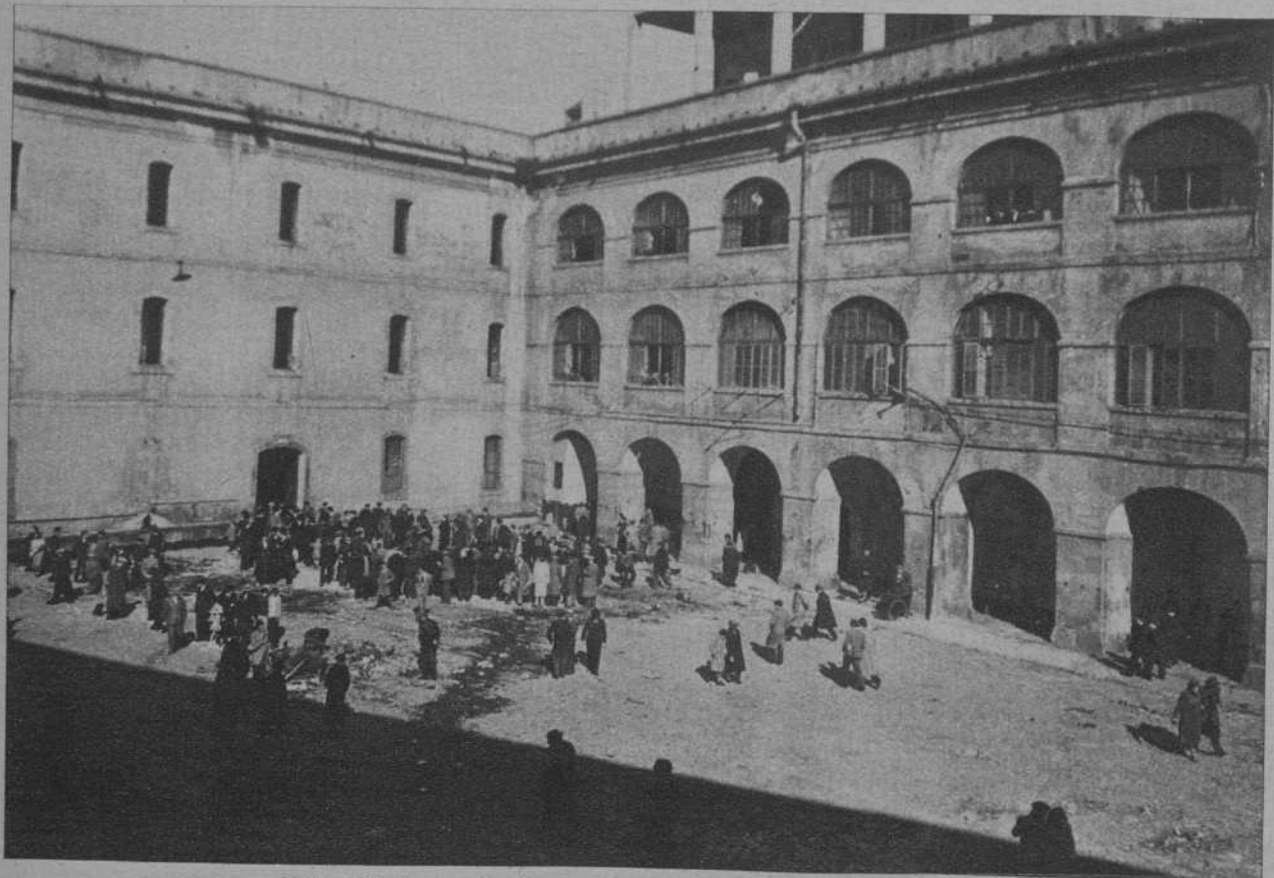
Vista del cuartel de Atarazanas, que pronto será derribado.