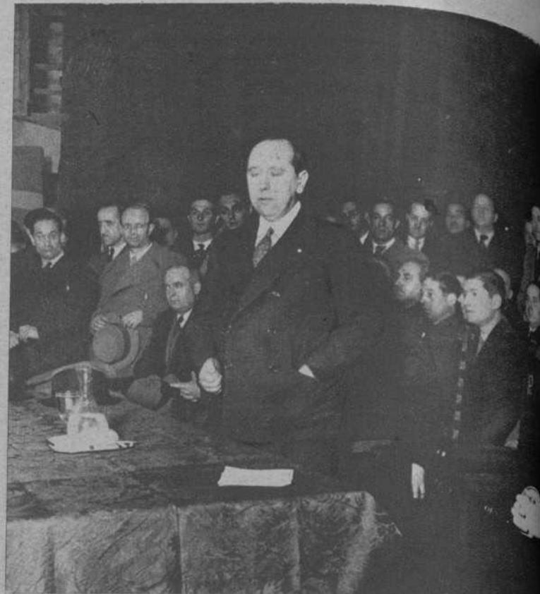
El señor Gil Robles, pronunciando su discurso en Tarragona