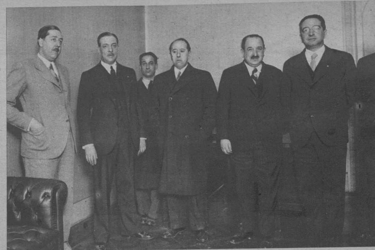
El señor Gil Robles y la Junta de la Ceda, en Barcelona