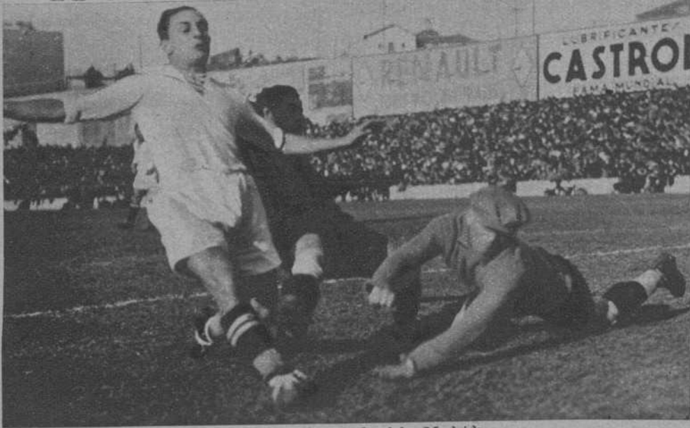
Uno de los ocho goals del «Madrid»