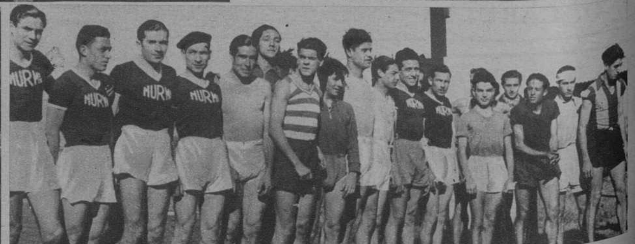
Atletas participantes en el Cross de preparación para el Campeonato de España