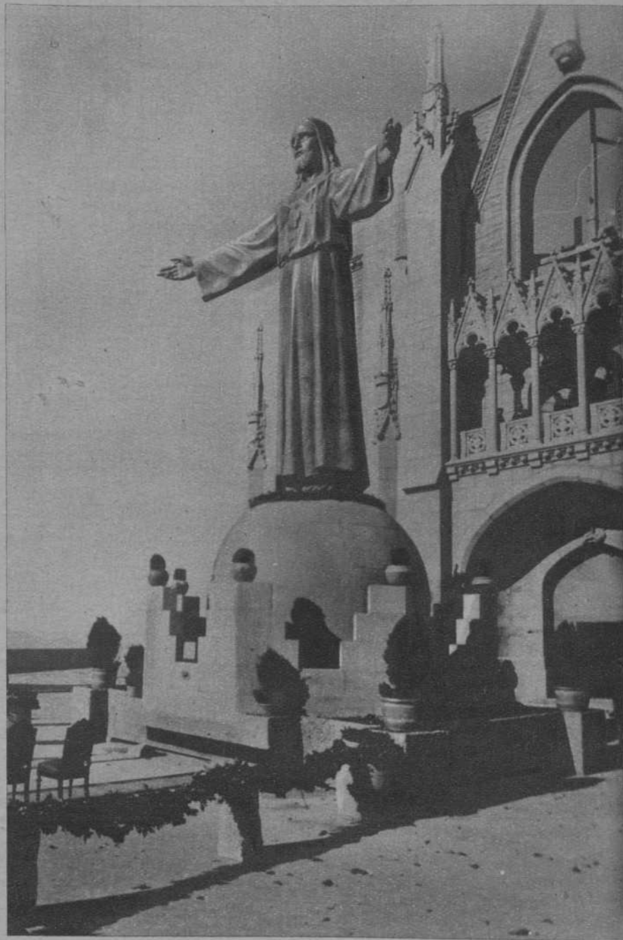
El monumento al Sagrado Corazón de Jesús, inaugurado en el templo