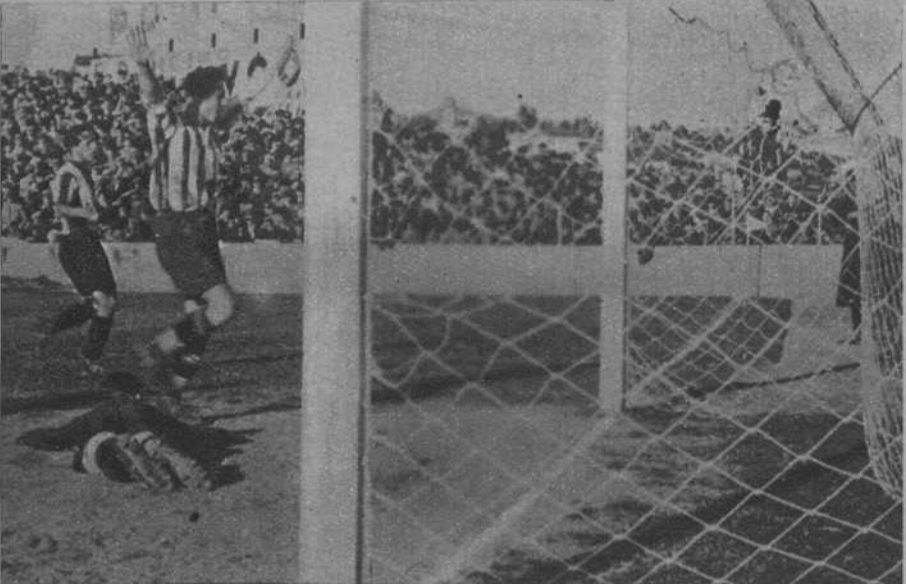
El goal de Elicegui