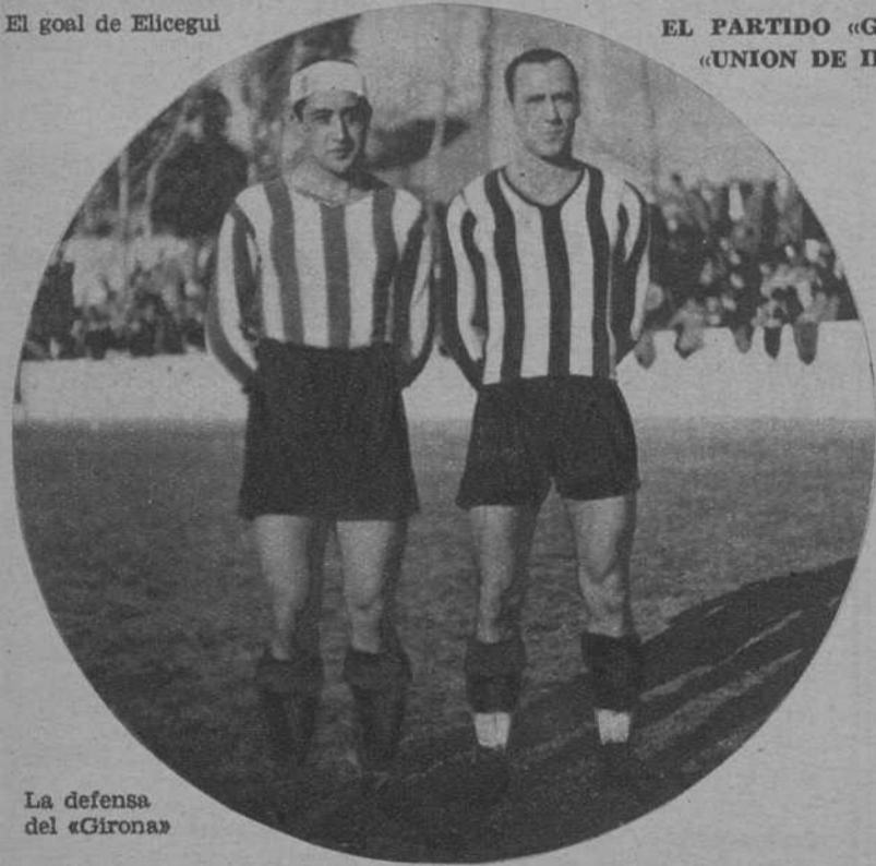
La defensa del «Girona»