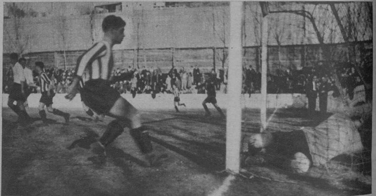
El goal marcado por el «Girona».