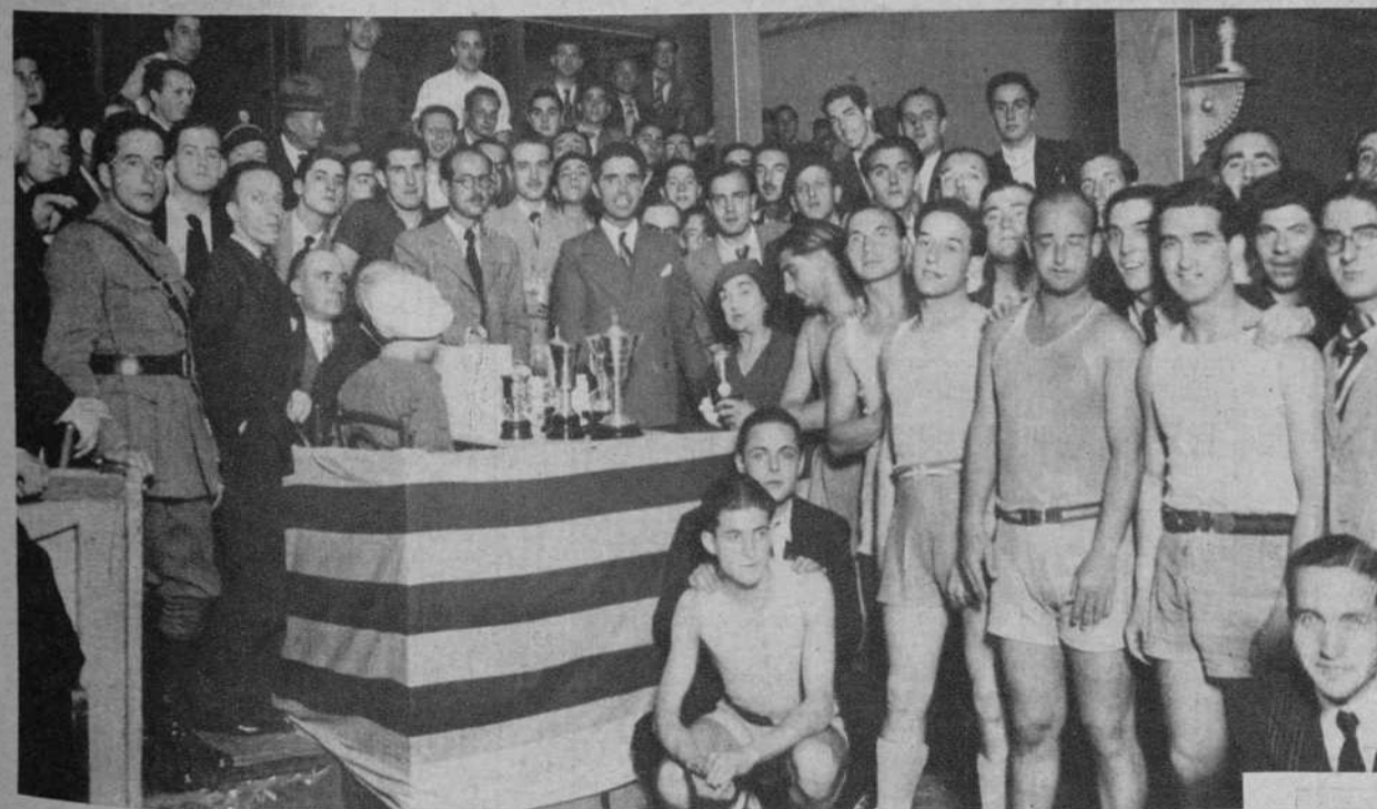
Reparto de premios al equipo vencedor de basket-ball.