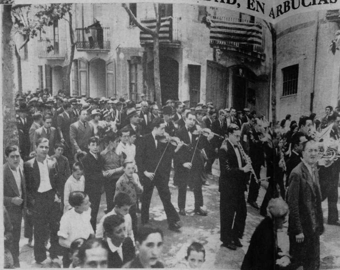
Dos detalles de la estancia del señor Companys en Arbucias, donde asistió al acto de dar el nombre de Francisco Maciá a una calle.