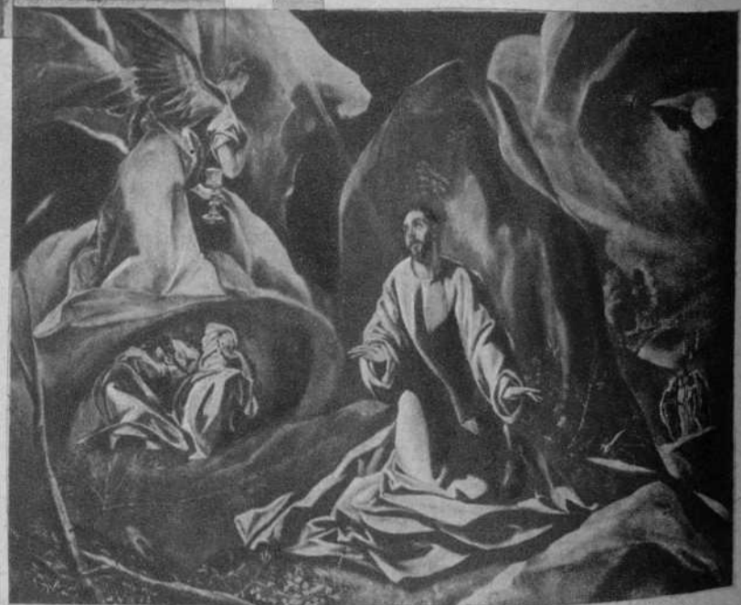
La agonía en el jardín, del Greco