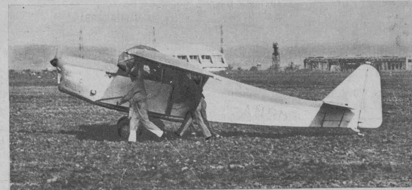
El avión de «Le Petit Marsellais»