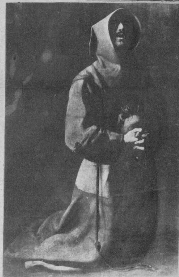
San Francisco, de Zurbarán

toledano. El valor de estos dos lienzos iguala casi el de sus mejores de Toledo.