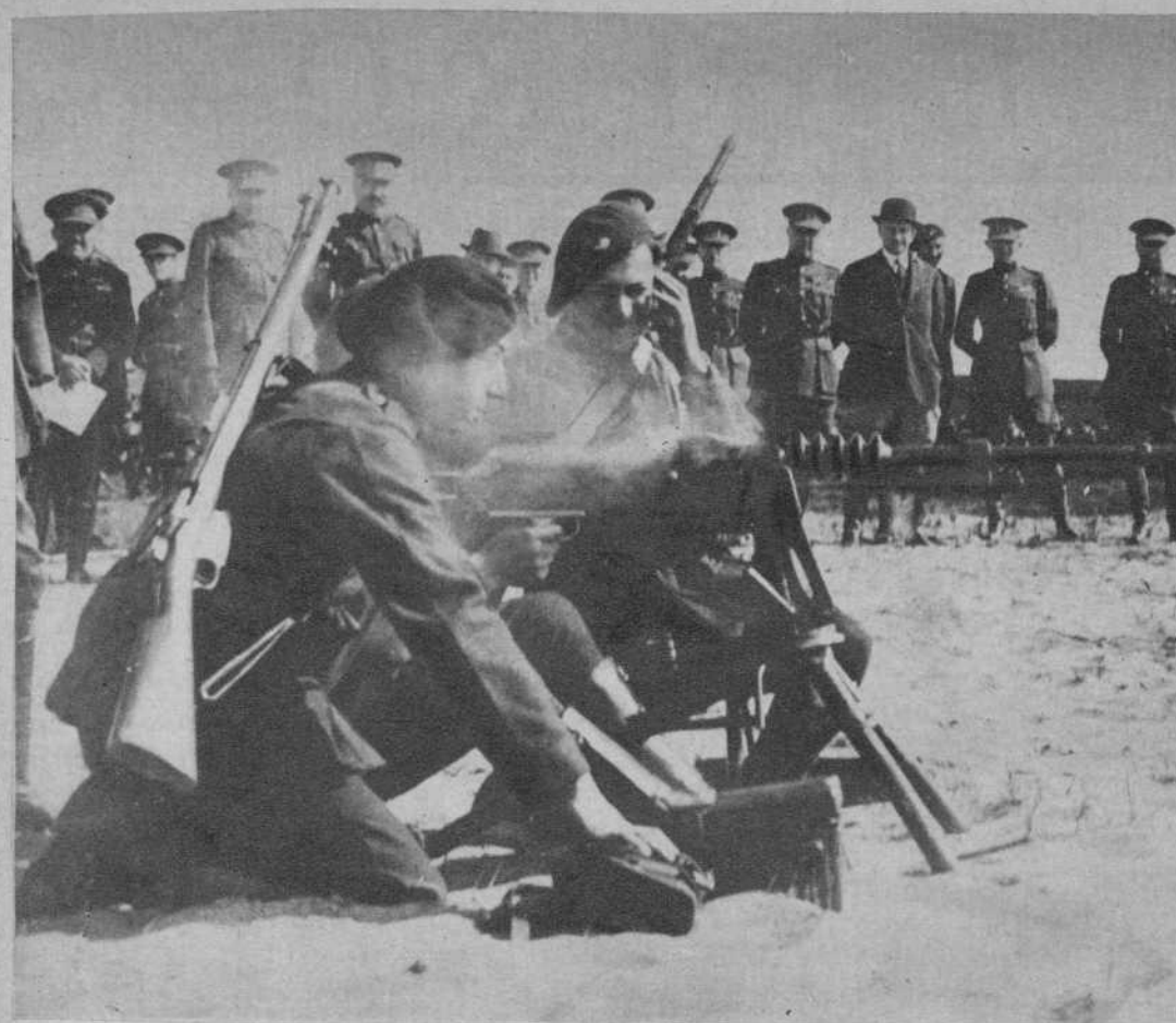
Las maniobras militares belgas en Beverloo.