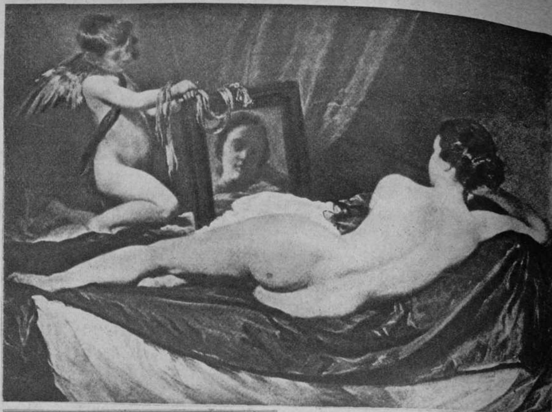
La Venus del Espejo, de Velázquez

Anteriores a éstos, cronológicamente, pero de un modernismo maravilloso en el tono de sus colores, es El Greco, «el más real de los pintores españoles», según Sir Charles Holmes. Tiene aquí «Cristo expulsando a los mercaderes del templo», «La agonía en el jardín» y los retratos de «Luigi Cornaro» y de «Un Santo». El tema de los dos primeros son escenas de la vida de Jesucristo, y en ambos se adivina la pasión religiosa llevada casi al misticismo tan propio de su tiempo, al través del inimitable colorido y el dibujo casi geométrico del astigmático artista