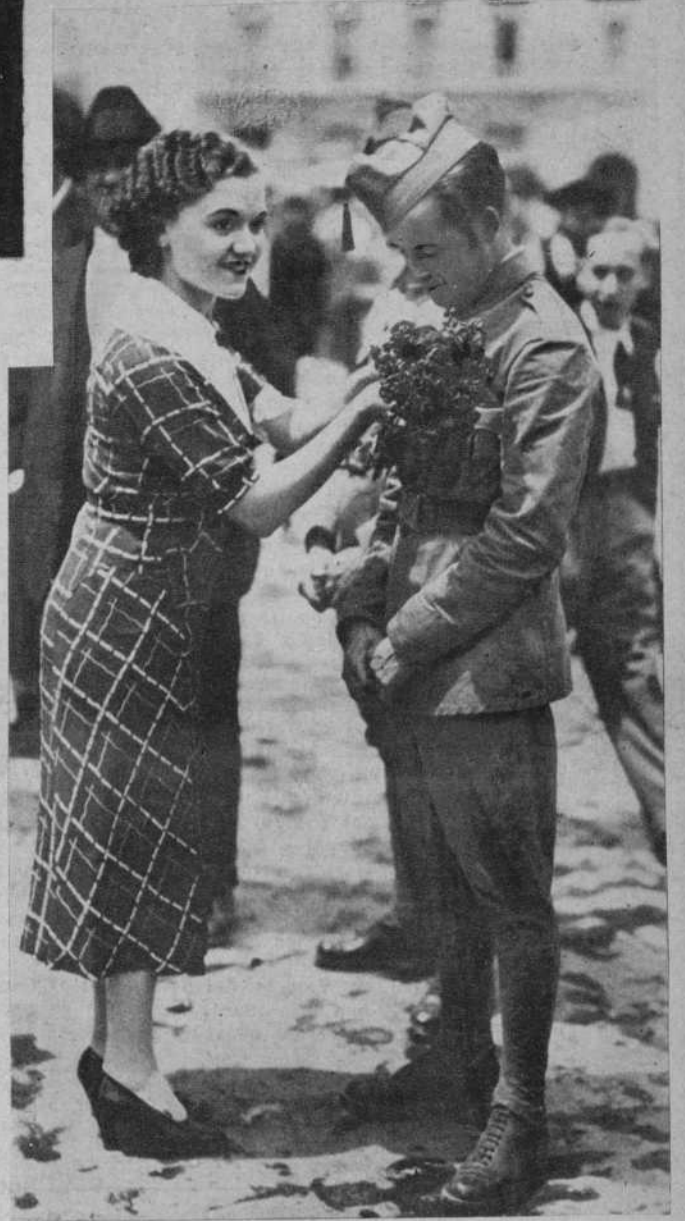
Una bella señorita, colocando una flor a un soldado