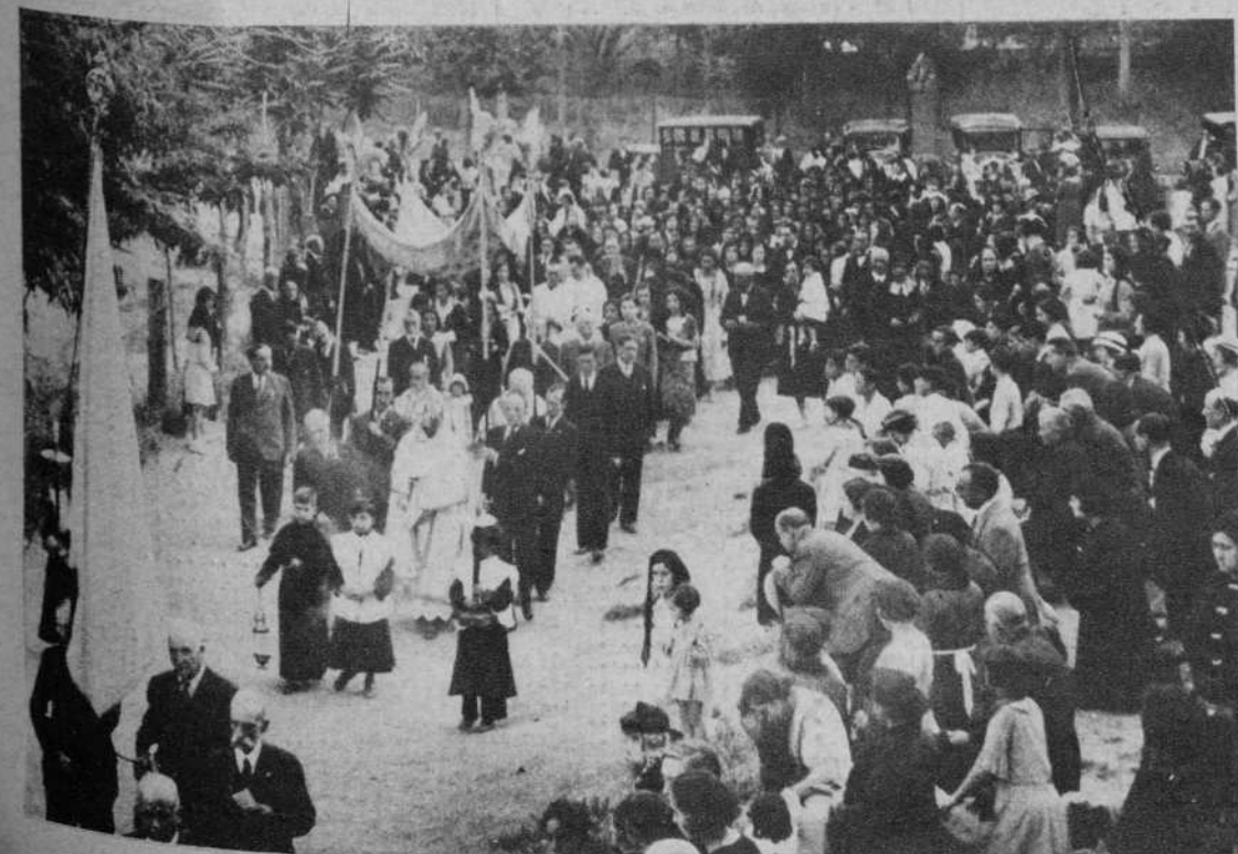
La procesión del Corpus, en la Sagrada Familia.—(Fot. Merletti).