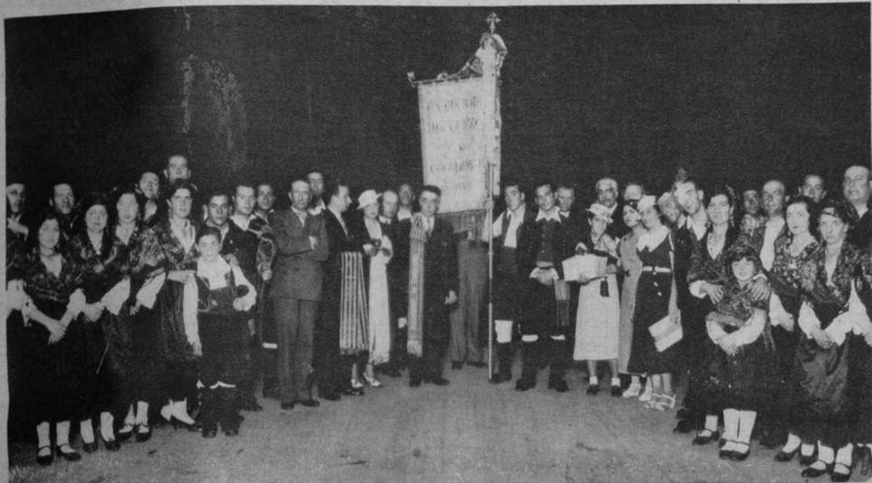
Colocación de corbatas al estandarte del coro galego «Cantigas da Terra».