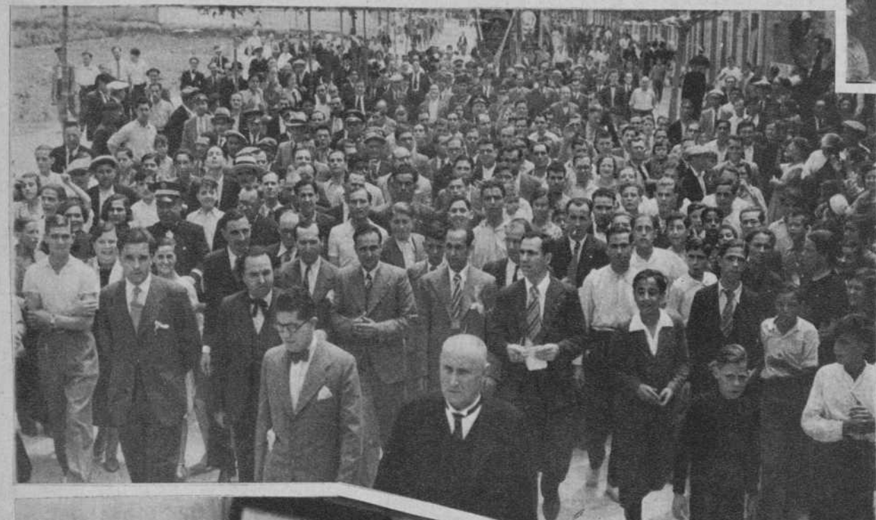
Cornella.—El Consejero de Cultura, Sr. Gassol, en el acto de inauguración de la nueva carretera.