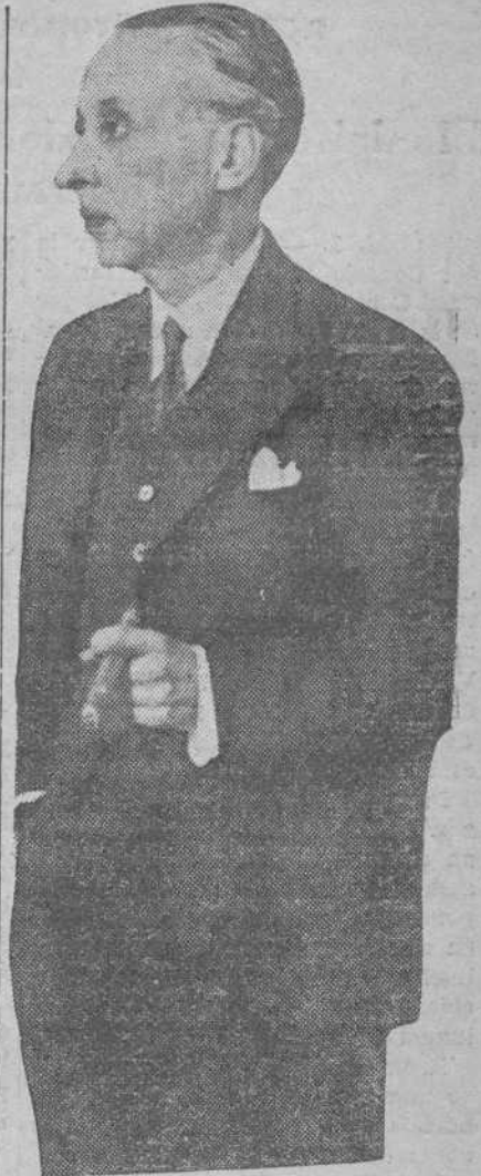
Don Alvaro de Albornoz, presidente del Tribunal de Garantías