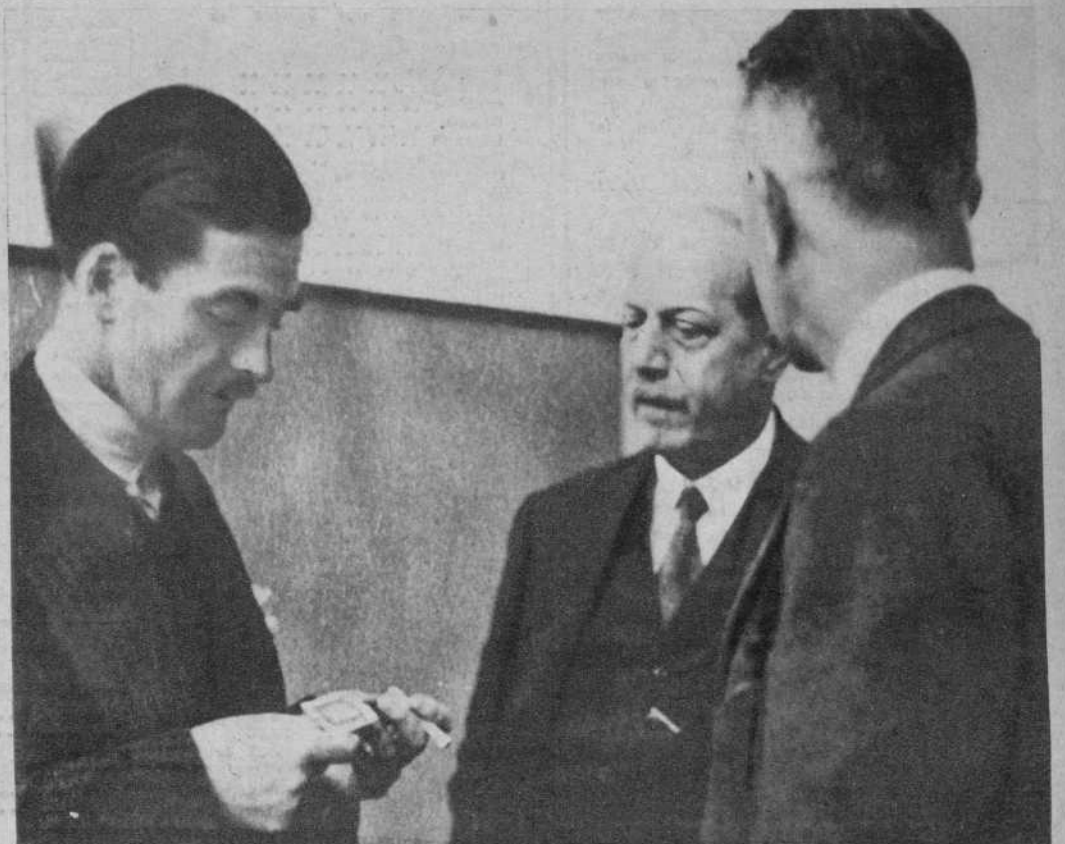
El lord del sello privado de Inglaterra, Mr. Eden, conversando con los periodistas en los pasillos del Palacio de la Sociedad de Naciones, de Ginebra, acerca del desarme.