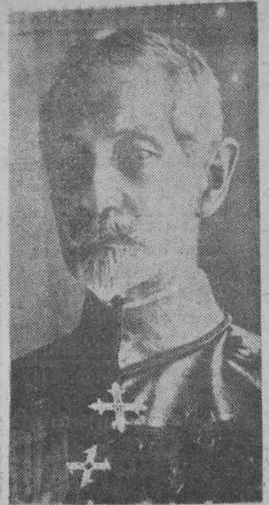
EL GENERAL AVERESCU