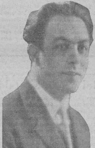
Don Juan Casanovas, presidente del Parlamento de Cataluña

del Estado y de la región autónoma. Quinto. La base segunda de la Ley de Reforma Agraria, al extender sus efectos a todo el territorio de la República y tener el mismo carácter sus complementarias (como el proyecto de arrendamiento de fincas rústicas presentado a las Cortes), ha llegado a producir una duplicidad de normas en gran parte contradictorias, que no observan escrupulosamente los básicos preceptos que establecieron la competencia legislativa.