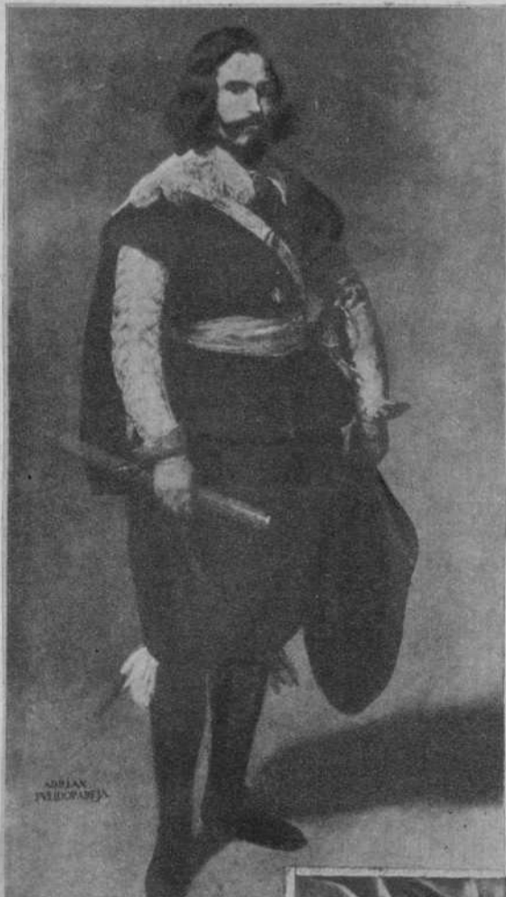
Retrato del almirante Pulido Pareja, de Velázquez