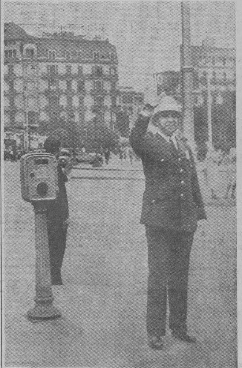
La flamante casaca azul, da un tono de gran elegancia a los policías de circulación, tocados ahora con flamantes salakofs blancos, que les defiende contra las inclemencias del sol.