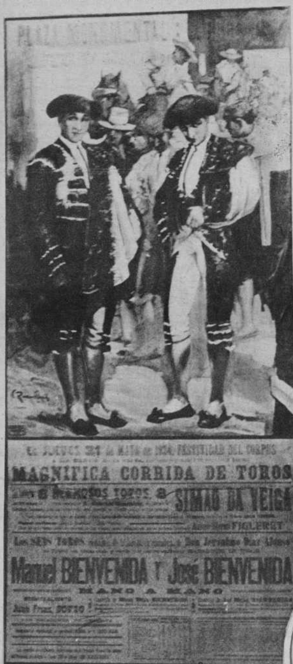
El cartel anunciador