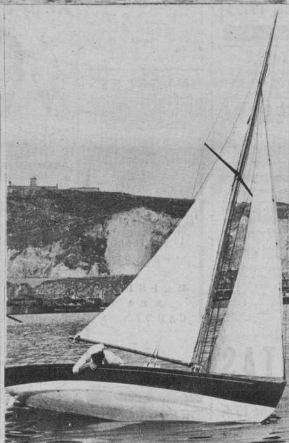
Uno de los balandros, durante la regata.