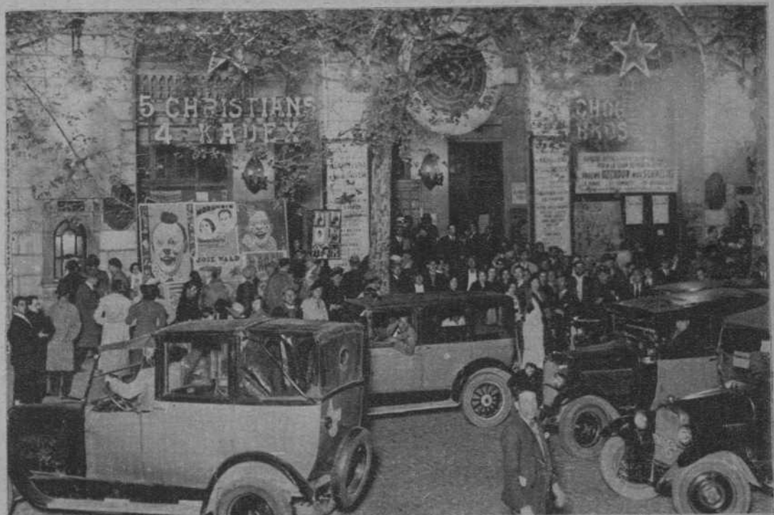
La entrada de las Misses de los distritos de Barcelona en el Teatro Olympia.