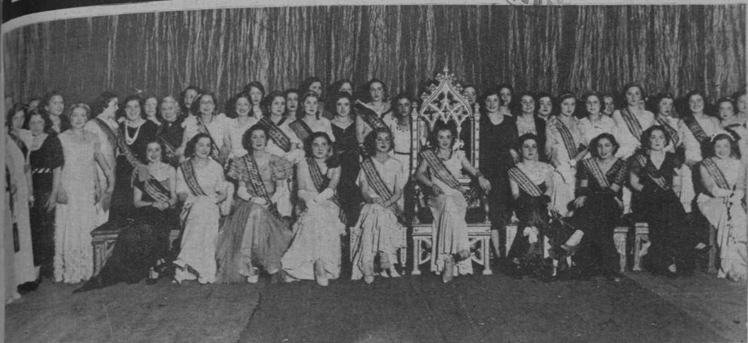
«Miss Barcelona» y las Misses de los distritos de Barcelona, en el Teatro Olympia.