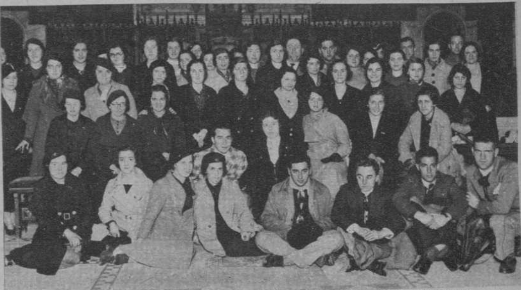
La sección femenina del Orfeón de San Sebastián «Euzko Abesbatza», en la visita al Ayuntamiento.