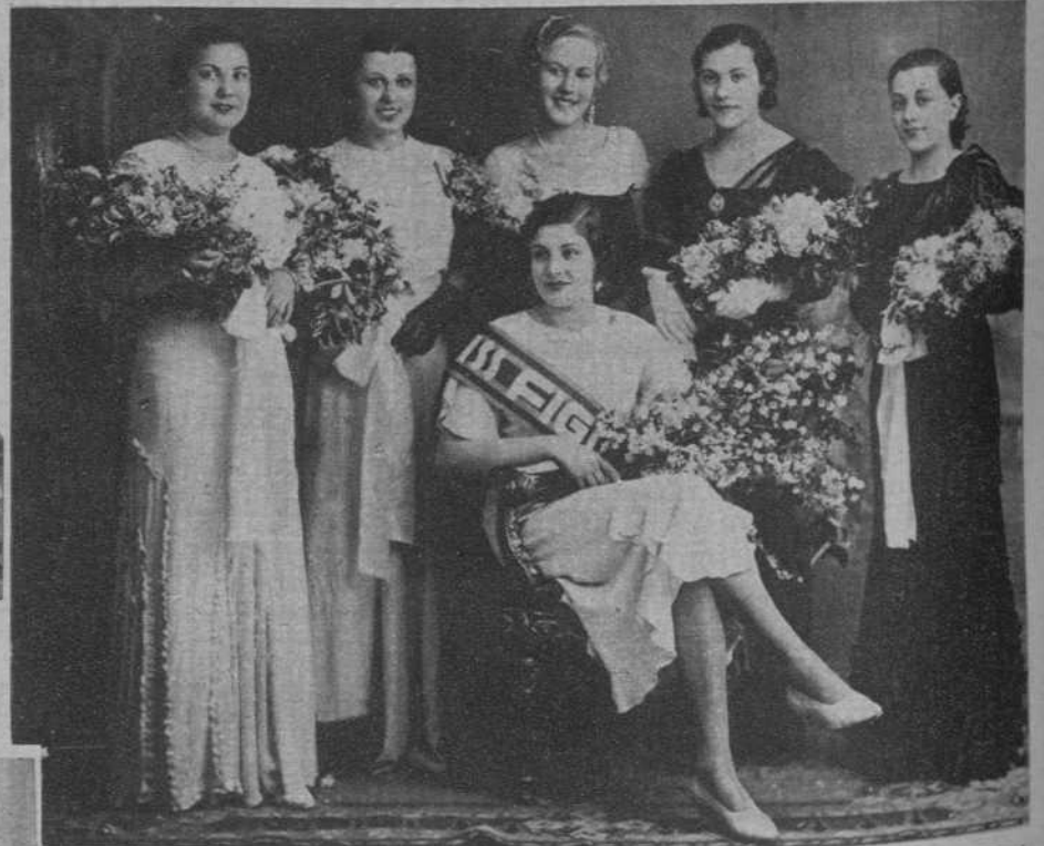
«Miss Figueras», y su Corte de honor