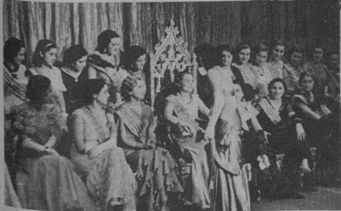
«Miss Cataluña 1933», felicitando a «Miss Barcelona 1934».—(Fot. Badosa)