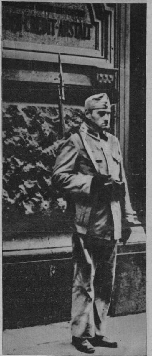
En Viena, un Banco ha quedado convertido en cuartel para los soldados de la policía auxiliar, a consecuencia de la concentración de fuerzas ordenada por el Gobierno para reprimir los disturbios de los nazistas