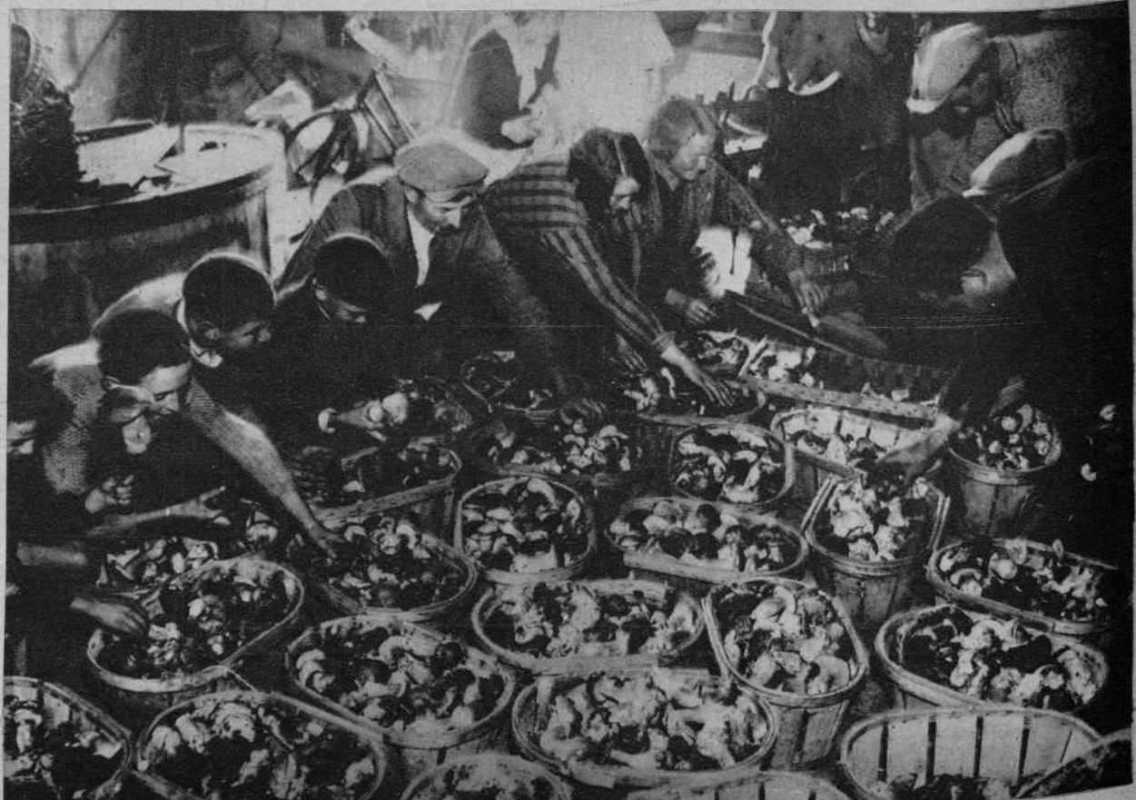
Mercado de Setas, en Paris.