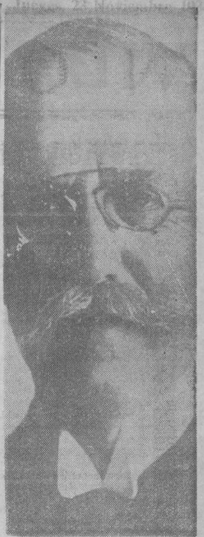
EL DOCTOR SCHULTESS, Presidente de la Confederación Helvética.

Schultess— Los recuerdos de la guerra mundial están todavía demasiado recientes para que un país pueda tomar la responsabilidad de una nueva conflagración, cuyas consecuencias serían terribles. Me doy perfectamente cuenta de que el hecho de haber propuesto a la Cámara federal el voto de un crédito militar que se eleva a más de ochenta millones y destinado a la compra de armas, de municiones y de material es interpretado como una prueba de desconfianza. He de decirle que este proyecto está en estudio desde hace bastante tiempo y no ha provocado su presentación el temor a una guerra. Suiza no ha considerado jamás suficiente la garantía de su neutralidad por las potencias. Tiene la voluntad y el deber de defender por sí misma la independencia y la integridad de su territorio. El Consejero federal del Ejército ratifica las manifestaciones del Presidente. No piensa Suiza—ha dicho— en organizaciones permanentes. A lo que tiende ahora es a reforzar su aviación y a proveer a su infantería de pequeños cañones de campaña, destinados a destruir los nidos de ametralladoras antes de que éstas entren en acción.