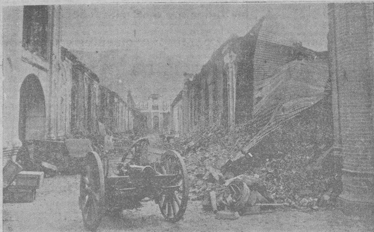
LA VICTORIA QUE ELEVO A NADIR KHAN AL TRONO DE AFGANISTAN NO SE LOGRO SIN GRANDES VIOLENCIAS. DE LAS QUE OFRECE BUENA PRUEBA ESTE GRABADO