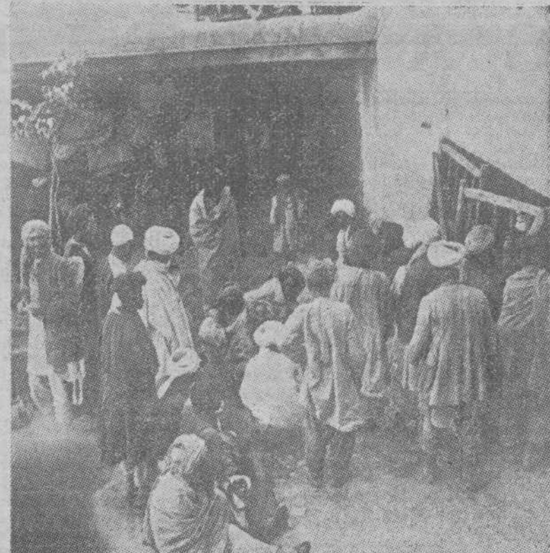
UNA CALLE DE KABUL

gado a los ingleses desde el primer día. No se sabe si cobraba la subvención que venían cobrando los emires afganos desde mediados del siglo pasado a 1915. Pero es lo cierto que cuando alguna partida rebelde pasaba la frontera indostánica, los anglo-indios de los campamentos de Pechawar y Rawalpindi, salían a su encuentro. Y la exterminaban sin compasión. En el Afganistán, como en toda la meseta irania, Rusia e Inglaterra, han reanudado el viejo duelo histórico. Los bolcheviques, transformadores del Turquestán, que están irrigando a costa de esfuerzos formidables, han continuado la obra de expansión de los zares. Lenin y Stalin son herederos coloniales de Alejandro y Nicolás. Como ellos, han tropezado en Siberia con el Japón. Y en el Turquestán con la Gran Bretaña. Y es que la Geografía está por encima de los dogmas políticos y sociales y de las Instituciones. En el Sur de Asia, el leopardo vigila al oso de hoy, como en tiempos del primer Nicolás Romanoff. Y algún día, su combate espantoso estremecerá al mundo. Es el Afganistán una especie de Albania o de Rif, tierras de ferocidades y de anarquías, de conquista imposible. Lo saben de sobra rusos y británicos. Y por ello no piensan en dominarle. Pretenden, sí, unos y otros, influir en ella y cerrarla al contrario. Probablemente, el asesinato de Nadir Khan es un nuevo episodio de esa pugna.