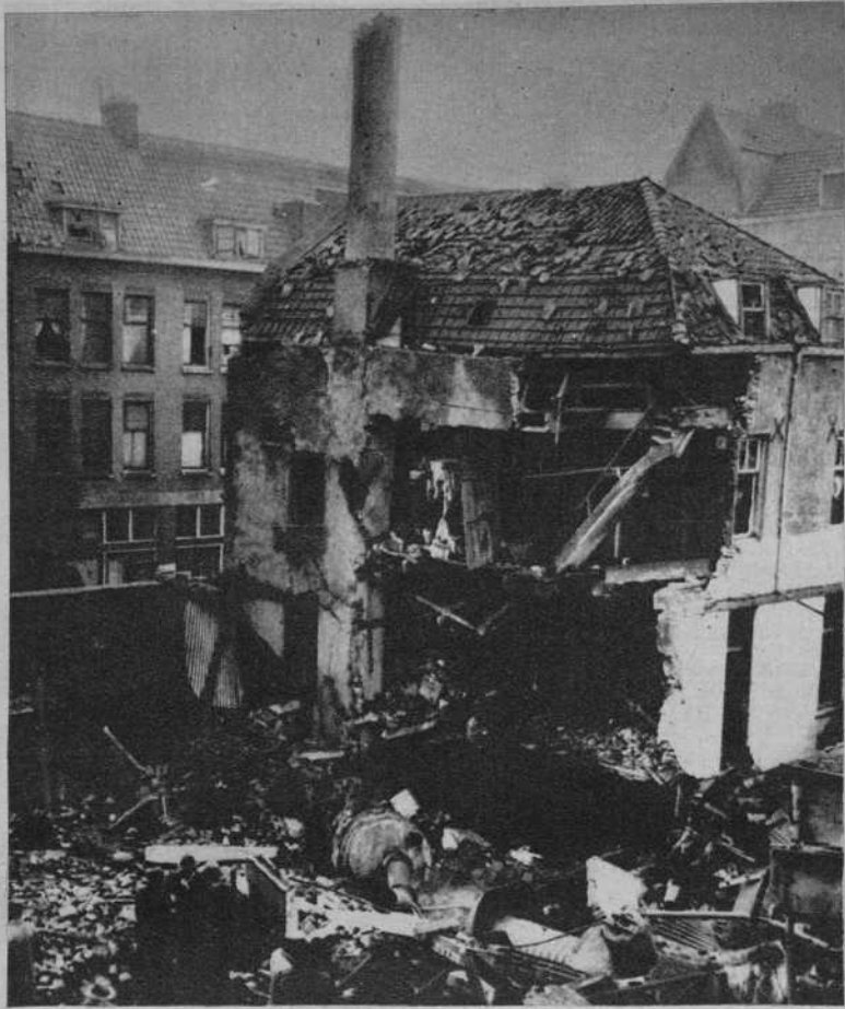
Rotterdam.—La explosión de una caldera en un gran taller de planchado, destruyó una casa