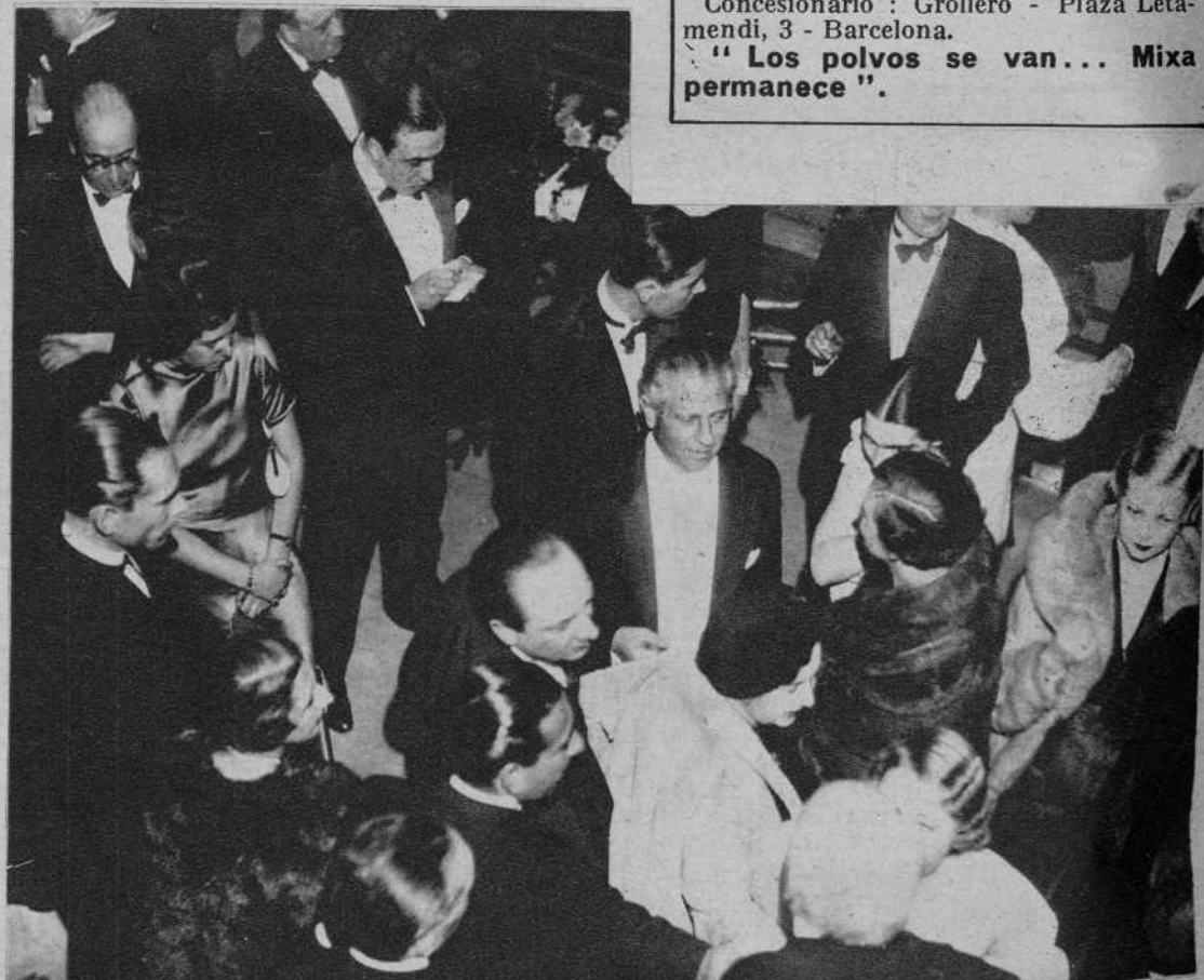
Paris.—La recepción en honor del célebre director de escena alemán, Max Reinhardt