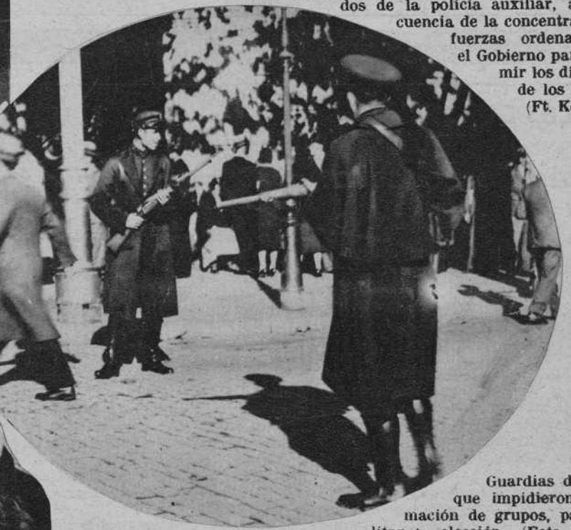
Guardias de Asalto que impidieron la formación de grupos, para facilitar la elección.