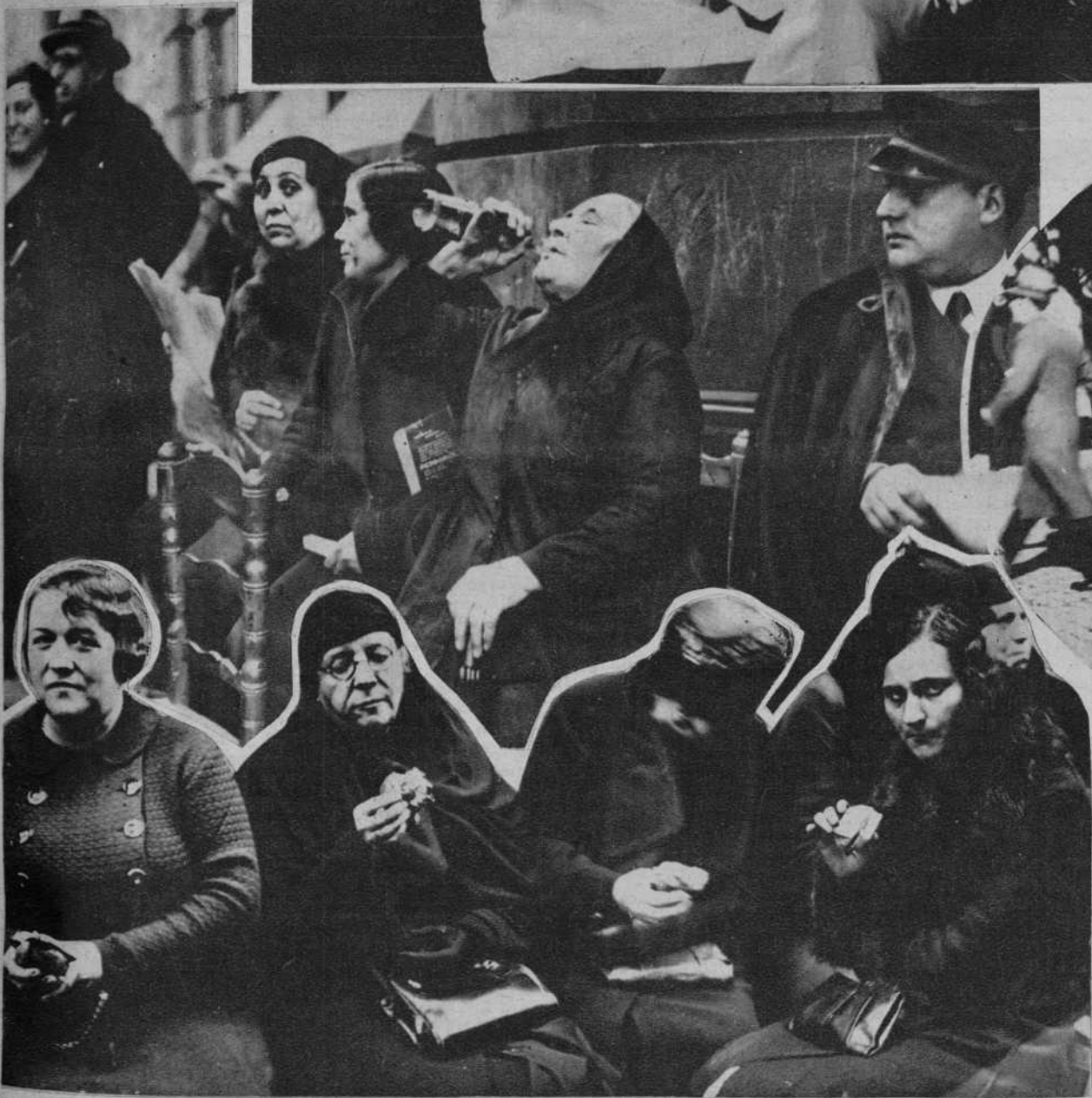
Electores, comiendo sandwiches y pasteles

Apoderados de la Lliga, repartiendo sandwiches y pasteles entre los electores que aguardaban sentados a que les llegara el turno para votar