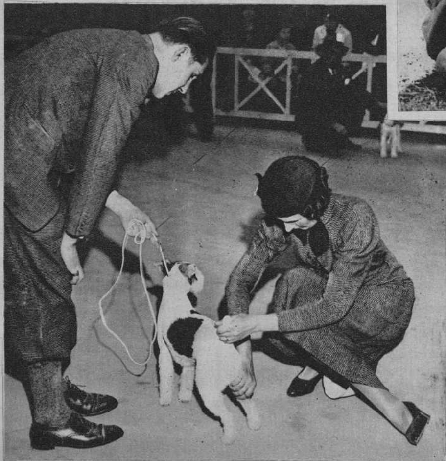
Paris.—El juez árbitro, examinando un fox en la Exposición canina