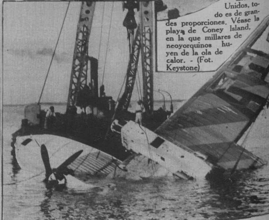
Valencia.—El hidro italiano que amará en la playa de Pinedo, resultando sus ocupantes heridos, entre ellos el general Valle, puesto a flote por una grúa de las Obras del Puerto.