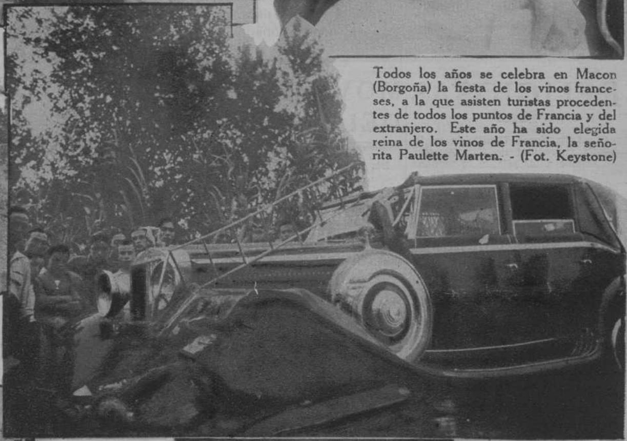
Estado en que quedó el auto del Presidente del Parlamento catalán, Sr. Casanovas, al chocar contra un ómnibus, cerca de Castelló de Ampurias.