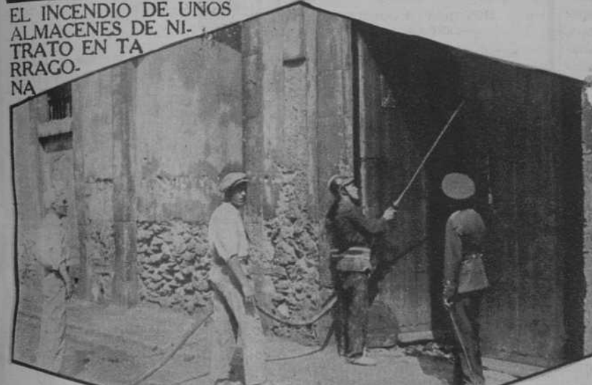
EL INCENDIO DE UNOS ALMACENES DE NITRATO EN TARRAGONA