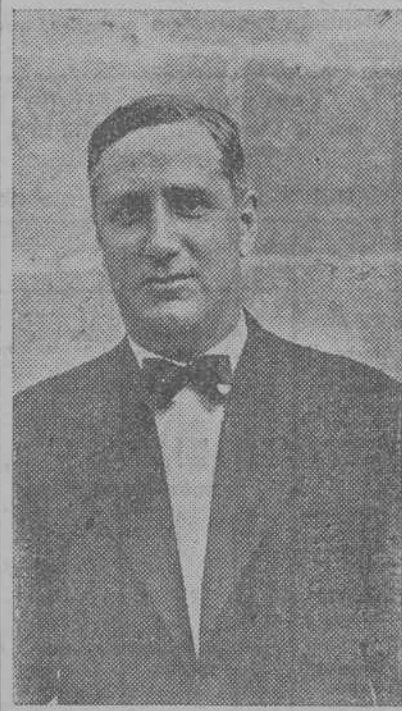
CARLOS PI Y SUÑER

También hemos sacado la impresión de que en este asunto, como di-