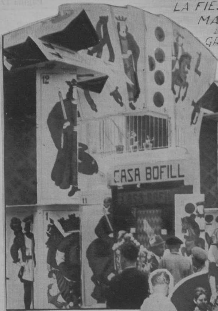
La calle de Vich