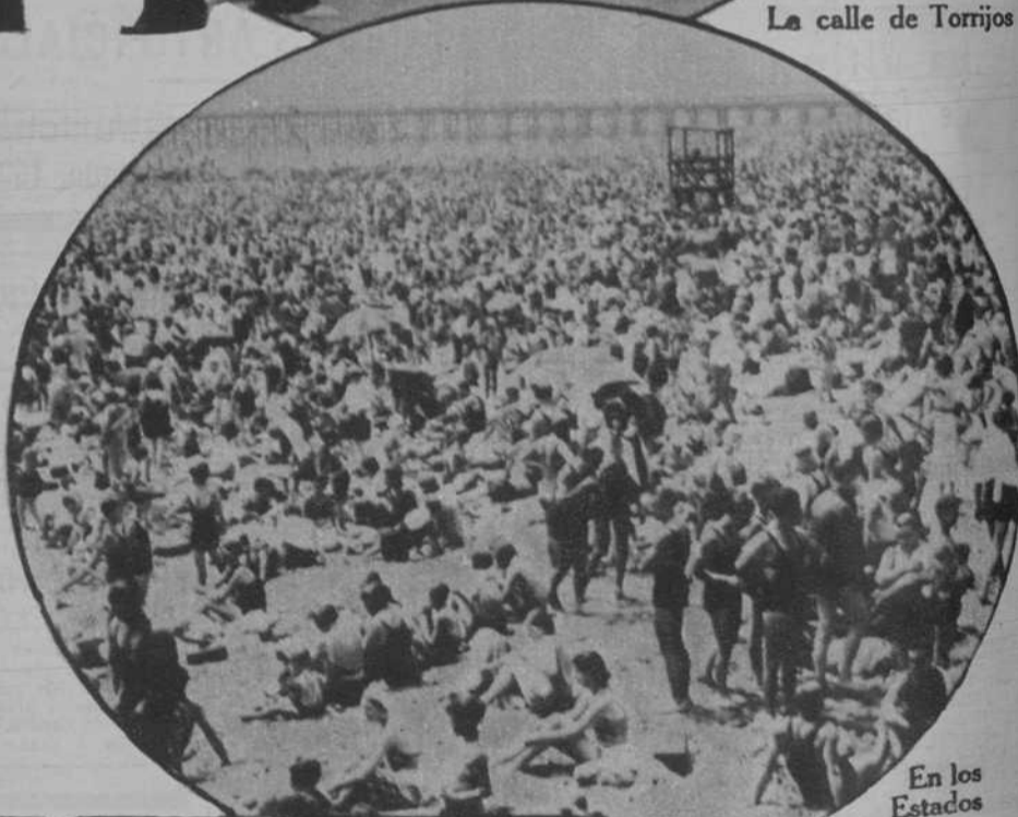
En los Estados Unidos, todo es de grandes proporciones. Véase la playa de Coney Island, en la que millares de neoyorquinos huyen de la ola de calor.