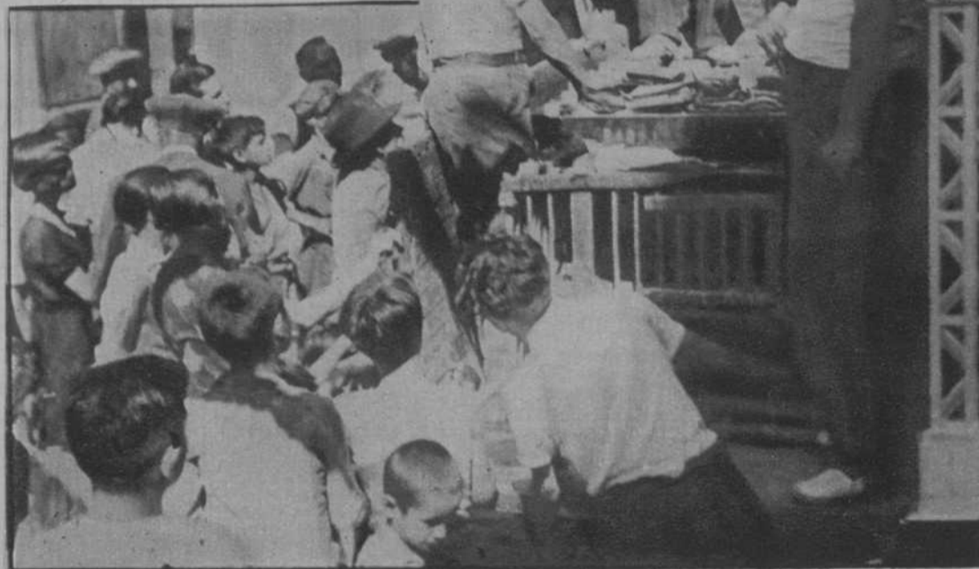
Entrega de bonos a los pobres.