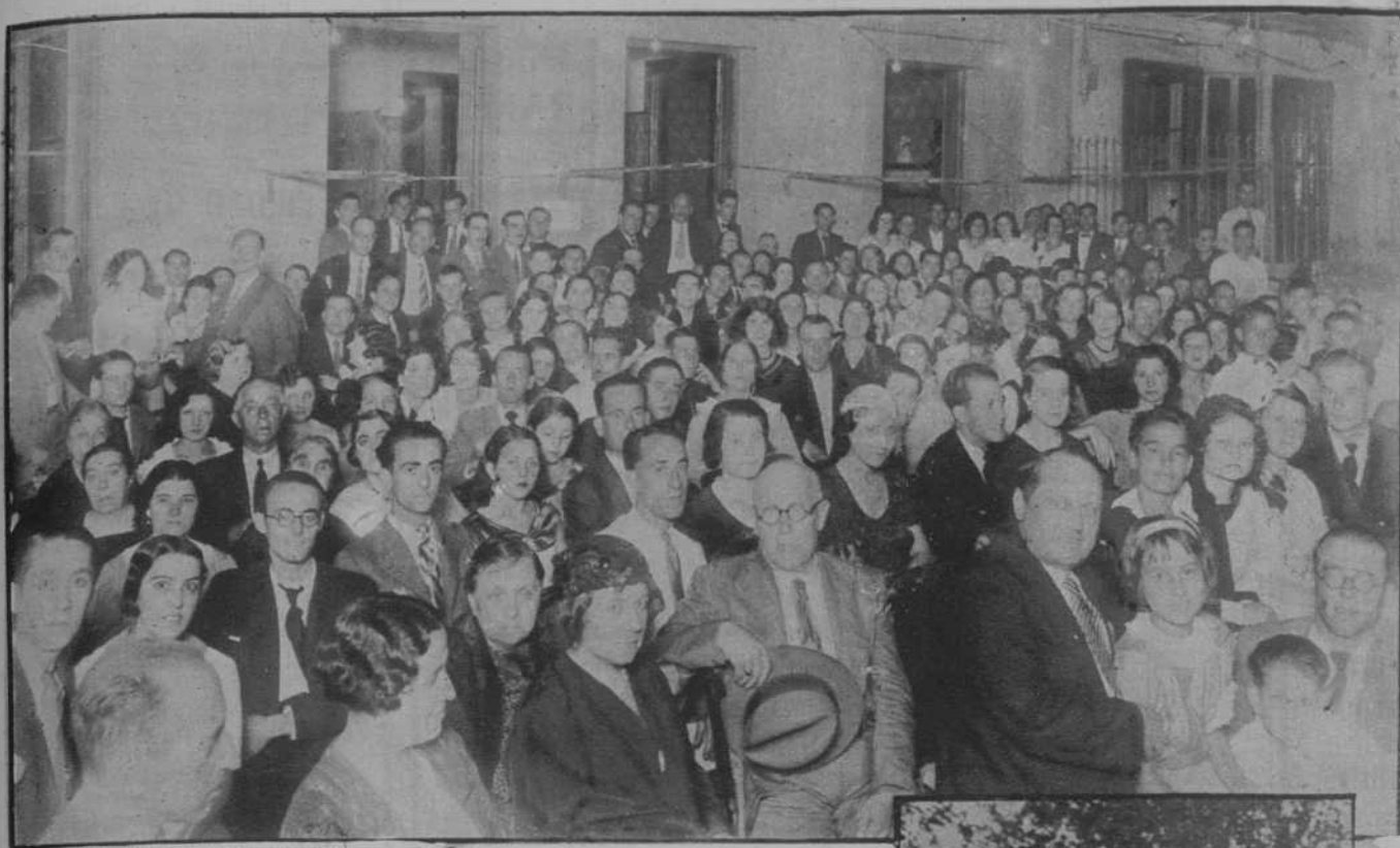
En la terraza del Centro Regional de Murcia y Albacete, se ha celebrado un festival benéfico.— (Ft. Merletti)

Barcelona, miércoles 16 de Agosto de 1933