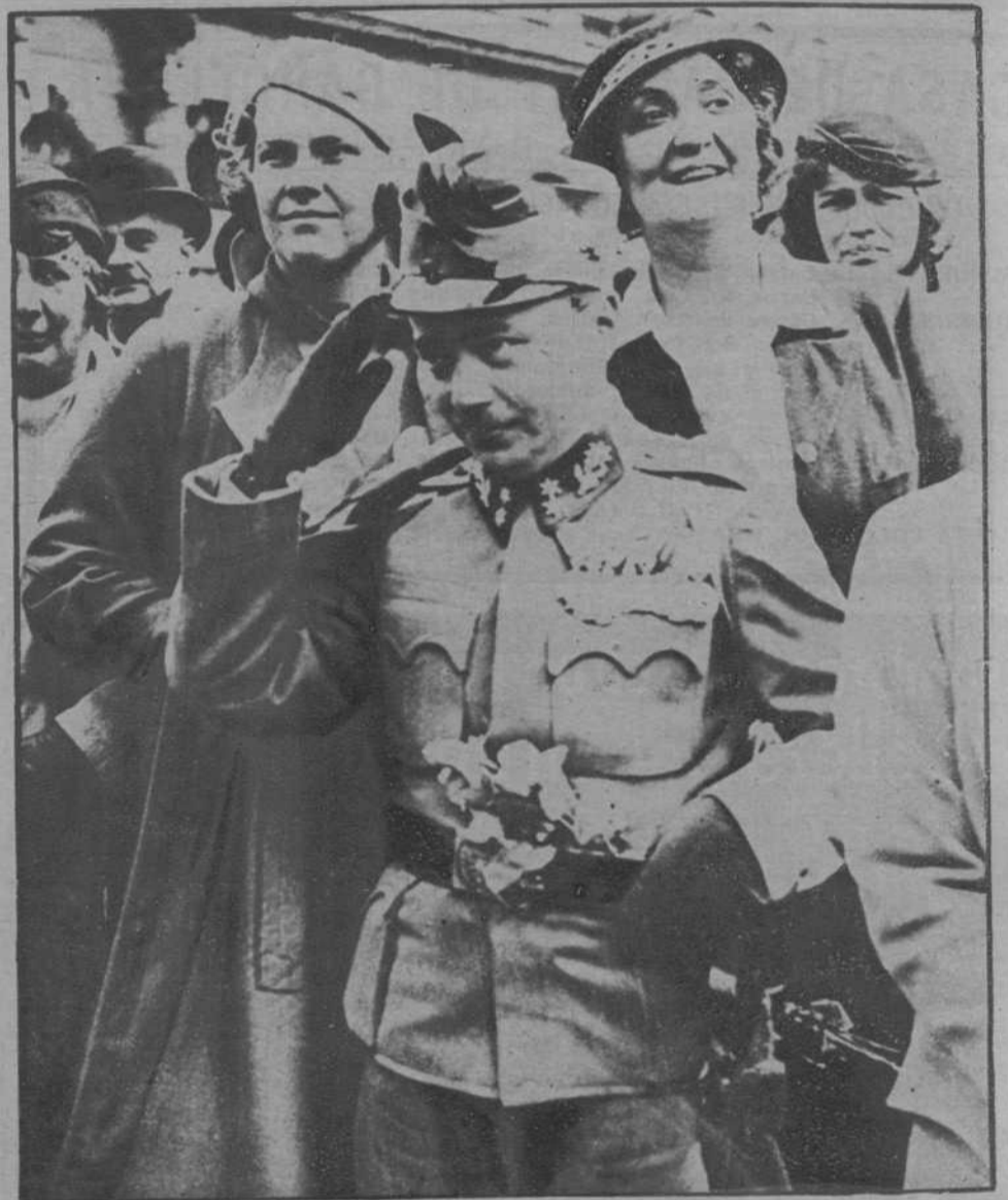
Viena.—El canciller Dollfus, de uniforme, presenciando el desfile de tropas con motivo de la manifestación conmemorativa de la liberación de Viena y del levantamiento del asedio de Viena por los turcos hace doscientos cincuenta años.