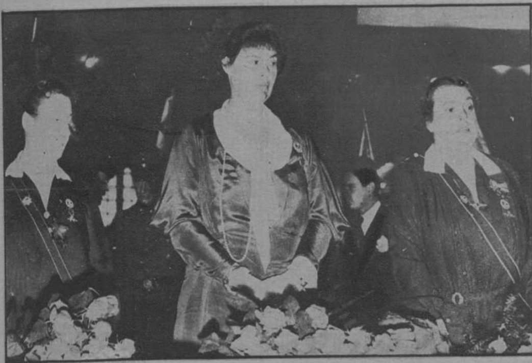
La princesa Cecilia, presidiendo la reunión en el Sportpalast