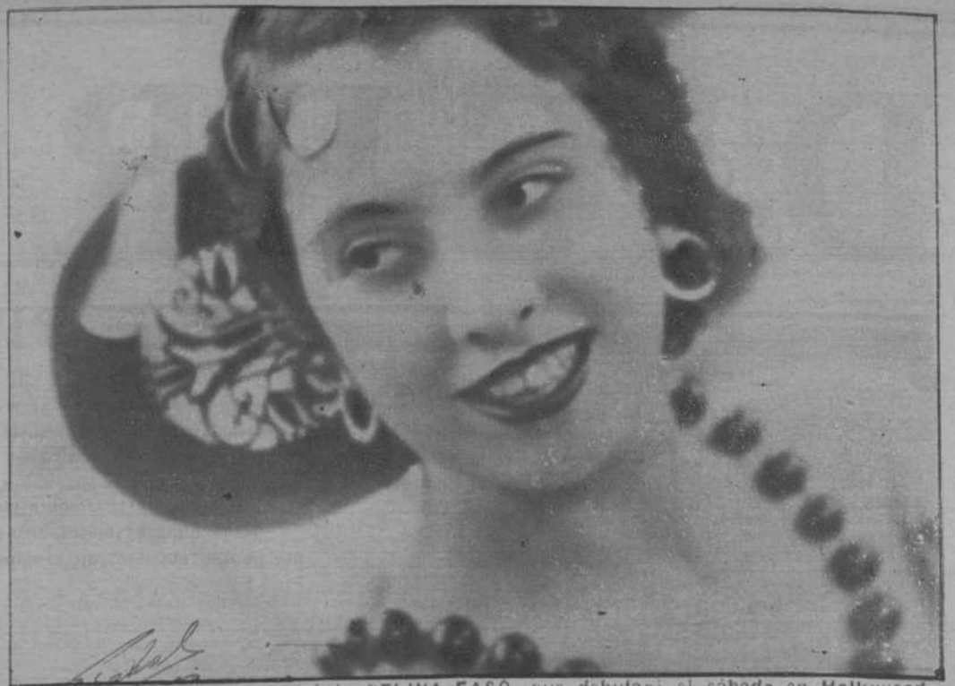
La gran vedette española CELINA EASO, que debutará el sábado en Hollywood