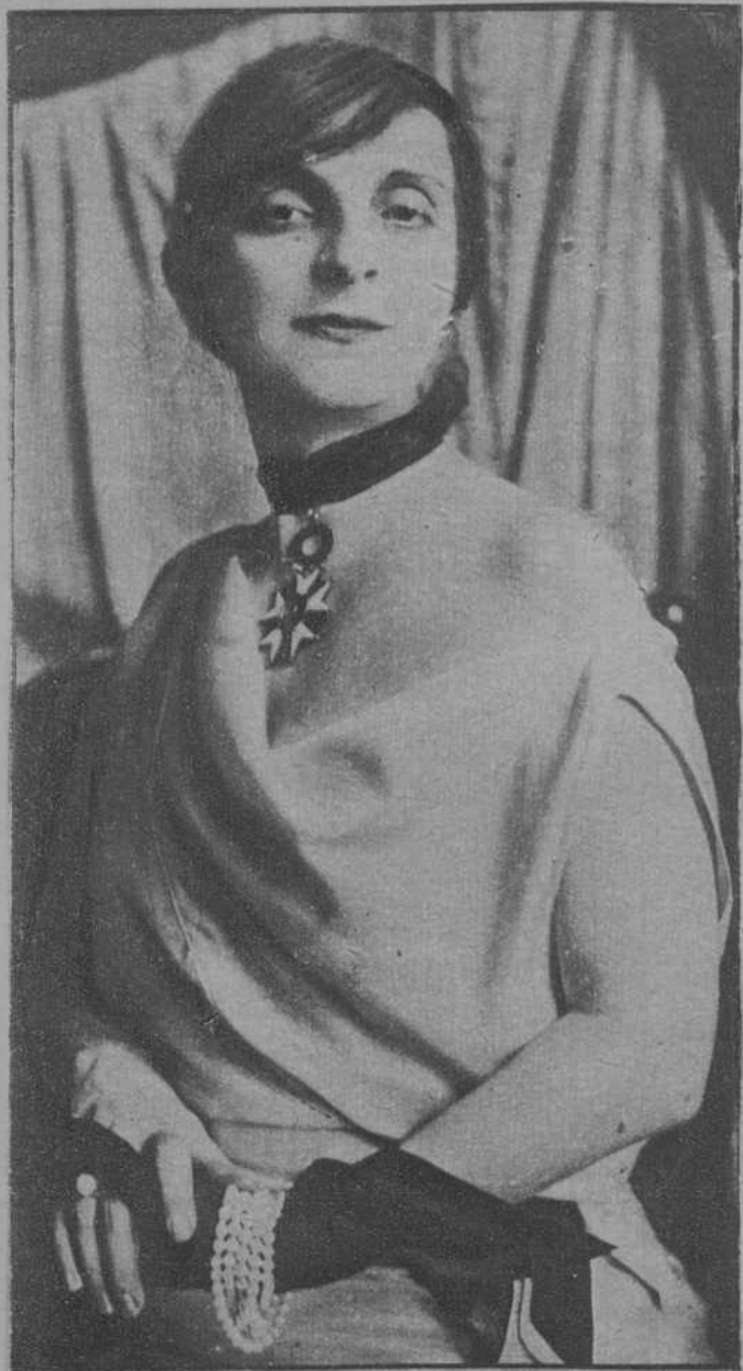
El retrato más reciente de la condesa Ana de Noailles, últimamente fallecida en París.