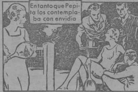
Entantoque Pepita los contemplaba con envidia