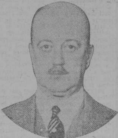
El vicepresidente de la República Argentina don Julio A. Roca

Grato es, para los catalanes, al presentar al vicepresidente argentino el homenaje de sus simpatías hacia él y hacia su tierra, recordar que fué de Cataluña de donde salieron, a fines del siglo XVIII, los fundadores, allá en el norte tucumano, de la bella estirpe que aquél representa tan bellamente ante propios y extraños.