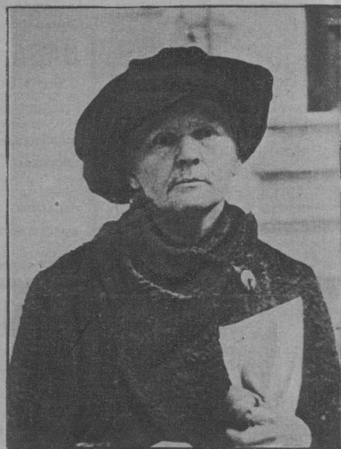
Mme. Curie, cuya labor científica la ha hecho acreedora al agradecimiento de la Humanidad.