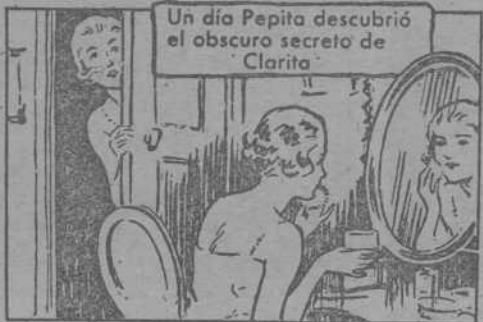
Un día Pepita descubrió el obscuro secreto de Clarita