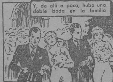
Y, de allí a poco, hubo una doble boda en la familia