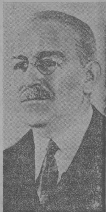
El Presidente de la Argentina general Agustín G. Justo.

Buenos Aires, 4. — Al salir el Presidente Justo de su residencia para subir al coche que le esperaba a la puerta se le acercó un individuo. Un oficial de la escolta del Presidente le hizo varios disparos que le hirieron de gravedad. Resultó ser un pacífico ciudadano que se aproximaba al Presidente Justo para hacerle entrega de un mensaje. — Fabra.