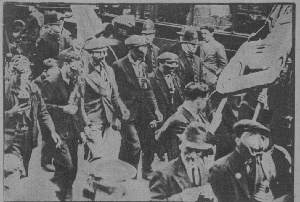
Londres.—Los manifestantes, en Hyde Park, provistos de caretas para condenar la guerra química.