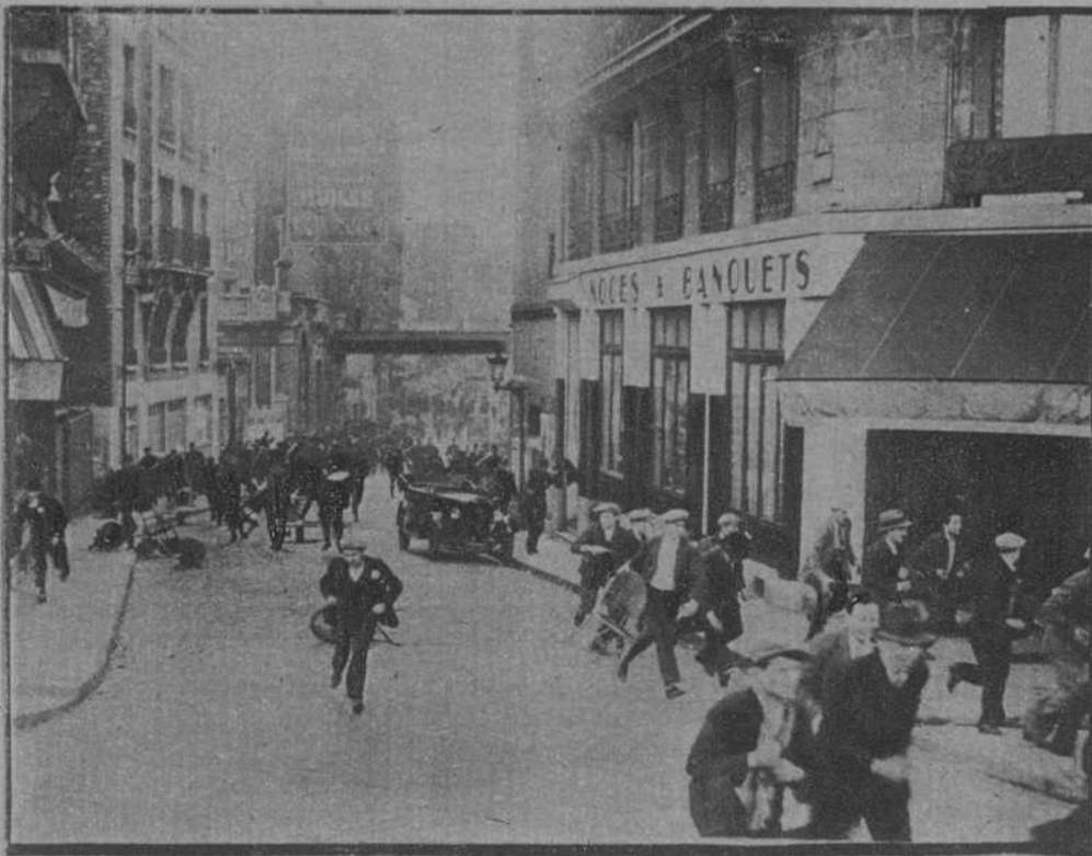
Paris.—Los manifestantes, perseguidos por los agentes cuando intentaban entrar en la ciudad

En conjunto, el Primero de Mayo de este año, transcurrió sin que se registraran, como ha ocurrido en otros aniversarios, graves incidentes y colisiones sangrientas entre los obreros y la fuerza pública. En París, grupos de comunistas que intentaron manifestarse en la ciudad, fueron disueltos por los agentes de policía, y con este motivo hubo apedreamientos, cargas, carreras, ratura de mesas y vajilla de algunos cafés, y docenas de detenciones. Afortunadamente, no pasó más. En Londres, los comunistas aprovecharon la ocasión para manifestarse contra la guerra, expresando su protesta con pancartas y caretas contra los gases asfixiantes