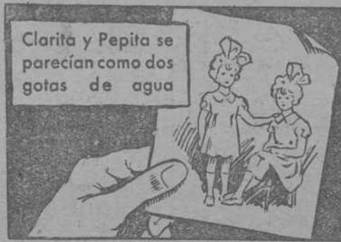
Clarita y Pepita se parecían como dos gotas de agua

Pisos por alquilar, propios para despachos u oficinas, 9 Plaza de Cataluña, 9