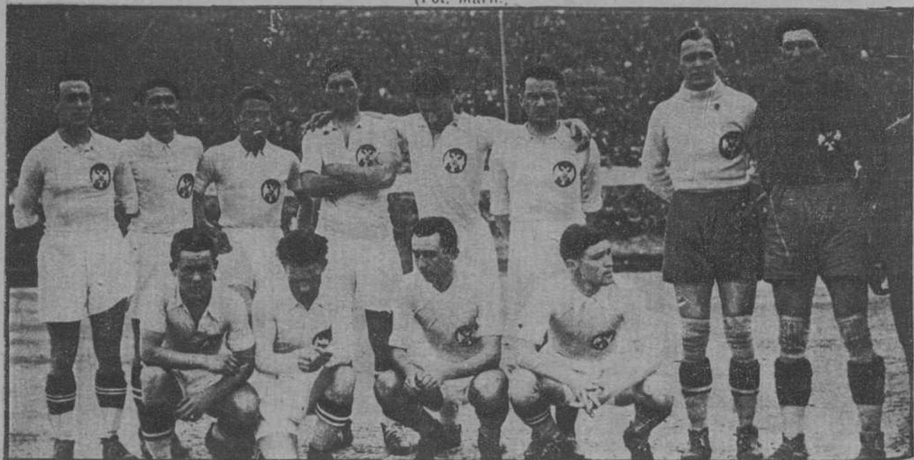
El equipo de fútbol de Yugoslavia, que ha empatado a un goal, en Belgrado, con el de España.