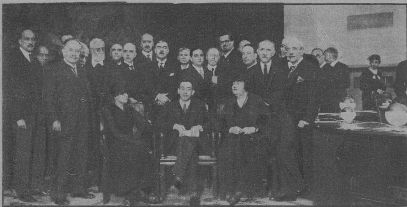
Madrid.—Presidida por Mme. Curie, y con asistencia del ministro de Estado y destacadas personalidades de las artes y de las letras, se ha celebrado la reunión del Comité permanente de la S. de N.