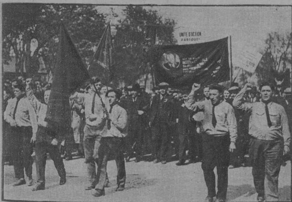
Paris.—Un grupo de manifestantes comunistas, entrando en el bosque de Vincennes