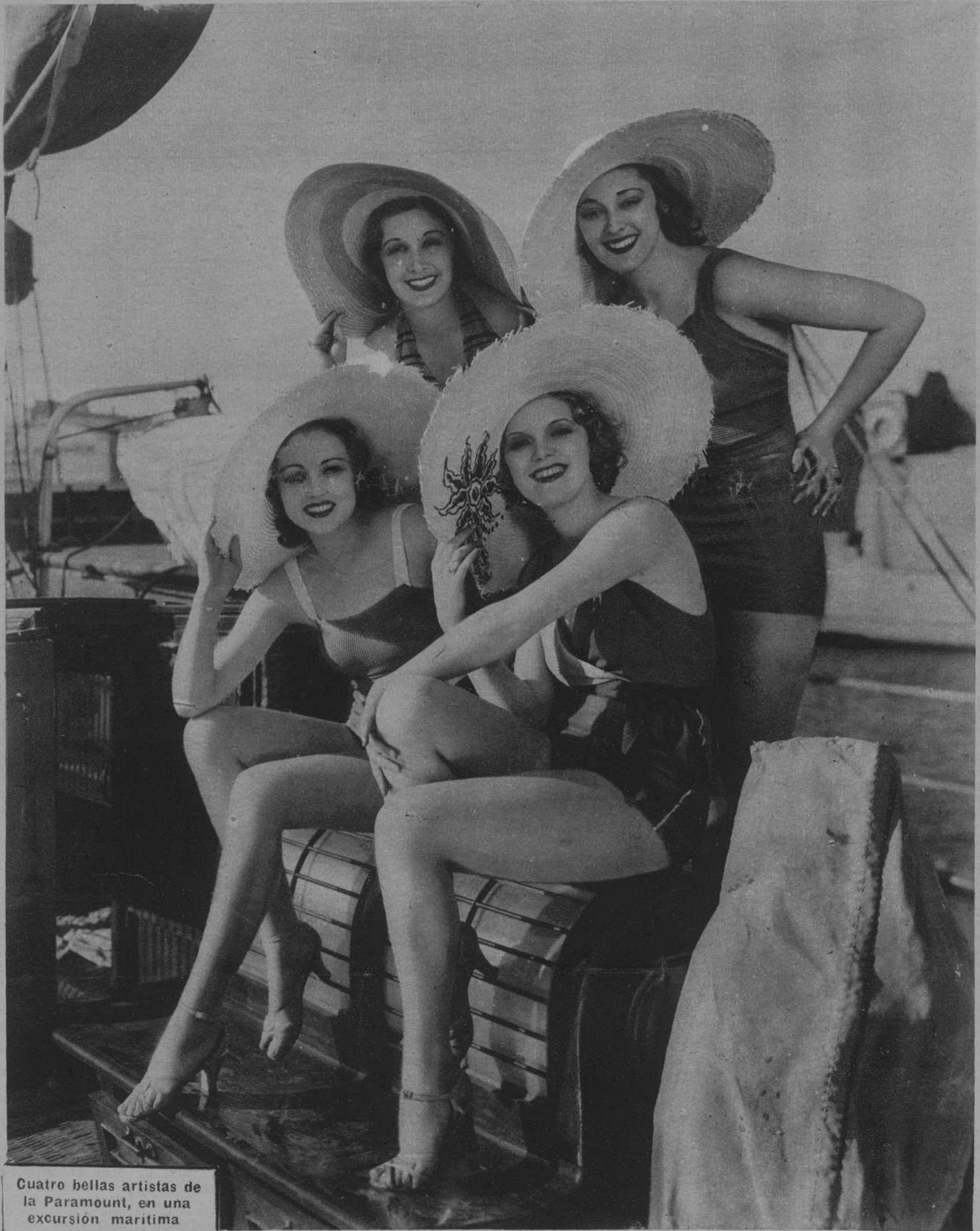
Cuatro bellas artistas de la Paramount, en una excursión marítima