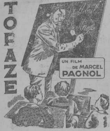
UN FILM DE MARCEL PAGNOL