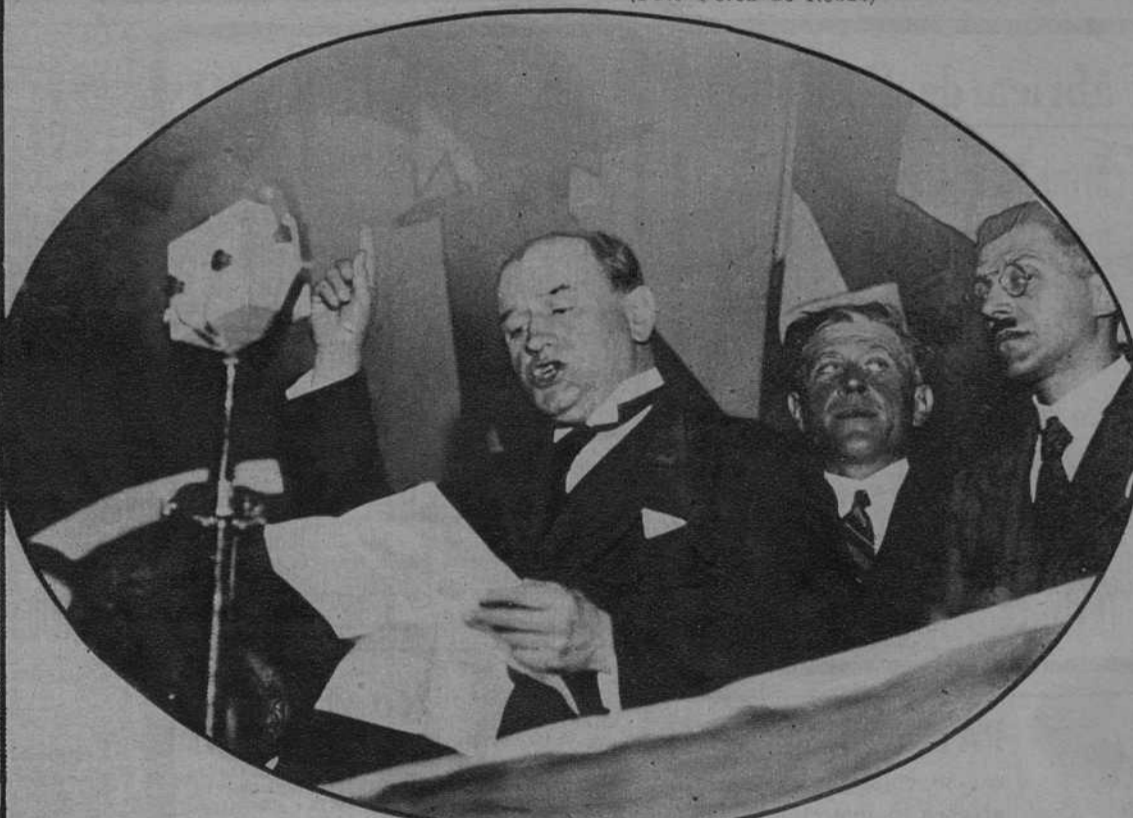
El jefe del Gobierno francés M. Daladier, pronunciando, en Orange, un discurso patriótico, en el que fijó la actuación parlamentaria de los republicanos franceses.