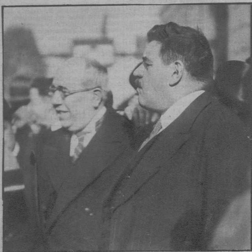
Mr. Herriot, en el momento de su llegada a Madrid, saluda a España ante un micrófono. Junto a Mr. Herriot, se encuentra el señor Azaña