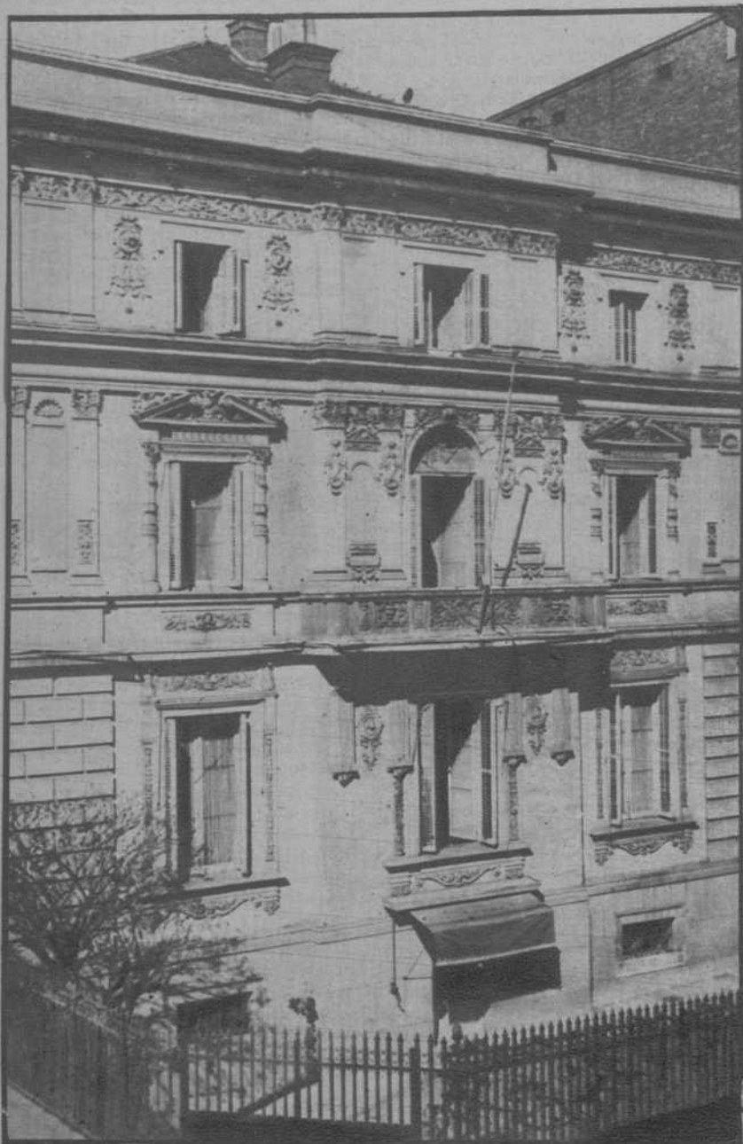
Madrid.—La Embajada de Francia, donde se hospeda Mr. Herriot