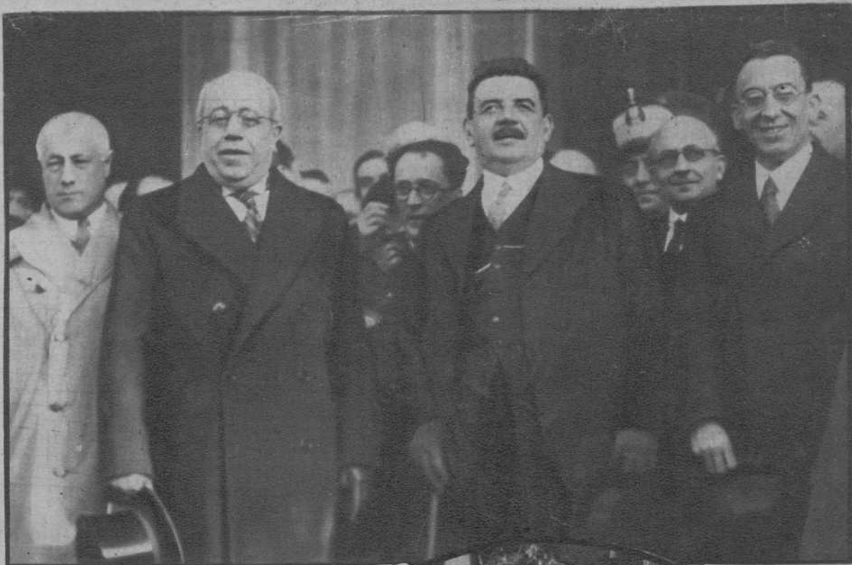
Mr. Herriot, al salir de la estación del Norte, acompañado del jefe del Gobierno, señor Azaña; del ministro de Estado, señor Zulueta, y del embajador de España en París, señor Madariaga