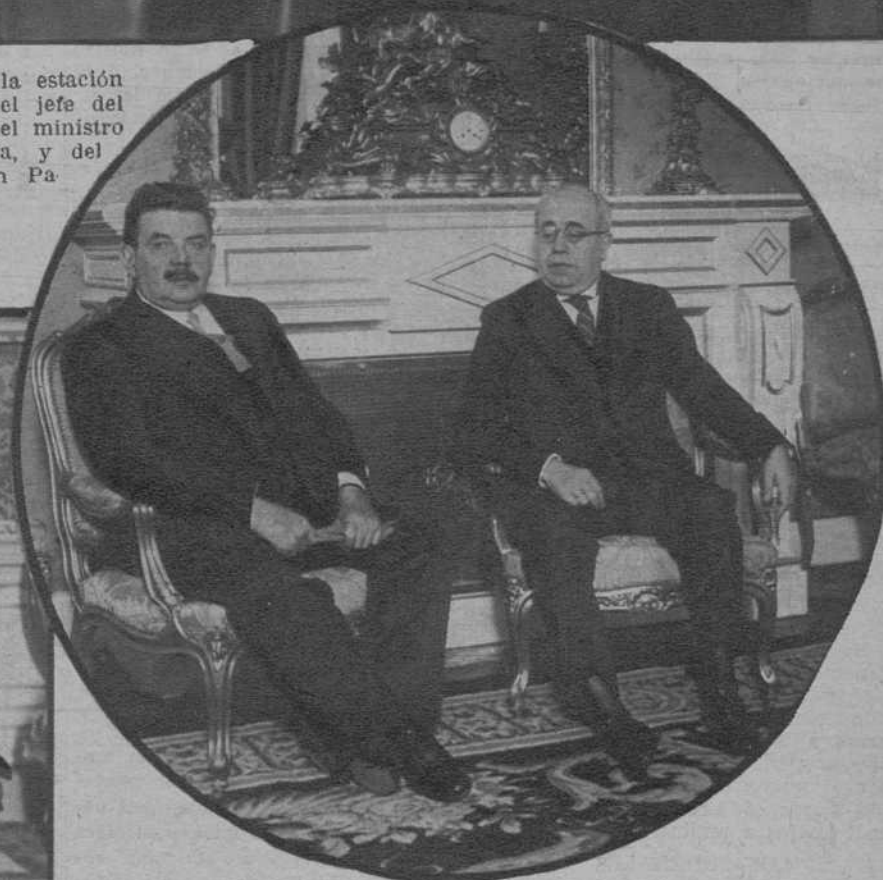
Mr. Herriot, durante su entrevista con el señor Azaña, en la Presidencia del Consejo