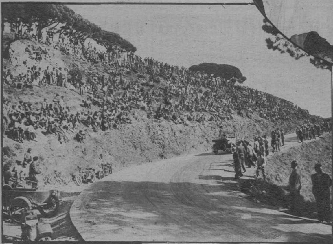
Barcelona.—De la IV Carrera de motos en Cuesta de Vallvidrera. Aspecto que ofrecía la montaña de Vallvidrera durante la carrera