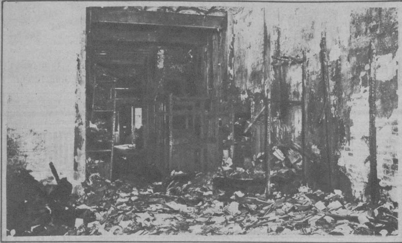
Un aspecto del interior de la fábrica de juguetes establecida en la calle de Florida-blanca, cuyo edificio fué totalmente destruido por un incendio.