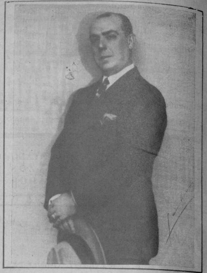
El notabilísimo primer actor cómico, Valeriano Ruiz-París, que celebra mañana, en el Teatro Novedades, su función de honor y beneficio