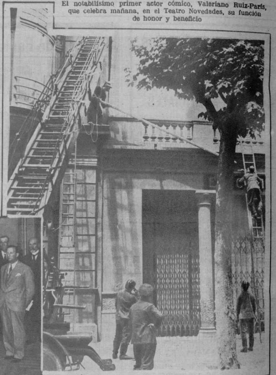
Una pared de un edificio de la calle de Valencia, amenazaba venirse abajo. Los bomberos, colocando puntales, para evtar desgracias.