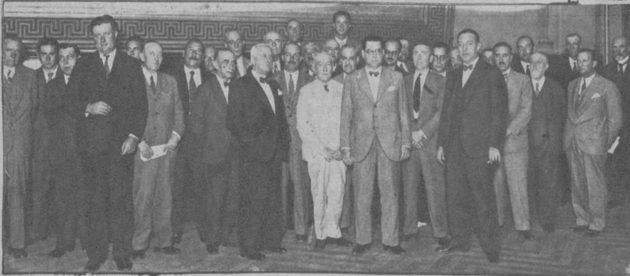
En el Instituto Agrícola Catalán de San Isidro.—Reunión a la que asistieron el Consejo directivo, la Junta de Gobierno, los ex presidentes y delegados de los partidos judiciales, celebrada para fijar las normas a seguir ante el conflicto de los aparceros