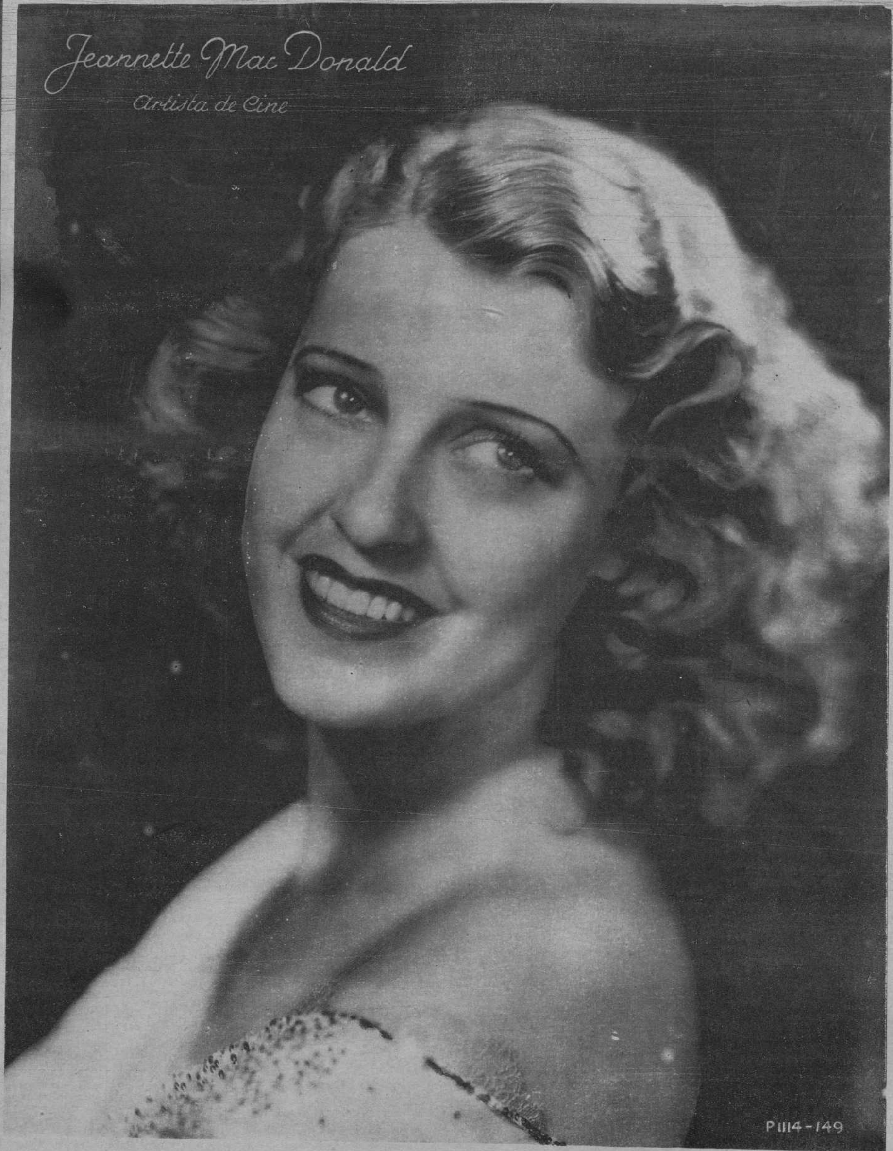
Jeannette Mac Donald Artista de Cine