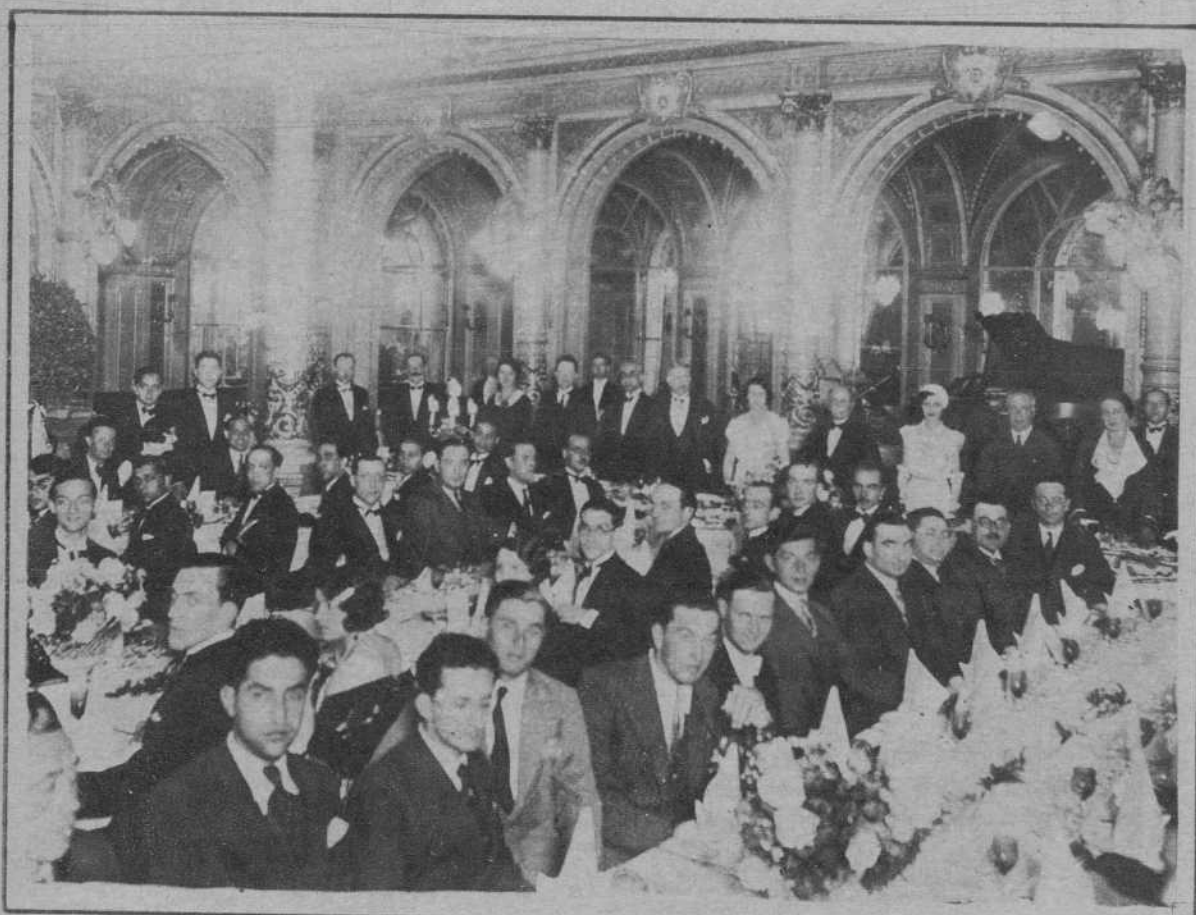
Banquete, celebrado en el hotel Oriente, con que fueron obsequiados anteanoche los profesores y estudiantes del Instituto de Química y Electricidad de Toulouse