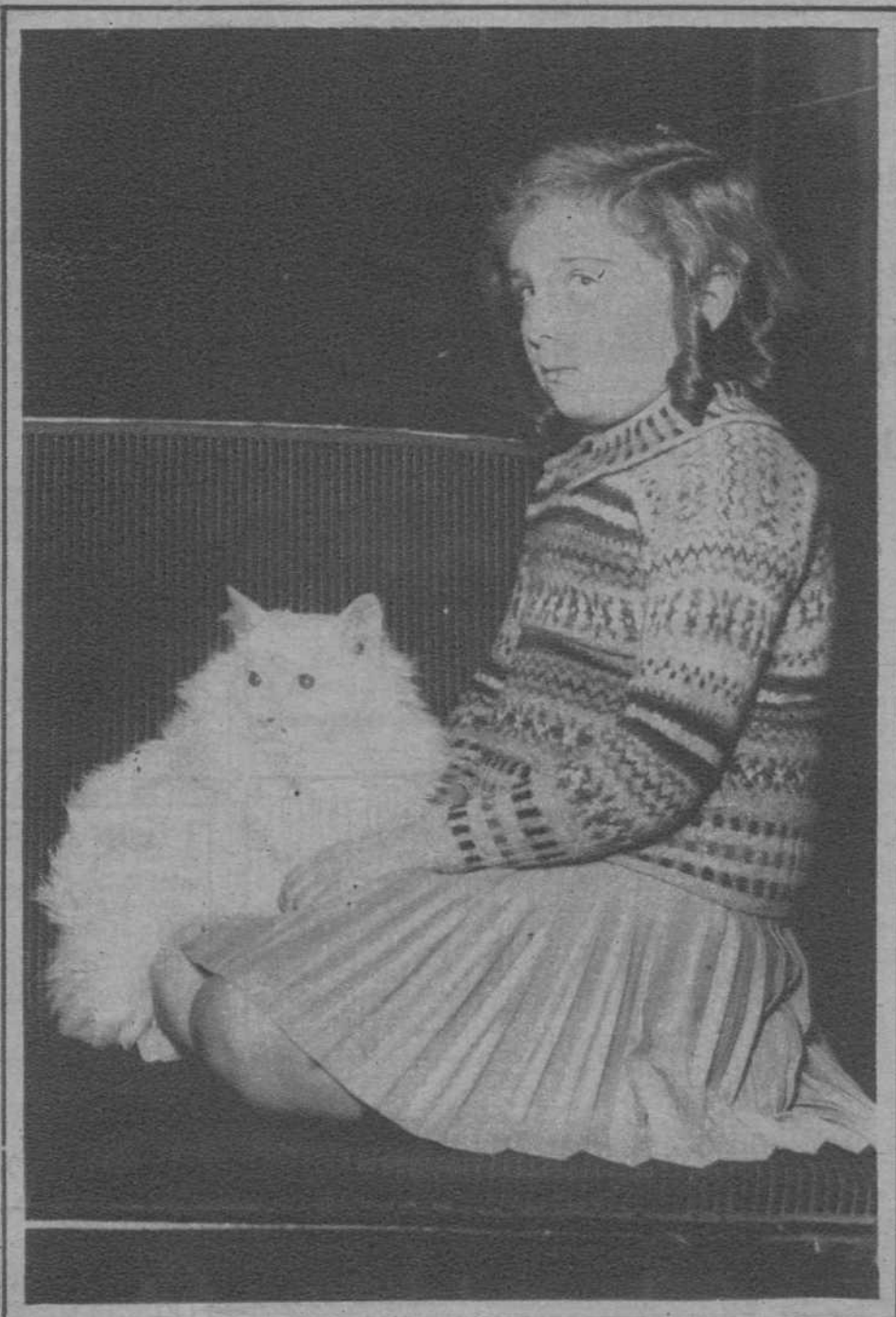
He aquí, acompañado de su amita, el precioso gato blanco que ha obtenido el primer premio en la Exposición Felina de París.—El importante minino, es de raza persa