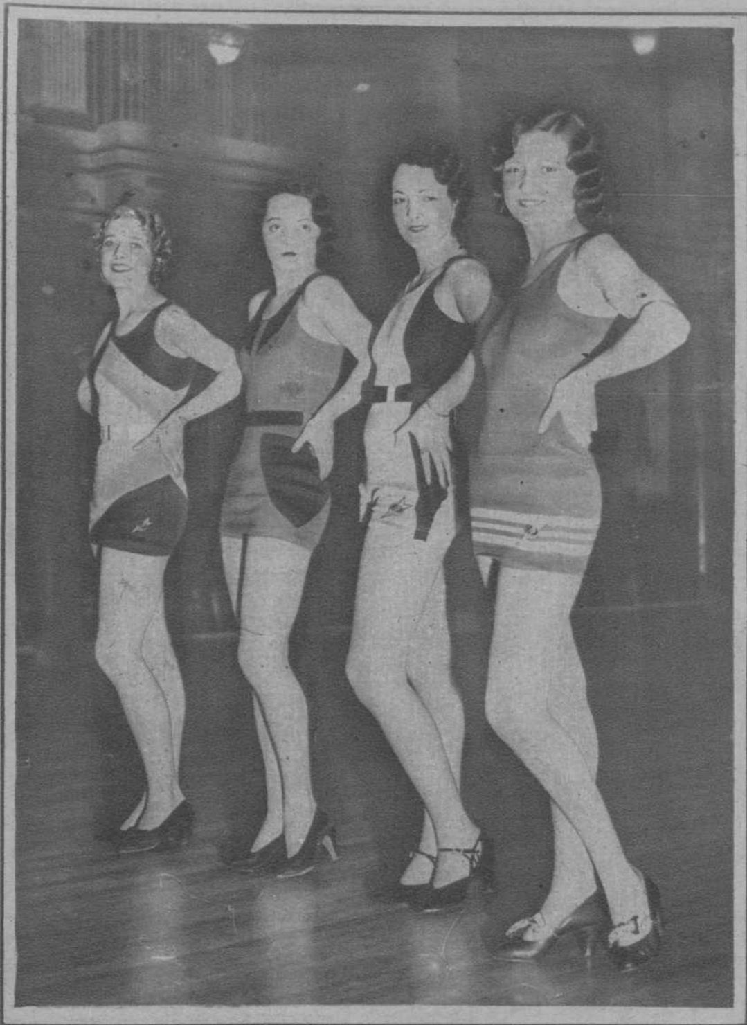
Para el Concurso Internacional de Belleza.—Entre estas cuatro señoritas—que resultaron «finalistas»—, eligió un honorable Jurado londinense, la que ha de ostentar el título de «Miss Gran Bretaña 1932». Y resultó designada la primera de la izquierda; que por cierto es «una tontería» de «girl»... — (Fot. Consorcio)