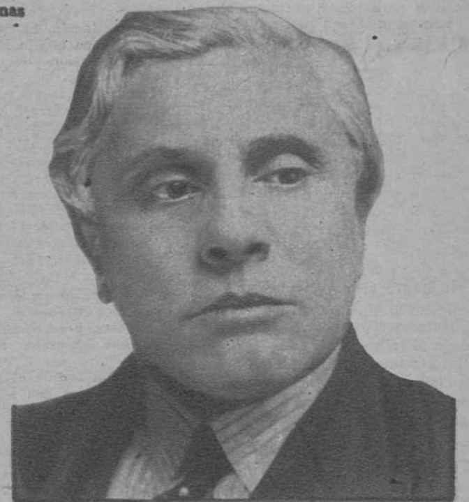
El señor Boncour, que presidirá el Consejo de la Sociedad de Naciones.