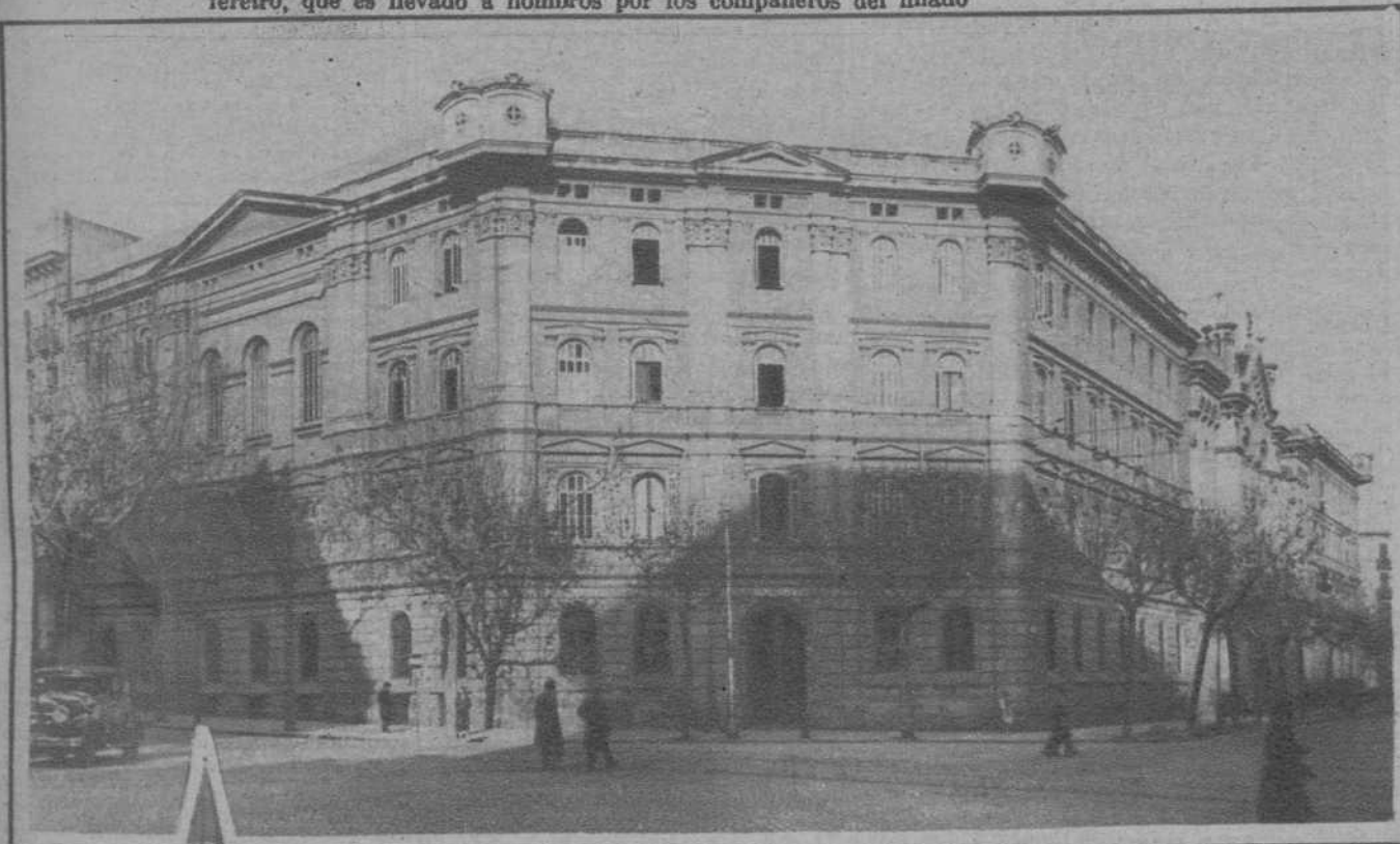
DE LA DISOLUCION DE LA COMPANIA DE JESUS.—(Fots. Merletti) El colegio de la calle de Caspe