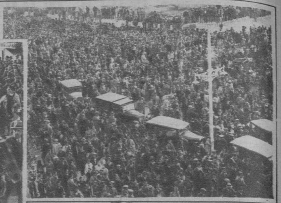
El Presidente de la República, acaba de llegar a la dos veces ilustre ciudad de Alicante. El automóvil presidencial y los del séquito se abren paso difícilmente entre el gentío, que no cesa de aclamar al primer magistrado de la nación