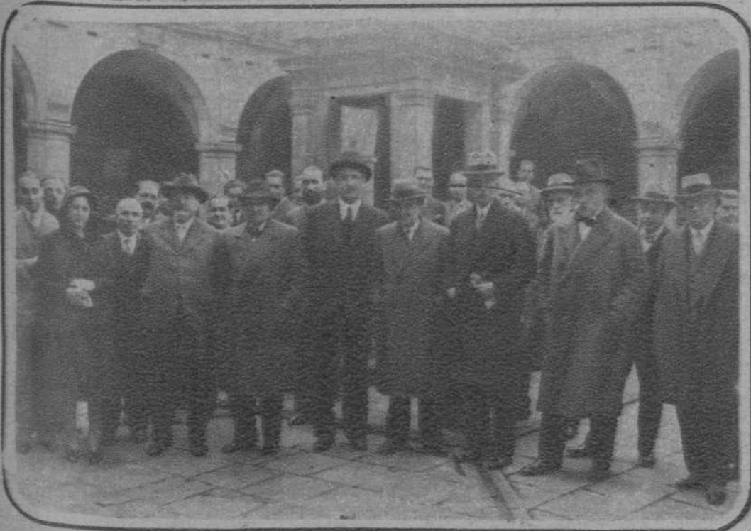
En la «Casa de Convalecencia» del antiguo Hospital de la Santa Cruz.—El Presidente de la Generalidad, don Francisco Maciá, rodeado de los catedráticos catalanes, después del acto inaugural de la «Sociedad Catalana de Ciencias Químicas y Matemáticas», del «Instituto de Estudios Catalanes».