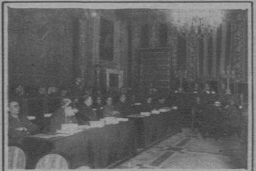
Un momento de la Asamblea celebrada por la Generalidad de Cataluña, en la noche del sábado al domingo.