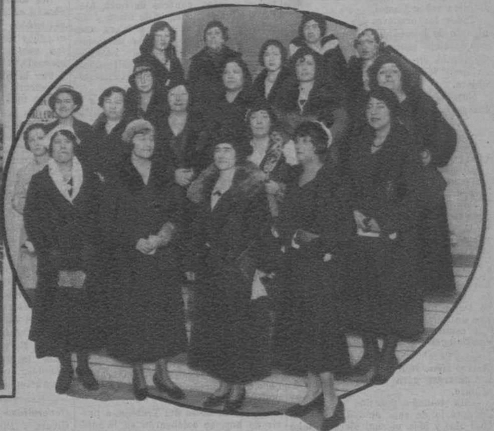
La diputada de las Constituyentes, señorita Clara Campoamor (x), y demás oradoras que tomaron parte en el mitin a favor de la paz universal, celebrado el domingo en el Palacio de Proyecciones.