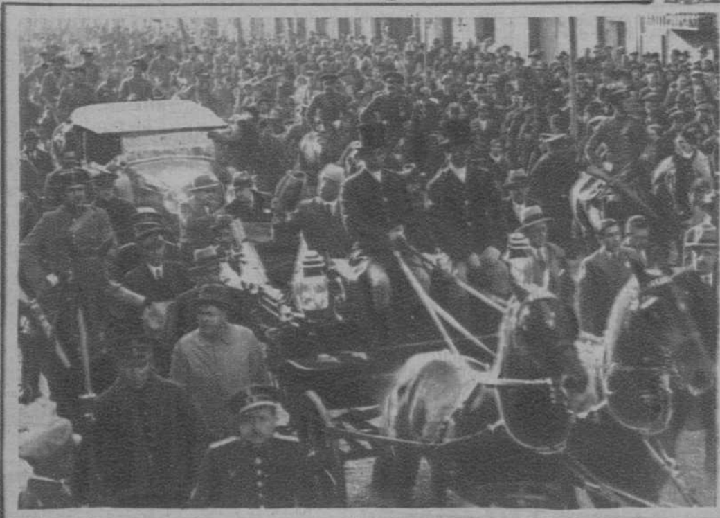
El Sr. Alcalá Zamora corresponde, sombrero en mano, a los vítores de la muchedumbre