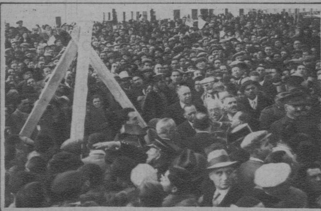
En Elda, el pueblo rodea y aclama al Presidente, durante el acto de colocación de la primera piedra del monumento a Castelar.

VALENCIA. — EL PARTIDO DE FÚTBOL «VALENCIA»-BARCELONA, JUGADO EL DOMINGO, CON RESULTADO DE EMPATE A CERO