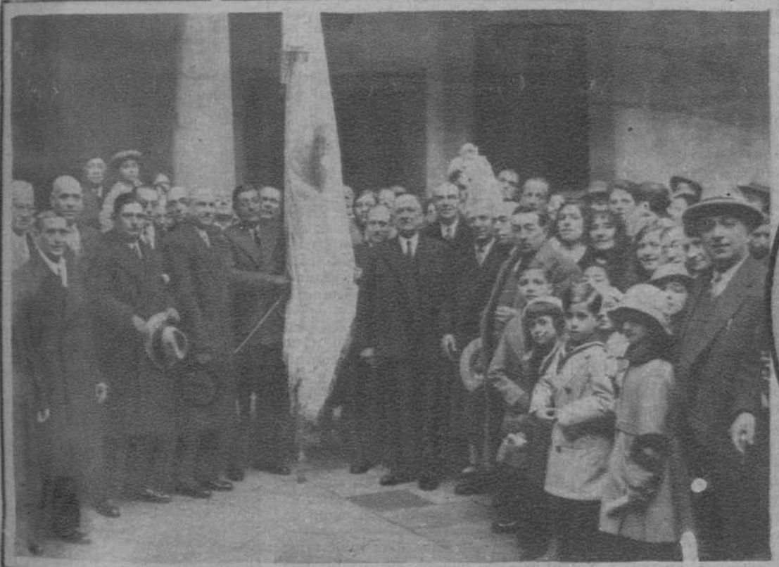
De la fiesta de San Antón.—La «Agrupación de Cocheros de San Antonio Abad», en la Casa de Caridad, después de la función religiosa con que solemnizó la festividad de su Santo Patrón.