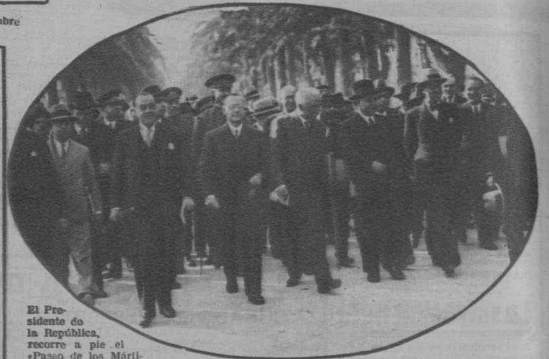
El Presidente de la República, recorre a pie el «Paseo de los Mártires», y las principales calles de la población