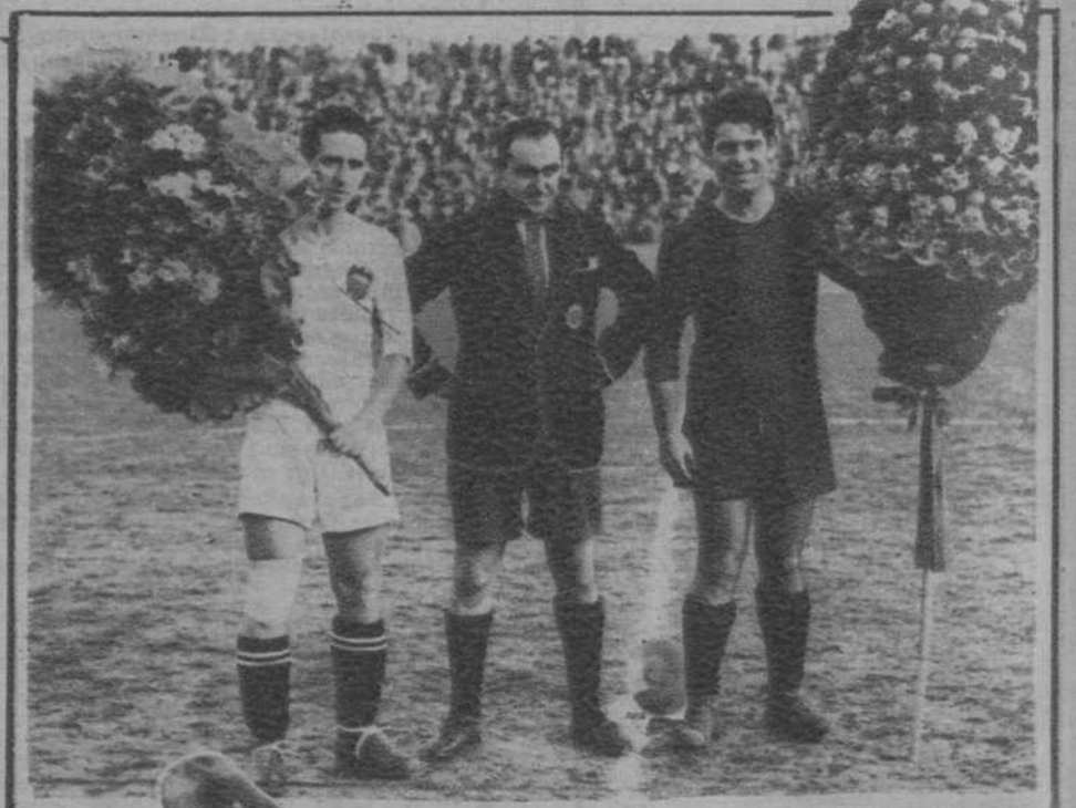
Los capitanes y el árbitro, momentos antes de comenzar el encuentro