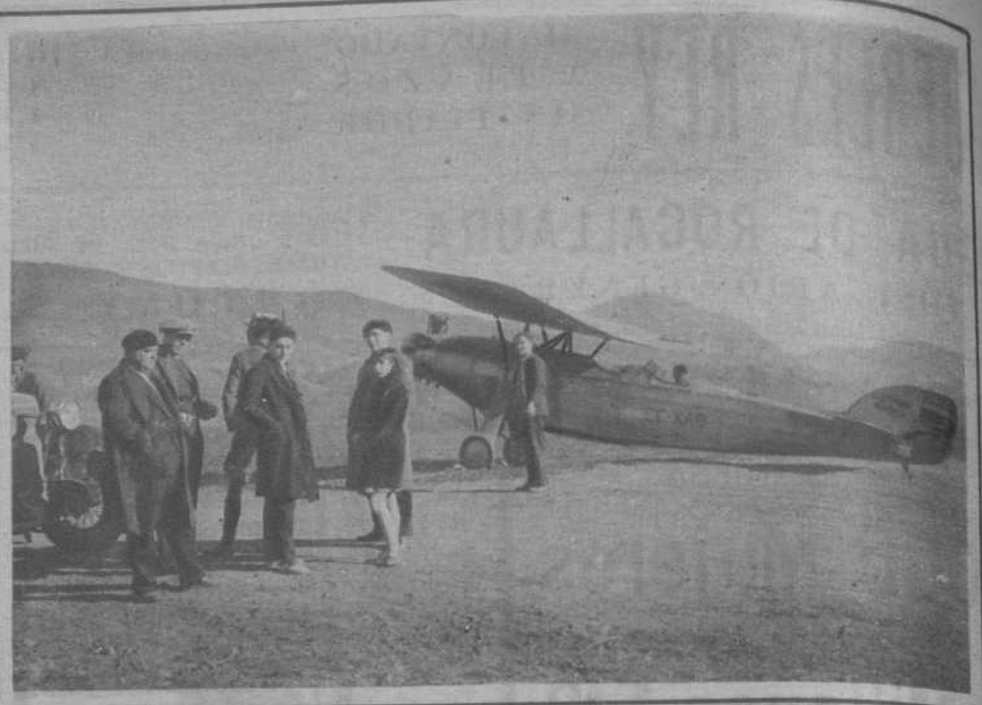
Seo de Urgel.—El primer avión que ha visitado el campo de aterrizaje de la línea Barcelona-Andorra, próxima a inaugurarse.