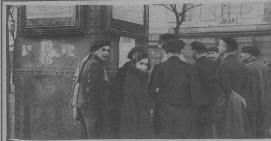
El público, leyendo el bando del gobernador civil, en el que garantizaba el mantenimiento del orden absoluto en la población