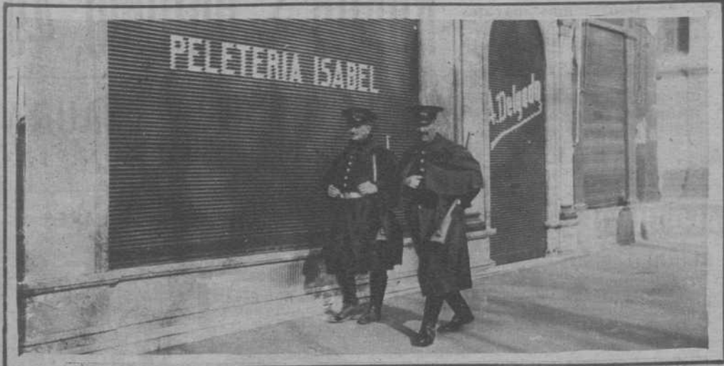
SAN SEBASTIAN.—LA FRACASADA HUELGA GENERAL. La Guardia de Seguridad, vigilando las calles, en previsión de desórdenes