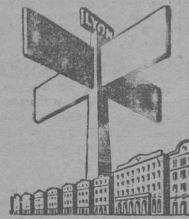
Los hombres de negocios de 54 naciones hacen sus compras en la Feria de Lyon. Secretario General Honorario: J. Fabre Garreté, Pelayo, 9. 2.ª

FERIA INTERNACIONAL DE LYON del 7 al 20 Marzo 1932