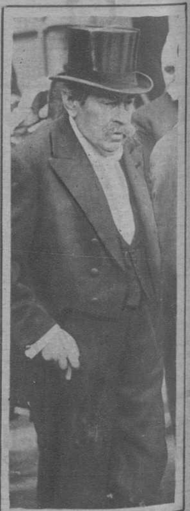
París.—El señor Briand, saliendo de visitar al Presidente del Consejo, a disposición del cual puso su cartera, horas antes de plantearse la crisis total.