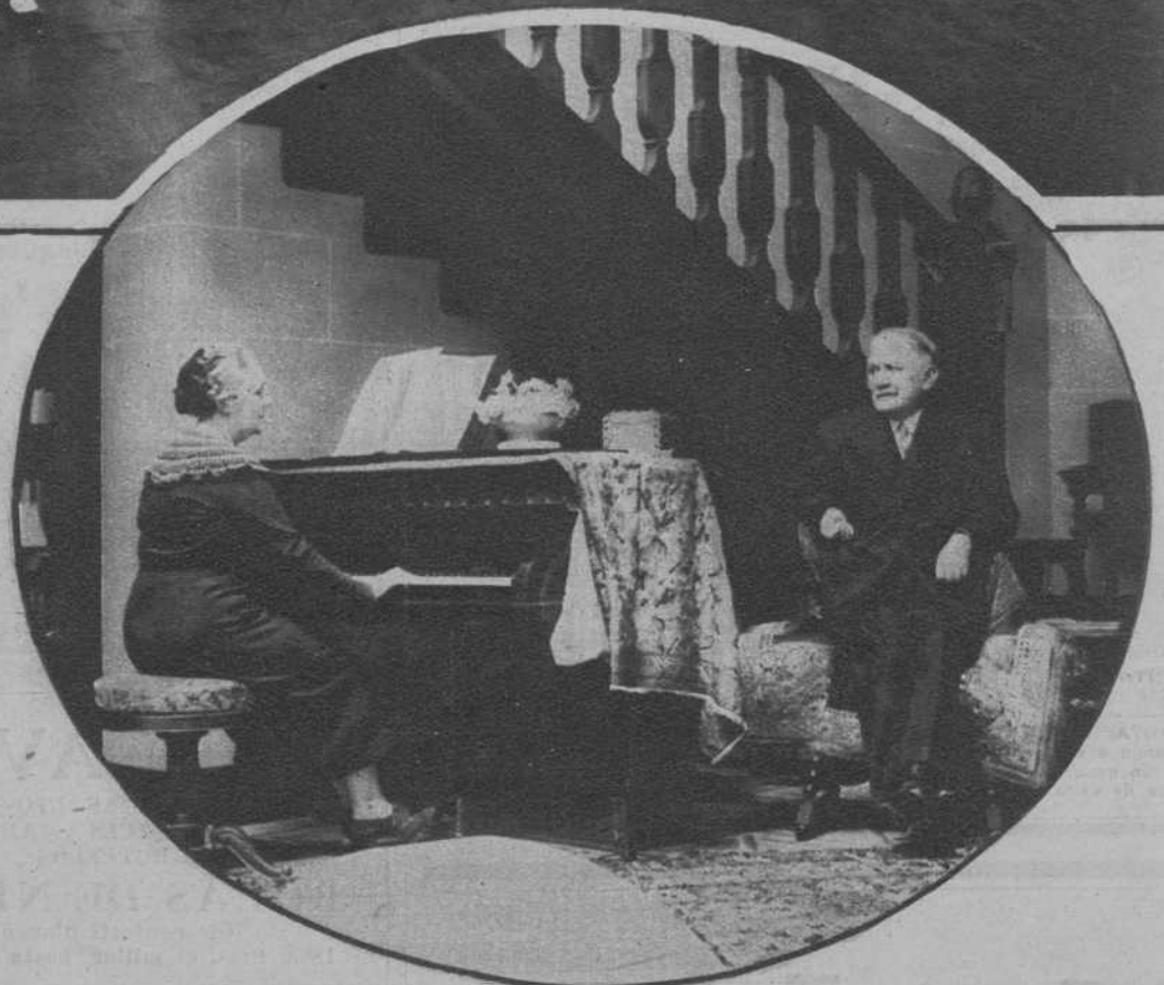
París. — He aquí una de las tranquilas veladas que pasa con su esposa, lejos del dinamismo gubernamental, en su posesión de Teurnefeuille, el ex Presidente de la República, señor Doumergue.