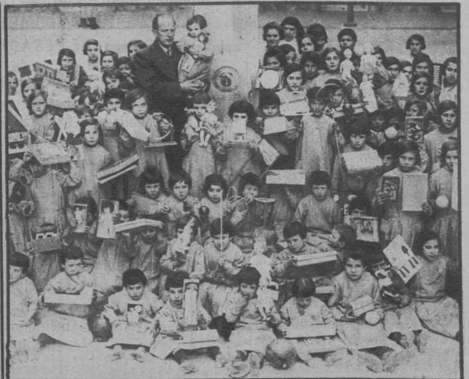
Valencia.—El director de la Casa de Misericordia, con los asilados de la misma, después del reparto de juguetes efectuado el día de Reyes.