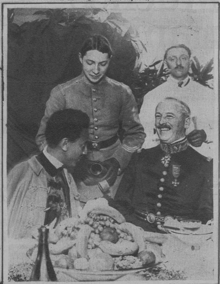
París. — En la Escuela militar de Saint-Cyr, el general Frères entrega al príncipe heredero de Etiopía, las insignias de alumno.