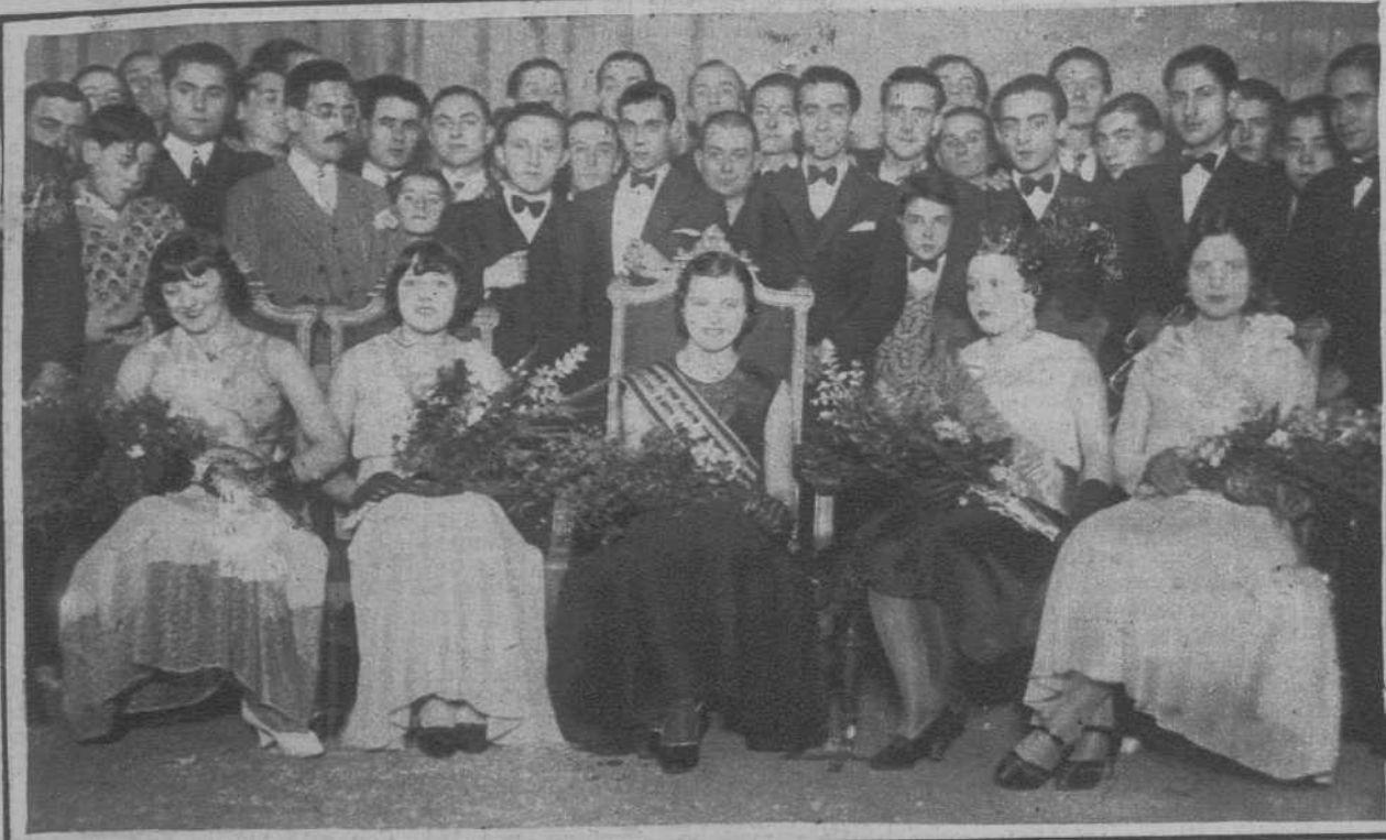
La bellísima señorita Cortiellas, que resultó elegida, con su Corte de Amor