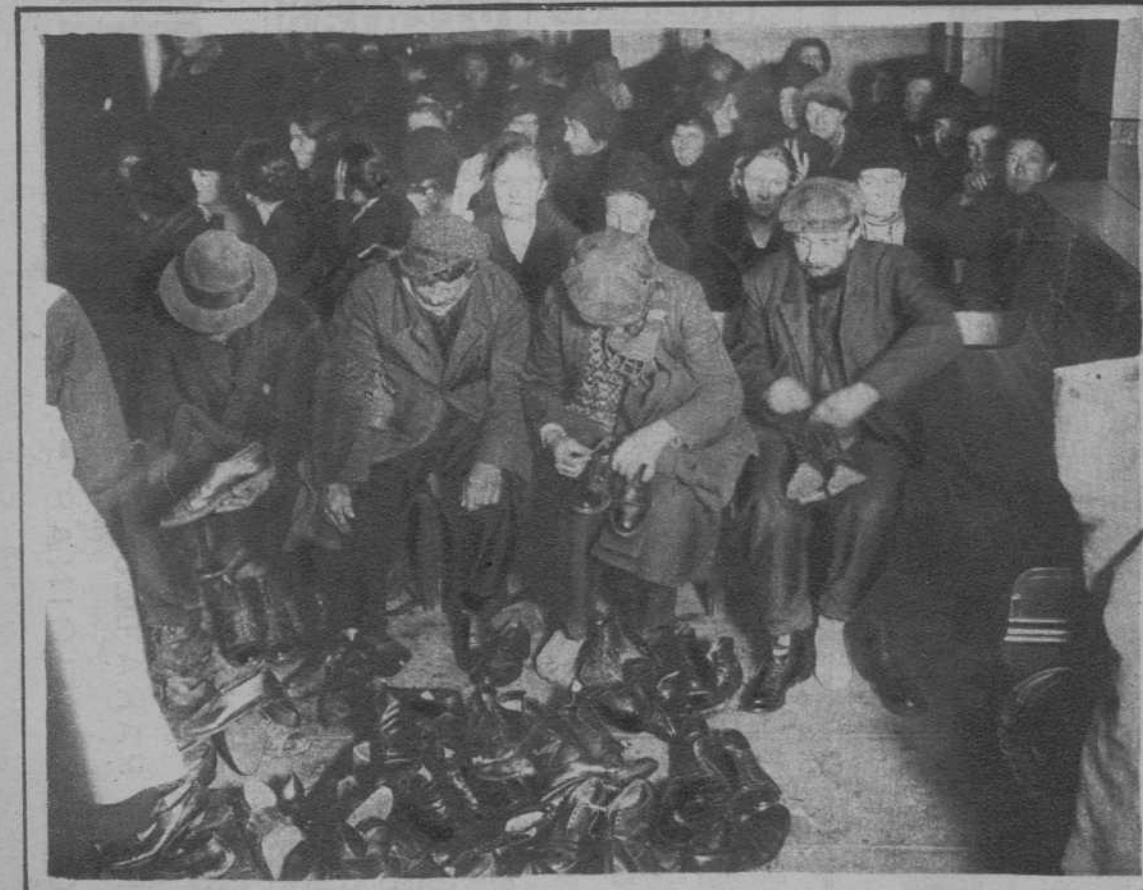
París. — Distribución de celzado entre los pobres, organizada por el «Ejército de Salvación».