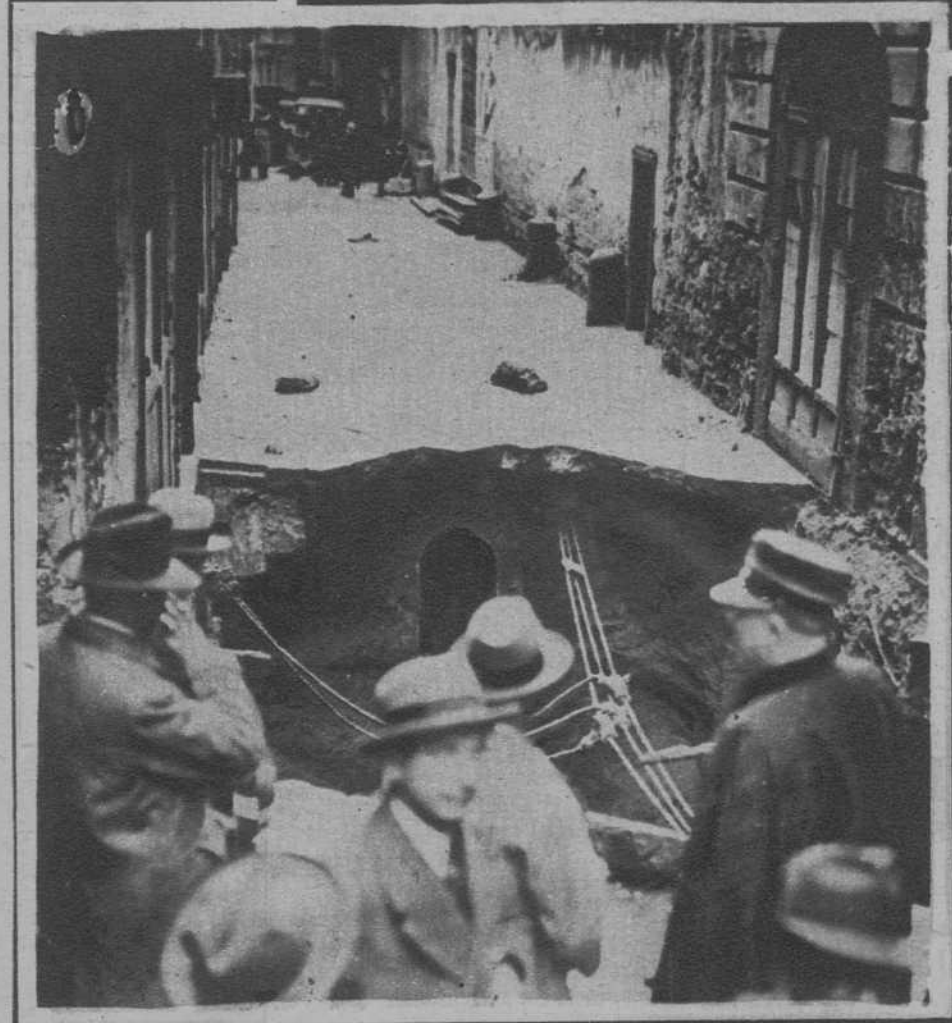
Nápoles. — A consecuencia de una ruptura en la cañería de conducción de agua, se ha hundido, tan completamente como se ve en la fotografía, el pavimento de un trozo de la «Vía Nuova».