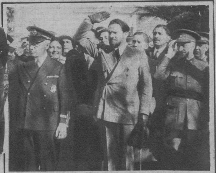
Tetuán.—El ministro del Aire, de Italia, general Balbo, presenciando el desfile de las tropas que le rindieron honores a su llegada a esta plaza, acompañado del Alto Comisario, señor López Ferrer, el general Benito y otras autoridades de la Zona.