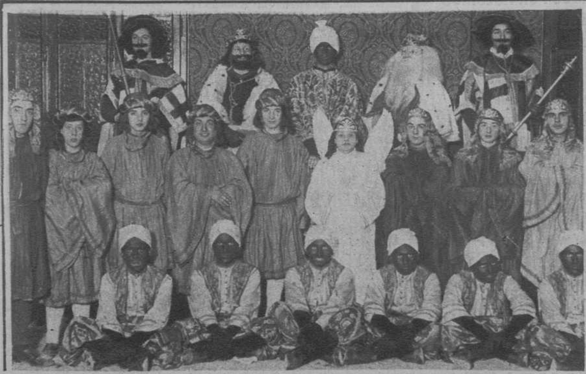
Igualada.—Los Reyes Magos y su séquito, que realizaron un reparto de juguetes, organizado por el «Centro Católico», entre los niños pobres.