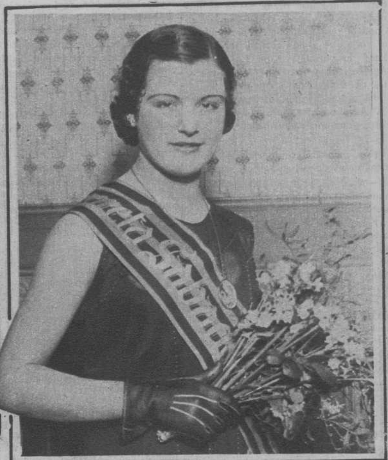
La «Señorita Sabadell 1932»