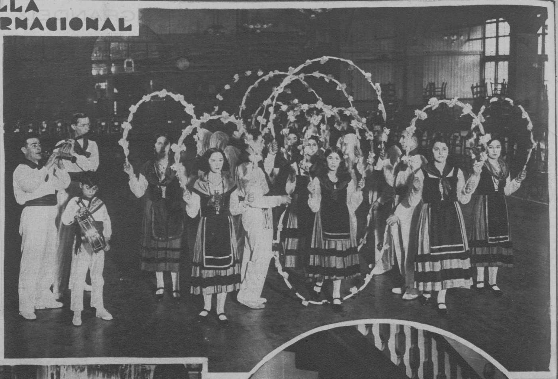
Londres. — El coro español «Voces Cantabras», durante su actuación en el festival celebrado en el «Royal Albert Hall».