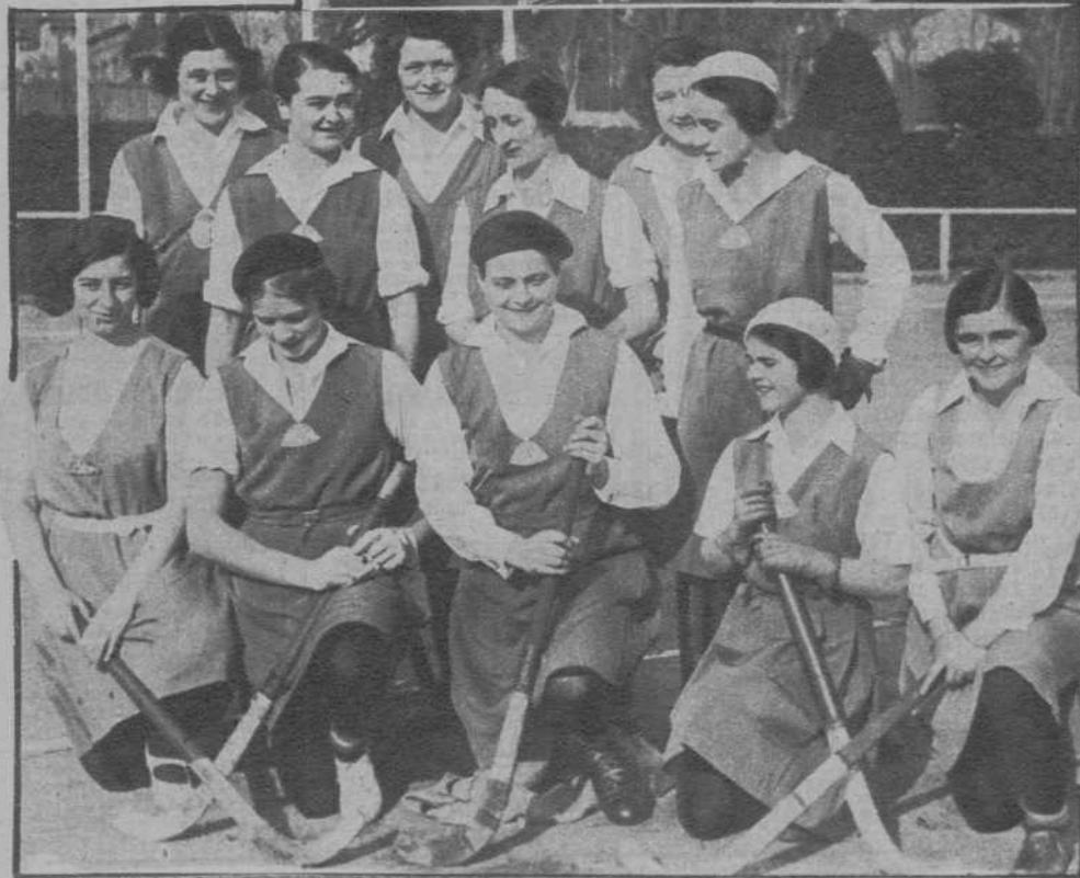
El equipo del «Royal Beerschot H. C.», de Amberes, que jugó anteayer contra el «Polo Club», de Barcelona, ganándole por 1 a 0.

El Presidente de la Generalidad, Sr. Maciá, y otras ilustres personalidades, presidiendo el festival celebrado en la Casa de Caridad.