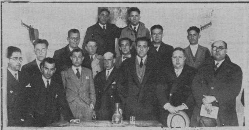
Córdoba. — Presidencia de la sesión constitutiva de la «Asociación de Trabajadores de la Enseñanza».

ASI COMO EN MONEDEROS, BOLSOS, ABANICOS Y SOMBRILLAS, ES LA PREFERIDA POR EL ABUELO NOEL PARA PROVEERSE DE TODOS LOS REGALOS