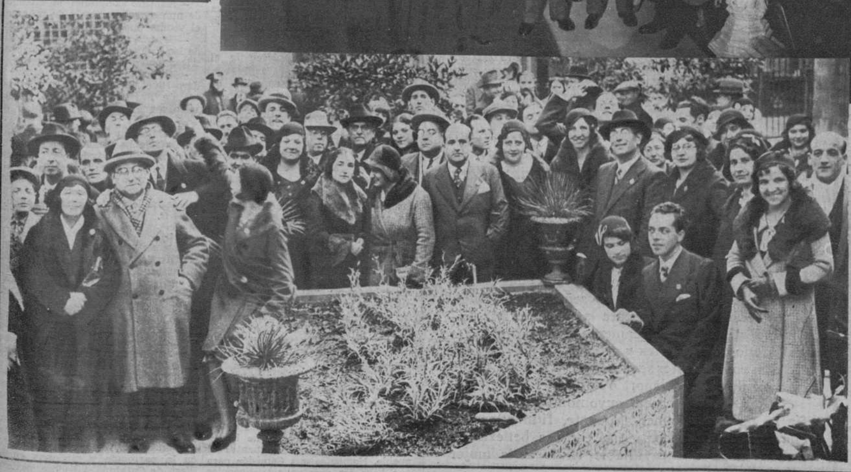
DEL I CONGRESO DEL MAGISTERIO PARTICULAR DE ESPAÑA.