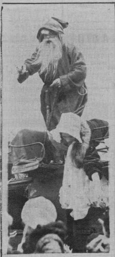
París. — El «Padre Noel», bajando de la diligencia que le llevó a la «República Libre de Montmartre», donde repartió juguetes entre los niños.