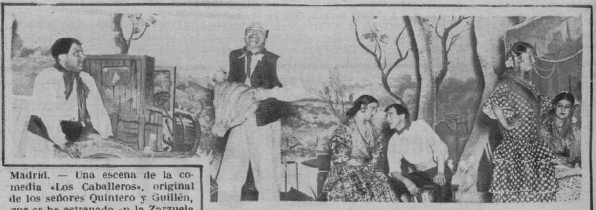
Madrid. — Una escena de la comedia «Los Caballeros», original de los señores Quintero y Guillén, que se ha estrenado en la Zarzuela